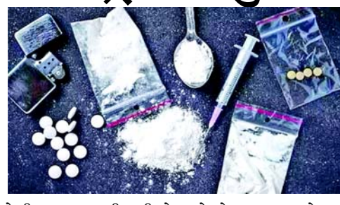
તેની તપાસ ચાલી રહી છે. ઓપરેશન ગરુડા હેઠળ ઈન્ટરપોલે આપેલી માહિતીને આધારે સીબીઆઈએ કસ્ટમ અધિકારીઓની મદદ લઈને ડ્રગ્સનો મોટો જથ્થો જમ કર્યો છે. સીબીઆઈ પ્રવક્તાએ એક નિવેદનમાં જણાવ્યું છે કે આખો કન્સાઈનમેન્ટ જમ કરી લેવામાં આવ્યો છે તથા એકાઈઆર દાખલ કરવામાં આવી છે.

વિશાખાપટ્ટનમ, સીબીઆઈએ ઈન્ટરપોલથી મળેલી માહિતીને આધારે આંધ્ર પ્રદેશના વિશાખાપટ્ટનમ પોર્ટ પર એક જહાજમાંથી કરોડો રૂપિયાનું ડ્રગ્સ જમ ક્યુ છે તેમ અધિકારીઓએ એક નિવેદનમાં જણાવ્યું છે. અધિકારીઓના જણાવ્યા અનુસાર કન્ટેનર વિશાખાપટ્ટનમમાં ડિલિવરી કરવા માટે સેન્ટોસ પોર્ટ, બ્રાઝિલમાંથી ભુક કરવામાં આવ્યું હતું. આ કન્ટેનર વિશાખાપટ્ટનમ સ્થિત ખાનગી કંપનીના નામે ભુક કરવામાં આવ્યું હતું. અધિકારીઓએ જહાજમાંથી ૨૫ કિલોગ્રામની એક એવી ૧૦૦૦ બેગ જમ કરી છે. પ્રાથમિક તપાસમાં જાણવા મળ્યું છે કે આ બેગમાં સૂકા ખમીરની સાથે કોકેઈન ભેળવવામાં આવ્યું હોવાનું માનવામાં આવી રહ્યું છે. બેગમાં માદક પદાર્થોના કુલ જથ્થો કેટલો છે