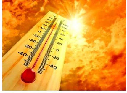
સંશોધકોના અનુસાર જીવાશ્મ ઇંધણના ઉત્સર્જનથી ગરમીના સ્તરમાં ૦.૧ ડીગ્રી સેલ્સિયસનો વધારો ખતરનાક રહેશે. કોલંબીયા વિવિના કાર્બન મોડેલની બહાર પડી શકે છે. આ બાબતમાં વૈશ્વિક મિલિયન ટન કાર્બનમાં વધારાથી દુનિયાભરમાં ૨૨૬ થી વધુ હીટવેવની ઘટનાઓ બનશે. જીવાશ્મ ઇંધણથી

વોશિંગ્ટન, દુનિયાભરમાં કાર્બન ડાયોક્સાઇડના સ્તરમાં વૃદ્ધિથી જલવાયુમાં પરિવર્તન આવી રહ્યું છે. એક અધ્યયન અનુસાર જીવાશ્મ ઇંધણના ઉત્સર્જનથી સદીના અંત સુધીમાં અત્યંત ગરમીથી ૧.૧૫ કરોડ લોકોના મોત થઈ શકે છે. આ દાવો અમેરિકાની પર્યાવરણ સંસ્થા ગ્લોબલ વિટનેસ અને કોલંબિયા વિશ્વ વિદ્યાલયના વૈજ્ઞાનિકોએ કર્યો છે. તેમના અનુસાર દુનિયાની મુખ્ય જીવાશ્મ ઇંધણ કંપનીઓ દ્વારા તેલ અને ગેસનું અપચારિત માત્રામાં ઉત્સર્જન કરવામાં આવી રહ્યું છે. જો ૨૦૦૦ સુધી ઉત્સર્જનનું સ્તર ન થયું તો ૨.૧૦૦ સુધીમાં ગરમી પોતાના ઘાતક સ્વરૂપે પહોંચી શકે છે. જેથી લાખો લોકોના જીવનો ખતરો છે.