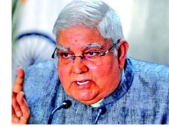
કાર્યક્રમ (ઇન-સ્ટેપ)ના સહભાગીઓ સાથે વાતચીત દરમિયાન કરી હતી. ૨૧ દેશોના આંતરરાષ્ટ્રીય પ્રતિનિધિઓ અને ૮ ભારતીય અધિકારીઓને સમાવતા આ બે અઠવાડિયાના કાર્યક્રમનું

નવીદિલ્હી, ઉપરાષ્ટ્રપતિ જગદીપ ધનખરે જણાવ્યું હતું કે, અર્થતંત્ર અને ટેકનોલોજીમાં ભારતનો ઉદય વિશ્વ શાંતિ, સંવાદિતા અને વૈશ્વિક વ્યવસ્થા માટે સૌથી મોટી ખાતરી સાથે છે. તેમણે એમ પણ ઉમેર્યું હતું કે, ભારત વૈશ્વિક શાંતિ, સ્થિરતા અને સંવાદિતા જાળવવા અને તેને જાળવવા સમાન વિચારધારા ધરાવતાં દેશોને સામેલ કરવા કટિબદ્ધ છે. આ ટિપ્પણીઓ ઉપરાષ્ટ્રપતિ નિવાસમાં ઉદ્ઘાટન આંતરરાષ્ટ્રીય વ્યૂહાત્મક જોડાણ