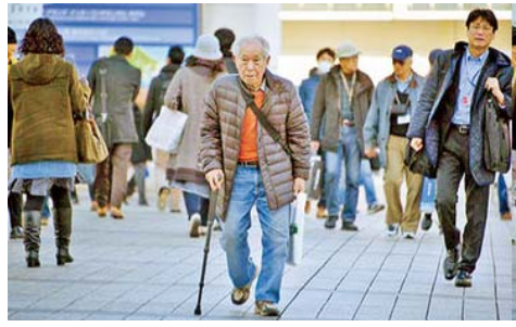
ઓફ વોર્શિંગ્ટન ખાતે ઈન્સ્ટિટ્યૂટ ફોર હેલ્થ મેટ્રિક્સ એન્ડ ઈવેલ્યુએશન દ્વારા કરવામાં આવ્યું છે. એક સંશોધકે કહ્યું કે, આપણે દાયકાઓથી જે અનુભવી

રહ્યા છીએ તે કંઈક એવું છે જે આપણે માનવ ઈતિહાસમાં પહેલાં જોયું નથી. IHME ના ડાયરેક્ટર ડો. ક્રિસ્ટોફર મુરેએ જણાવ્યું હતું કે આ પરિવર્તન માટે ઘણા કારણો છે, જેમાં શિક્ષણ અને રોજગારમાં મહિલાઓ માટે તકો અને ગર્ભનિરોધક અને પ્રજનન સ્વાસ્થ્ય સેવાઓની વધુ સારી પહોંચનો સમાવેશ થાય છે. વર્લ્ડ હેલ્થ ઓર્ગેનાઈઝેશનના જાતીય અને પ્રજનન સ્વાસ્થ્ય અને સંશોધન વિભાગના વૈજ્ઞાનિક ડો. ગીતાઉ મ્યુરુએ જણાવ્યું હતું કે બાળકોના ઉછેરનો ખર્ચ, બાળ મૃત્યુદરનું જોખમ અને લિંગ સમાનતા પ્રજનન દરમાં ઘટાડાનું કારણ બને છે. આ કારણોસર લોકો સંતાન પ્રાપ્તિથી ડરે છે.