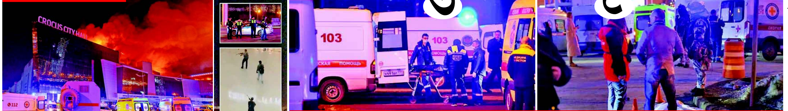
૬૦૦૦ લોકોનાં કાર્યક્રમમાં અંધાદૂંધ ગોળીબાર, ચારેબાજુ મૃતદેહો વેરવિખેર : મૃત્યુઆંક વધવાની શક્યતા

મોસ્કો રશિયાની રાજધાની મોસ્કોના કોક્સ સિટી હોલમાં થયેલા આતંકી હુમલામાં મૃત્યુઆંક ૬૦ પર પહોંચી ગયો છે. આંકડો વધવાની શક્યતા છે. ૧૦૦થી વધુ લોકો ઘાયલ થયા છે.