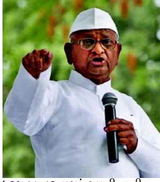
ધરપકડ કરવામાં આવી હતી. તેમણે વધુમાં કહ્યું કે હવે અરવિંદ કેજરીવાલ અને દિલ્હી સરકાર એ વાત પર ધ્યાન આપશે કે જેમણે ભૂલો કરી છે તેમને સજા મળવી જોઈએ.

નવીદિલ્હી, દિલ્હીના મુખ્યમંત્રી અરવિંદ કેજરીવાલને એન્ફોર્સમેન્ટ ડિરેક્ટોરેટ (ઈફ) દ્વારા ૨૧ માર્ચ, ગુરુવારે દિલ્હીના કથિત શરાબ કૌભાંડમાં ધરપકડ કરવામાં આવી હતી, ત્યારબાદ આમ આદમી પાર્ટીના તમામ નેતાઓમાં ગુસ્સાનું વાતાવરણ છે. કેજરીવાલની ધરપકડ બાદ સમાજસેવક અણ્ણા હજારેએ પ્રતિક્રિયા આપી છે. કેજરીવાલની ધરપકડ પર ટિપ્પણી કરતા તેમણે કહ્યું કે એક સમયે અમે બંને દાડૂ જેવા બ્રહ્મચાર સામે એક સાથે ઉભા