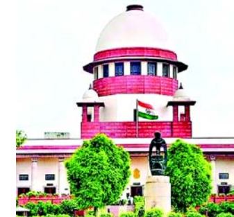
થોડી ટિપ્પણી કરવી પડશે. મહેરબાની કરીને રાજ્યપાલને જણાવો કે અમે આ અંગે ખૂબ જ ગંભીરતાથી વિચાર કરીશું. સુપ્રીમ કોર્ટની આ બેંચમાં જસ્ટિસ જે.બી. પારડીવાલા અને

નવીદિલ્હી, સુપ્રીમ કોર્ટે તમિલનાડુના ધારાસભ્ય પોનમુડીના મંત્રી તરીકે શપથ લેવાનો ઈનકાર કરવા બદલ અપવાદ લીધો હતો અને રાજ્યના રાજ્યપાલ પર ભારે આકરા પ્રહારો કર્યા હતા. મુખ્ય ન્યાયાધીશ ડી.વાય. ચંદ્રચૂડની આગેવાની હેઠળની બેન્ચે કેન્દ્રના ટોચના કાયદા અધિકારી એટર્ની જનરલ આર. વેંકટરામણની કહ્યું, 'તમારા રાજ્યપાલ શું કરી રહ્યા છે? સુપ્રીમ કોર્ટે એક મંત્રીની સજા પર રોક લગાવી છે અને રાજ્યપાલ કહે છે કે 'હું તેમને શપથ નહીં અપાવીશ.' તમે રાજ્યપાલને કહો કે હવે અમારે