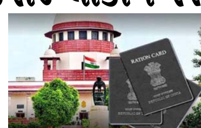
રાજ્યો દ્વારા ડ્રાય રાશન પર ૨૦૨૨ માં જાહેર કરાયેલ સર્વોચ્ચ અદાલતના નિર્દેશોનું પાલન ન કરવાનો આક્ષેપ કરવામાં આવ્યો હતો. તેના ૨૦૨૨ ના આદેશમાં, સુપ્રીમ કોર્ટે કહ્યું હતું કે સૂકું રાશન પૂર્ન પાડતી વખતે, રાજ્ય એવા પરપ્રાંતિય મજૂરો પાસેથી ઓળખ કાર્ડ માંગશે નહીં કે જેમની પાસે રેશન કાર્ડ નથી. ત્યારબાદ કોર્ટે ક્રેવિડ સમયગાળા દરમિયાન રાષ્ટ્રીય રાજધાની દિલ્હી સહિત અન્ય શહેરોમાં ફસાયેલા પરપ્રાંતિય મજૂરોને માત્ર સ્વ-ધોષણાના આધારે સૂકું રાશન આપવાનો આદેશ આપ્યો

નવીદિલ્લી, સુપ્રીમ કોર્ટે રાજ્ય સરકારો અને કેન્દ્રશાસિત પ્રદેશોને આદેશ આપ્યો છે કે જે લોકો કેન્દ્ર સરકારના ઈ-શ્રમ પોર્ટલ પર નોંધાયેલા છે અને અસંગઠિત ક્ષેત્રોમાં કામ કરે છે તેમને બે મહિનાની અંદર રેશન કાર્ડ બનાવવા. આવા લોકોની સંખ્યા લગભગ આઠ કરોડ છે. રેશન કાર્ડ બનાવવાથી આવા લોકો કેન્દ્ર અને રાજ્ય સરકારોની યોજનાઓ અને રાષ્ટ્રીય ખાદ્ય સુરક્ષા અધિનિયમ ૨૦૧૭ હેઠળ લાભ મેળવી શકશે. અહેવાલ મુજબ, જસ્ટિસ હિમા