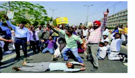
આવાસનો ઘેરાવ કરશે. કેજરીવાલની ૨૧ માર્ચ દારૂ પોલિસી કૌભાંડ કેસમાં તેમના નિવાસસ્થાનેથી ધરપકડ કરવામાં આવી હતી. તે ૨૮ માર્ચ સુધી EDની કસ્ટડીમાં છે.

દિલ્હીમાં AAP અને BJPનું પ્રદર્શન નવીદિલ્હી, ભાજપ અને આમ આદમી પાર્ટીના કાર્યકરો આજે દિલ્હીમાં વિરોધ પ્રદર્શન કરી રહ્યા છે. AAP કાર્યકરોનું પ્રદર્શન મુખ્યમંત્રી અરવિંદ કેજરીવાલની ધરપકડના વિરોધમાં છે, જ્યારે ભાજપના કાર્યકરો કેજરીવાલ મુખ્યમંત્રી પદ પરથી રાજીનામું આપે તેવી માંગ સાથે વિરોધ પ્રદર્શન કર્યું છે. દિલ્હીના મુખ્યમંત્રી અરવિંદ કેજરીવાલની ધરપકડના વિરોધમાં આમ આદમી પાર્ટીનો વિરોધ ચાલુ છે. આજે પાર્ટી વડા પ્રધાનના