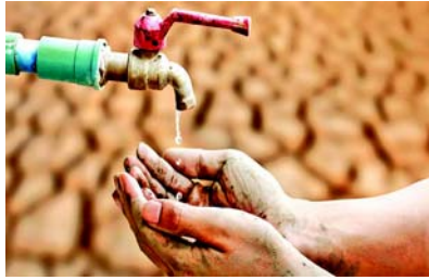
સૂકાઈ ગયા છે.

નવીદિલ્લી, કેન્દ્રીય જળ કમિશનના લેટેસ્ટ બુલેટીનમાં ઉનાળા પહેલાં થતી ગયેલા પાણીના જથ્થા બાબતે ચિંતા વ્યક્ત કરવામાં આવી હતી. ગત વર્ષની સરખામણીએ આ વર્ષે ઉનાળા પહેલાં ઓછો પાણીનો જથ્થો બચ્યો છે. દેશના ૧૫૦ મોટાં જળાશયોના જળસ્તરના આધારે રજૂ થયેલા અહેવાલ પ્રમાણે હવે માત્ર ૩૮ ટકા પાણીનો જથ્થો જ બચ્યો છે એટલે ઉનાળામાં કેર-કેર પાણીની અછત સર્જાય તેવી ભીતિ છે. બેંગલુરુમાં પાણીનું ગંભીર જોખમ સર્જાયું છે. બેંગલુરુમાં ૧૪ હજાર કરતાં વધુ બોરવેલ છે, એમાંથી ૬૯૦૦ એટલે કે અડધો અડધ