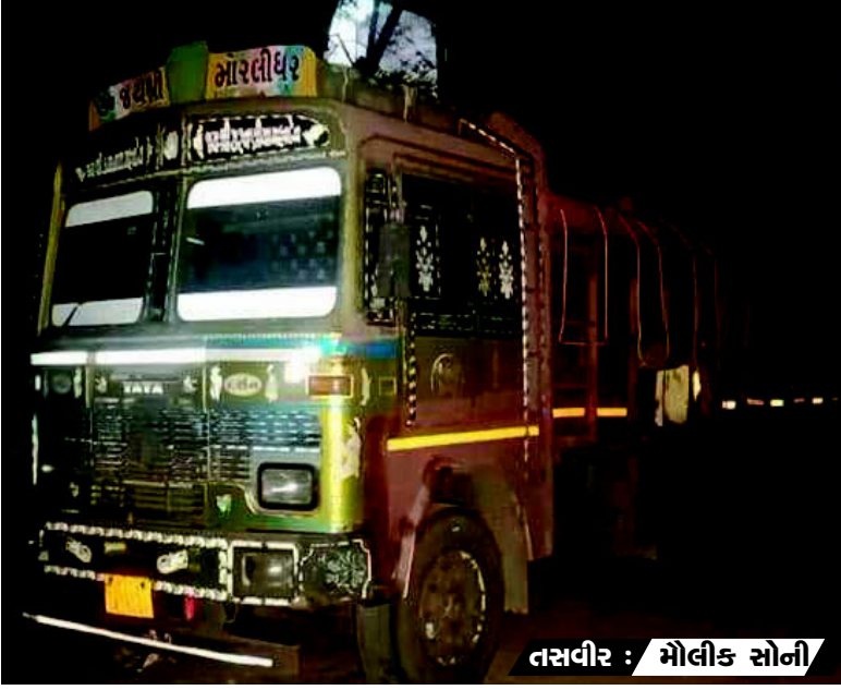
ગામ નજીક બાતમી વાળા ટોરસ ને અટકાવી ટ્રકની તલાશી લેતા ટ્રક નંબર જ્ઞ ૦૪ એટી ૮૦૫૧ ટ્રકની અંદર રાખેલ ડુંગળીની

વરતેજ પોલીસ સ્ટાફ શનિવારે મોડી રાત્રે પેટ્રોલિંગમાં હતો તે દરમિયાન બાતમી મળી હતી કે, ધોલેરા તરફથી ડુંગળીની બોરીઓની આડમાં વિદેશી દારૂ અને બિયરનો જથ્થો છુપાવી એક ટોરસ ટ્રક ભાવનગર તરફ આવી રહ્યો છે, જે બાતમીના આધારે વરતેજ પોલીસે વોચમાં રહી નારી