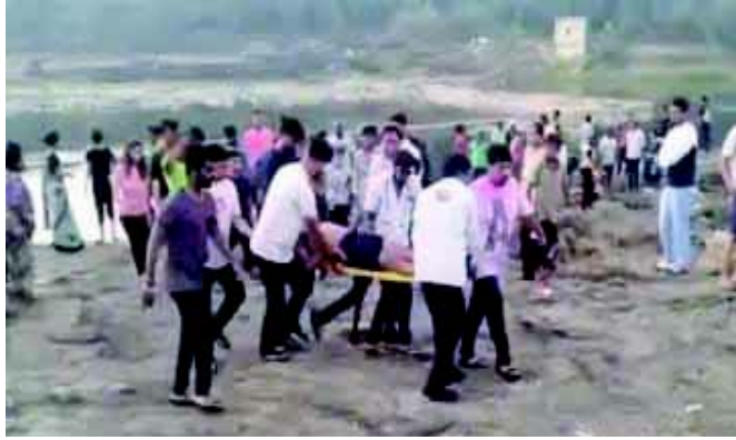
ભાવનગર, તા. ૨૬ રાજ્યમાં ડૂબી જવાની અલગ રંગોત્સવના દિવસે જ અલગ ૮ ઘટનામાં ૧૩ લોકોના મોત થયા છે. ભાવનગર-તળાજાના મણાર ગામ પાસે આવેલા ચેકડેમમાં ત્રણ યુવાનો

ડૂબતાં મોત નીપજ્યા હતા. તો ખેડાના વડતાલમાં ગોમતી તળાવમાં ત્રણ વિદ્યાર્થી ડૂબી જતાં મોત થયા હતા. આ ઉપરાંત બનાસકાંઠાના પાલનપુરની બાલારામ નદીમાં ડૂબવાથી ૨ યુવકોના મોત થયા હતા. ઘુળેટીની ઉજવણીને લઈ ડીસાના યુવકો નદીમાં નાહવા પડતા જીવ ગુમાવવાનો વારો આવ્યો હતો. તો મહીસાગરના રણજીતપુરાના પીપળી ખેત તલાવડીમાં બાળકનું ડૂબવાથી મોત નીપજ્યું હતું. આ સહિતની કુલ આઠ ઘટનામાં તેરના મોત થયા છે.