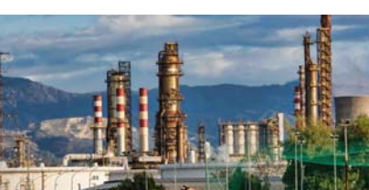
રશિયામાંથી ભારતીય કંપનીઓની ઓઈલની આયાત થતી હતી. ભારતની ઓઈલની કુલ આયાત ફેબ્રુઆરીમાં ૧૦ ટકા ઘટીને રોજના ૪૭.૨ લાખ બેરલ થઈ હતી. સરકારના પ્રાથમિક ડેટા કરતાં આ ઘટાડો વધારે છે. કારણ કે સરકારે કેટલાક પાર્સલ ફેબ્રુઆરીમાં આવ્યા તે માર્ચમાં ડિસ્ચાર્જ કર્યા હોવાથી ગણતરી માર્ચમાં કરી છે. સાઉથ અમેરિકાના દેશોમાંથી ભારતની આયાત વધી છે. તેનું કારણ વેનેઝુએલામાંથી ઓઈલની આયાત વધી છે. ફેબ્રુઆરીમાં વેનેઝુએલા યોથા કમન્યુસીટી મોટુ સપ્લાયર હતું. બીજી તરફ ભારતે ફેબ્રુઆરીમાં ઈરાકમાંથી આયાત ૩૨ ટકા ઘટાડી છે.

નવીદિલ્લી, ભારતની રશિયામાંથી કૂડ ઓઈલની આયાત જાન્યુઆરીની સરખામણીમાં ફેબ્રુઆરીમાં વધી છે. આ રીતે છેલ્લાં બે મહિનાથી જે ઘટાડો થયો હતો તે રિવર્સ થયો છે. ઈન્ડસ્ટ્રીમાંથી મળેલા ડેટા અનુસાર રિફાઈરી કંપનીઓએ રશિયામાંથી લાઈટ સ્વીટ સો કોલ ગ્રેડ ઓઈલ ખરીદ્યું છે. ફેબ્રુઆરીમાં ભારતીય રિફાઈરી કંપનીઓએ રોજનું ૧.૫ લાખ બેરલ ઓઈલ ખરીદ્યું છે, જે જાન્યુઆરીની સરખામણીમાં ૨.૮ ટકા વધારો દર્શાવે છે. જોકે ફેબ્રુઆરી-૨૦૨૩ની સરખામણીમાં તેમાં ૧.૨ ટકાનો ઘટાડો થયો