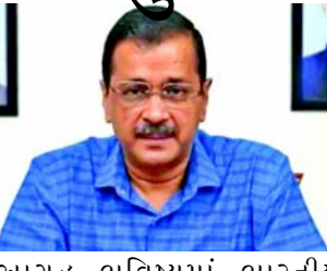
આગ્રહ ભવિષ્યમાં ભારતીય રાજકારણને વધુ પોકળ બનાવશે.

મુંબઈ, કોંગ્રેસના નેતા સંજય નિરુપમે દિલ્હીના મુખ્યમંત્રી અરવિંદ કેજરીવાલની ધરપકડ પર ટિપ્પણી કરતા કહ્યું કે આ પહેલીવાર થઈ રહ્યું છે કે કસ્ટડીમાં હોવા છતાં પણ તેઓ મુખ્યમંત્રી પદને વળગી રહ્યા છે. તેમણે કહ્યું કે કેજરીવાલે તાત્કાલિક પોતાના પદ પરથી રાજીનામું આપવું જોઈએ. ભારતીય રાજનીતિમાં માત્ર ૧૧ વર્ષ જૂની પાર્ટી સંપૂર્ણપણે અનૈતિક બની રહેલી રાજનીતિનો દાખલો બેસાડી રહી છે. કેજરીવાલ જાનો પોતાના પદને વળગી રહેવાનો