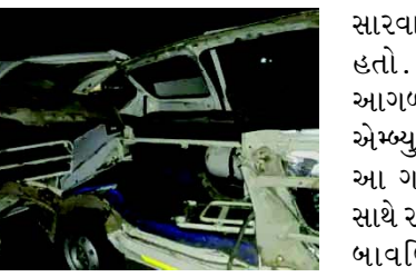
રાજકોટ-ચોટીલા હાઈવે પર સવારનાં સુમારે ચોટીલા તરફથી આવી રહેલ એમ્બ્યુલન્સમાં દર્દીને

૧૦૮ એમ્બ્યુલન્સને જ નડ્યો અકસ્માત ત્રણના મોત અને દર્દીનો આબાદ બચાવ રાજકોટ, રાજકોટ-ચોટીલા હાઈવે ફરી એક વખત રક્તરંજીત થયો છે. હાઈવે પર ટૂંક પાછળ એમ્બ્યુલન્સ ઘૂસી જતા એમ્બ્યુલન્સમાં દર્દીને સારવાર અર્થે લઈ જઈ રહેલ ૩ લોકોનાં ઘટનાં સ્થળે જ મોત નિપજ્યા હતા જ્યારે એક વ્યક્તિનો બચાવ થયો હતો. મળતી માહિતી મુજબ