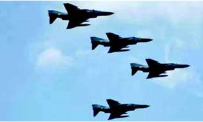
જાપાનના ફાઈટર પ્લેન.

જાપાને એક મોટો નિર્ણય લીધો છે. આ પહેલીવાર છે જ્યારે જાપાને તેના શાંતિવાદી સિદ્ધાંતોને છોડીને ફાઈટર એરક્રાફ્ટ વેચવાનો નિર્ણય લીધો છે. જાપાન અન્ય દેશોની સાથે બ્રિટન અને ઈટાલી સાથે મળીને તેના ફાઈટર એરક્રાફ્ટને વિકસાવી રહ્યું છે. આ નિર્ણય બાદ જાપાન સંયુક્ત ફાઈટર જેટ પ્રોજેક્ટમાં તેની ભૂમિકા સુનિશ્ચિત કરશે. જાપાનની કેબિનેટે શસ્ત્રો સાધનોની માર્ગદર્શિકામાં સુધારાને પણ સમર્થન આપ્યું હતું. આનાથી અન્ય દેશોને ફાઈટર એરક્રાફ્ટ સહિતના ઘાતક હથિયારોના વેચાણની મંજૂરી મળશે. તમને જણાવી દઈએ કે આ પહેલા જાપાનમાં શાંતિવાદી બંધારણ હેઠળ હથિયારોની નિકાસ પર પ્રતિબંધ હતો. હવે તેણે ચીન સાથે વધી રહેલા વૈશ્વિક તણાવ વચ્ચે આ પગલું ભર્યું છે. હાલમાં, જાપાન અમેરિકા દ્વારા ડિઝાઇન કરાયેલા એફ-૨ ફાઈટર પ્લેન અને બ્રિટન દ્વારા ઉત્પાદિત થયેલા યુરોફાઈટર ટાયફૂનને બદલવા માટે નવી ટેકનોલોજી ફાઈટર પ્લેન તૈયાર કરી રહ્યું છે. ઈટાલી અને બ્રિટન આ કામમાં જાપાનને સહકાર આપી રહ્યા છે. આ એક્શન પ્લાનને ગ્લોબલ કોએમ્પેટ એર