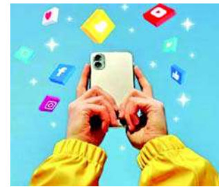
યુનાઈટેડ સ્ટેટ્સના ફ્લોરિડા રાજ્યમાં ૧૪ વર્ષથી ઓછી ઉંમરના બાળકો પર સોશિયલ મીડિયા પ્લેટફોર્મનો ઉપયોગ કરવા પર પ્રતિબંધ મૂકવામાં આવ્યો છે.

ફ્લોરિડા, આજકાલ લગભગ દરેક લોકો સોશિયલ મીડિયા વાપરે છે. શાળામાં ભણતા બાળકોથી લઈને વૃદ્ધો દરેક લોકો સોશિયલ મીડિયાનો અદ્યતન ઉપયોગ કરે છે. જો કે ઘણા એવા કિસ્સાઓ પણ સામે આવ્યા છે જેમાં સોશિયલ મીડિયાને કારણે બાળકો પર ખરાબ અસર પણ પડી હોય. યુનાઈટેડ સ્ટેટ્સના રાજ્યમાં ૧૪ વર્ષથી ઓછી ઉંમરના બાળકો પર સોશિયલ મીડિયા પ્લેટફોર્મનો ઉપયોગ કરવા પર પ્રતિબંધ મૂકવામાં આવ્યો છે. ૨૫ માર્ચના રોજ ફ્લોરિડા રાજ્યના ગવર્નર રોને ડેવોસ્ટોને કાયદો પર હસ્તાક્ષર કર્યા હતા જેમાં કહેવામાં આવ્યું છે કે ૧૪ થી ૧૫ વર્ષની વયના બાળકોને પણ સોશિયલ મીડિયાનો ઉપયોગ કરવા માટે માતાપિતાની સંમતિની જરૂર પડશે. આ પગલું બાળકોને તેમના માનસિક સ્વાસ્થ્ય માટેના આનંદાઈન જોખમોથી બચાવવા માટે છે. સોશિયલ મીડિયા પ્લેટફોર્મને તેમના સોશિયલ મીડિયા એકાઉન્ટ્સ બંધ કરવા પડશે. જેમાં માતાપિતાની સંમતિ નથી.