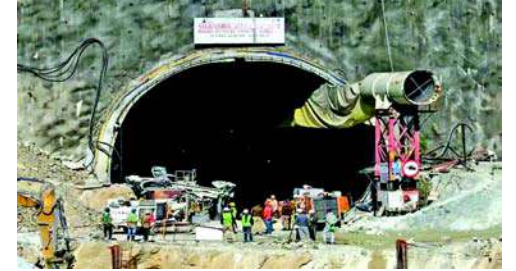
કાટમાળ હટાવવાનું કામ શરૂ થવાનું છે.

ઉત્તરકાશી, ઉત્તરાખંડમાં નિર્માણાધીન સિલ્કવારા ટનલ દુર્ઘટનાને ઘણો સમય થઈ ગયો છે. પરંતુ આ અકસ્માતને કોઈ ભૂલી શક્યું નથી. ટનલના નિર્માણ દરમિયાન, આસપાસના વિસ્તારમાં ભૂસ્ખલનને કારણે ટનલ તૂટી ગઈ હતી. જેમાં ૪૩ મજૂરો ઘટાપા હતા અને તેમના બચાવ માટે ભારે જહેમત ઉઠાવવી પડી હતી. જો કે તમામ કામદારોને સુરક્ષિત બહાર કાઢવામાં આવ્યા હતા. નિર્માણાધીન ટનલનો કાટમાળ હટાવવાનું કામ શરૂ થવાનું છે. રિપોર્ટ અનુસાર કાટમાળ હટાવવામાં ૨૦ કરોડ રૂપિયાનો ખર્ચ થશે. સ્વિસ કંપનીએ ડીપીઆર તૈયાર કર્યો છે. આ કાટમાળ સિલ્કિયારામાં જ ડિમ્પિંગ ગ્રાઉન્ડમાં નાખવામાં આવશે. કહેવામાં આવી રહ્યું છે કે ત્રણ-ચાર દિવસમાં કાટમાળ હટાવવાનું કામ શરૂ થઈ જશે. તમને જણાવી દઈએ કે થોડા દિવસો પહેલા પણ ઉત્તરકાશીમાં યમુનોત્તરી હાઈવે પર નિર્માણાધીન પ્રખ્યાત સિલ્કવારા ટનલમાંથી એક ટુનલ સમાચાર સામે આવા ઘટના. અહીં ફરી એકવાર ઘટનાક અકસ્માત સર્જ્યો છે. ટનલની બહાર કામ કરી રહેલું લોડર મશીન અચાનક રોડની બહાર પલટી ગયું હતું.