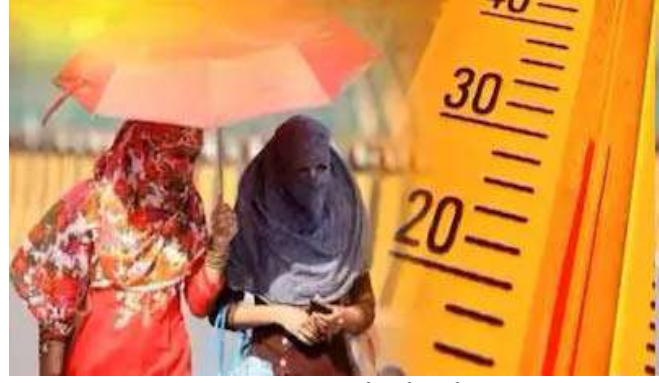
૩૯.૯ ડિગ્રી, કંડલા ૩૭.૬ ડિગ્રી, કેશોદ ૩૮.૫ ડિગ્રી નોંધાયેલ છે હવામાન વિભાગની

અમદાવાદ, રાજ્યમાં અંગ દઝાડતી ગરમીનો એહસાસ થઈ રહ્યો છે. સોમવારે પૂર્ણેટીના તહેવારમાં પણ લોકોને આકરી ગરમીનો સામનો કરવો પડ્યો હતો. મોટાભાગના શહેરોનું તાપમાન ૩૮ ડિગ્રી પાર નોંધાયું હતું. તો રાજકોટમાં સૌથી વધુ ૩૯.૯ ડિગ્રી તાપમાન નોંધાયું હતું. ગુરૂવાર સુધી ગુજરાતમાં તાપમાનનો પારો ૪૦ને પાર જશે તેવી ચેતવણી છે. તો બીજી તરફ હજી પણ બેવડી ઋતુમાં લોકો બીમાર પડી રહ્યા છે. રાજ્યમાં ૨૪ કલાકમાં નોંધાયેલ તાપમાનના આંકડા જોઈએ તો અમદાવાદ ૩૮.૫ ડિગ્રી, ગાંધીનગર ૩૮.૫ ડિગ્રી, ડીસા ૩૮.૪ ડિગ્રી, વડોદરા ૩૮.૬ ડિગ્રી, ભાવનગર ૩૭.૪ ડિગ્રી, રાજકોટ ૩૮.૯ ડિગ્રી, સુરેન્દ્રનગર ૩૯.૫ ડિગ્રી, મહુવા ૩૮.૦ ડિગ્રી, ભુજ