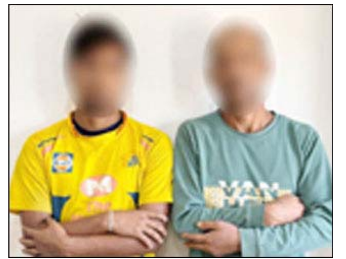
તાળાં તોડી અંદર પ્રવેશી કબાટ-તિજોરી તોડી રોકડા-દાગીના ચોરી ચોરી કરી નેપાળ, મુંબઈ, બેંગ્લોર મોજશોખ કરવા જતાં રહી બાદ ફરી પાછા આવી ચોરી કરવાની ટેવ ધરાવતા હોવાની વિગતો પૂલી આવી હતી. આ બંનેએ અહીં વર્ષ દરમિયાન અન્ય શખ્સો સાગરીતો સાથે મળી પત્રકાર સોસાયટી, બીજા બાજાર પાછળ સાઈનગર, હેલા શ્રેયસ સોસાયટી એરપોર્ટ ફાટક નજીક, વૈશાલીનગર, મહિલા કોલેજ અન્ડર બ્રીજ પાસે, સાધુ વાસવાણી રોડ ત્રિવેણી સાઈનગર, મોખાસા પાર્કમાં, જલારામ-૨ ઉમીયા ચોકમાં, મોન્ટાબેલા એપાર્ટમેન્ટમાં અને મોરબી સનાળા રોડના મકાનમાં ચોરી કર્યાની કાબલાત આપતા તેની ધરપકડ કરવામાં

(ઉ.વ.૨૩-૨૬) તિરૂપતી સોસાયટી-૪, મુળ માલકોટતા. કુમલ જી. કાલીકોટ નેપાળ)ને શહેરમાં ૧૬ મકાનોના તાળાં તોડી ચોરીઓ કરનાર પાણીના ટાંકા પાસેથી ચોરીના સાધનો, મોબાઈલ ફોન, રોકડા રૂા. ૧૨૩૦૦ સાથે પકડી આગવીદબે પુછપરછ કરતાં બંનેએ ૧૨ જેટલી ચોરીઓ કબુલી હતી. આ બંને શખ્સ પોતાના વતનના ઓળખીતા લોકો સાથે રહે છે અને શહેરની અલગ અલગ વિસ્તારની સોસાયટીઓમાં, એપાર્ટમેન્ટમાં ચોરીદાર તથા કાર વોશ કરવા જતાં માણસો પાસેથી બંધ મકાનની માહિતી મેળવી રાત્રીના રેકી કરી બંધ મકાનના