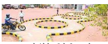
૧૦૦ અરજીનો ઉમેરો કરી પેન્ડીંગ કામને સરભર કરી દેવામાં આવશે. ઉલ્લેખનીય છે કે, સુરત આરટીઓમાં આજે પૉથી વધુ લોકોએ ટેસ્ટિંગ ટ્રેક ફરી શરૂ થતા ટેસ્ટ આપ્યો હતો.

અમદાવાદ, ગુજરાતભરની RTO કચેરીમાં ડ્રાઈવિંગ ટેસ્ટ ટ્રેક માટેનું સર્વે છેલ્લા ૧૨ દિવસથી બંધ હતું. જે ૨૮ માર્ચથી ફરીથી કાર્યરત થતા ડ્રાઈવિંગ ટેસ્ટ માટે આવતા અરજદારોની મુશ્કેલીનો અંત આવ્યો છે. આજથી ફરી ડ્રાઈવિંગ ટેસ્ટ શરૂ થતાં અમદાવાદ, સુરત, વડોદરા, રાજકોટ સહિતના જિલ્લાઓમાં આરટીઓ ખાતે અરજદારો ડ્રાઈવિંગ ટેસ્ટ આપવા માટે પહોંચ્યા હતાં. અમદાવાદ RTO દ્વારા દરરોજ લેવામાં આવતી અરજીઓમાં વધારો કરવામાં આવ્યો છે. જેમાં પહેલા ૩૫૦ જેટલી અરજીઓ લેવામાં આવતી હતી, જેમાં ૧૦૦ અરજીનો ઉમેરો કરી પેન્ડીંગ કામને સરભર કરી દેવામાં આવશે. ઉલ્લેખનીય છે કે, સુરત આરટીઓમાં આજે પૉથી વધુ લોકોએ ટેસ્ટિંગ ટ્રેક ફરી શરૂ થતા ટેસ્ટ આપ્યો હતો. ગુજરાતભરની RTO કચેરીમાં ડ્રાઈવિંગ ટેસ્ટ ટ્રેક માટેનું સર્વે છેલ્લા ૧૨ દિવસથી બંધ હતું. જે ૨૮