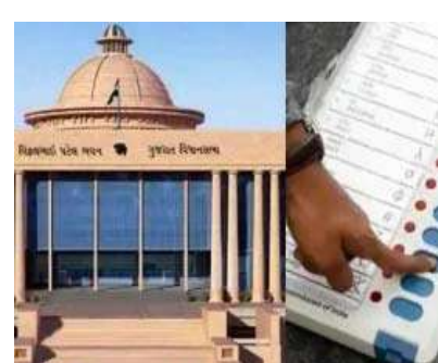
તેની સાથે જ મોનિટરિંગ પણ કરવામાં આવી રહ્યું છે. આ સાથે જ જે પ્રમાણે સમાચાર

ગાંધીનગર, લોકસભાની ચૂંટણી બાદ ગુજરાતના મંત્રીમંડળનું વિસ્તરણ થશે. ભૂપેન્દ્ર પટેલની સરકારમાં નવા ચહેરાઓને તક મળવાની શક્યતા છે. જેમાં વર્તમાન પ્રધાનો પૈકી કેટલાકને ડ્રોપ કરવામાં આવે તેવી પણ શક્યતા છે. હાલમાં ચૂંટણીની અંદર પણ જુદા જુદા મંત્રીઓને મહત્વની જવાબદારીઓ સોંપવામાં આવી છે. જેટલા પણ પ્રભારી મંત્રી છે, તે તમામને પ્રચાર, કેમ્પેઈનથી લઈને તમામ જવાબદારીઓ સોંપવામાં આવી