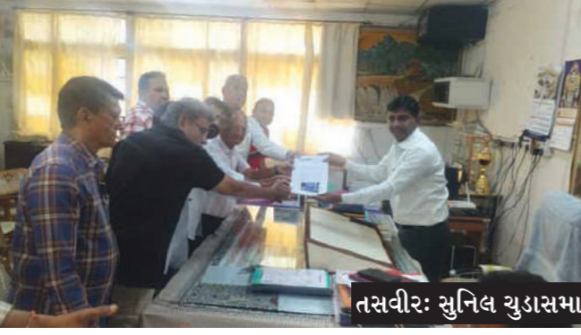
ગ્રાઉન્ડની દિવાલ ઉપર હાલ ચોકકસ નામ સાથેનું બોર્ડ એડમીશન ઓપન શરૂ કરવા મંજૂરી આપે નહીં તેથી આ અંગે તાત્કાલિક તપાસ કરાવવા

જામનગર : જામનગરમાં ઓશવાળ શિક્ષણ રાહત સંઘ દ્વારા સંચાલિત શાળાની કમ્પાઉન્ડ વોલ ઉપર એડમિશન ઓપનનું બોર્ડ લાગ્યા બાદ લોકોએ ઊંચ જાતિજનોની સહી સહિતનું આવેદન કલેક્ટર તથા જિલ્લા શિક્ષણાધિકારીને આપ્યું છે. ઓશવાળ સમાજના લોકો દ્વારા શિક્ષણ અને વહિવટી તંત્રને કલર ફોટોઝ સાથે અપાયેલા આવેદનમાં જણાવવાયું છે કે, જામનગરમાં ઈન્ડિયન માર્ગ પર આવેલી ઓશવાળ ઈંગ્લીશ એકેડમી ચાલી રહી છે. જેમાં કેમ્પીજ યુનિવર્સિટી, સીબીએસઈ તથા જીએસઈબી તેમજ જુદા જુદા ૩