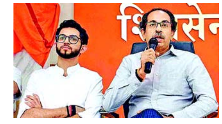
ઠાકરે પણ આ મેગા રેલીમાં ભાગ લેશે. કોંગ્રેસ પણ મહારાષ્ટ્રની તૈયારીઓ કરી રહી છે. મહારાષ્ટ્રની સફળતા માટે બે દિવસ પહેલાં કોંગ્રેસના નેતાઓની બેઠક યોજાઈ હતી. પાર્ટીના સંગઠન મહાસચિવ કેસી વેણુગોપાલે રેલીની તૈયારીઓને લઈને બેઠક યોજી હતી. જેમાં દિલ્હી પ્રદેશ કોંગ્રેસ સમિતિના પ્રમુખ અરવિંદર સિંહ લલવલી, હરિયાણા પ્રદેશ કોંગ્રેસ સમિતિના પ્રમુખ ઉદય ભાન અને દિલ્હી અને

ઉદ્ધવ ઠાકરે અને આદિત્ય ઠાકરે પણ હાજરી આપશે નવીદિલ્હી, દિલ્હીના મુખ્યમંત્રી અરવિંદ કેજરીવાલની ધરપકડ અને વિપક્ષી નેતાઓ સામે તપાસ એજન્સીઓના “દુરુપયોગ”ના વિરોધમાં વિરોધ પક્ષોનું ‘ભારત’ ગઠબંધન ૩૧ માર્ચે દિલ્હીમાં એક મેગા રેલીનું આયોજન કરશે. આમ આદમી પાર્ટી (આપ) મહારાષ્ટ્રની તૈયારીમાં વ્યસ્ત છે. પાર્ટીના નેતાઓ અને કાર્યકર્તાઓ જનતાનું સમર્થન મેળવવા માટે ઘરે-ઘરે જઈ રહ્યા છે. શિવસેના (યુધ્ધી)ના નેતાઓ ઉદ્ધવ ઠાકરે અને આદિત્ય