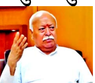
પડશે. મોહન ભાગવતે કહ્યું કે જો આપણા લોકો આવું જીવન જીવે તો આપણને આઝાદી મળી. ભારતને મજબૂત બનાવવું પડશે. વિશ્વ ગુરુ બનવા માટે. આપણે પણ આવી જ રીતે તપસ્યા કરવી પડશે. એ તપશ્ચર્યા

નાગપુર, આપણે આપણા દેશને મોટો બનાવવો છે, આપણે આપણા દેશની પીડા અને વેદનાને દૂર કરીને આગળ વધવાનો છે. આરએસએસના વડા ડો. મોહન ભાગવતે નાગપુરમાં એક કાર્યક્રમ દરમિયાન આ વાત કહી હતી. આરએસએસ ચીફ મોહન ભાગવતે કહ્યું કે વિશ્વને મોટો બનાવવા માટે પોતાના દેશની જરૂર છે. વિશ્વને સાચો રસ્તો બતાવવાનું કામ ભારતે કરવાનું છે. આ માટે ભારતે તમામ મતભેદો છોડીને એક થવું પડશે. સ્વાર્થ છોડી દેશ માટે જીવવા અને મરવાના સંકલ્પ સાથે પોતાનું જીવન જીવવું