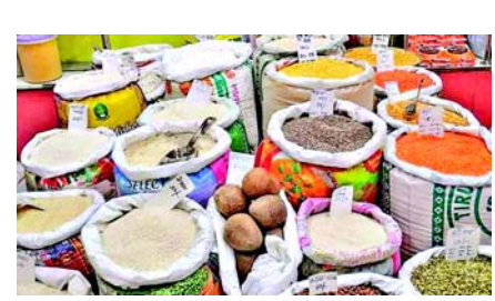
માત્ર મસૂર દાળ સસ્તી થઈ છે. તે પણ માત્ર ૧.૦૩ ટકા. આ સમયગાળા દરમિયાન લોટ માત્ર ૪.૫૭ ટકા મોંઘી થયો છે. ખાદ્યતેલોની વાત કરીએ તો તેમના ભાવ આ વર્ષે સૌથી નીચા સ્તરે રહ્યા છે. સરસવના તેલના ભાવમાં એક વર્ષમાં લગભગ ૧૩ ટકાનો ઘટાડો થયો છે. વનસ્પતિ તેલમાં લગભગ ૭ ટકાનો ઘટાડો થયો છે. સોયા તેલ લગભગ ૧૩ ટકા અને સુર્યમુખી તેલ ૧૯ ટકા સસ્તું થયું છે. પામ તેલ પણ ૮ ટકા સસ્તું થયું છે. જો આપણે આવશ્યક ચીજવસ્તુઓમાં સમાવિષ્ટ બટાકા, ડુંગળી અને ટામેટાંની વાત કરીએ તો છેલ્લા એક વર્ષમાં બટાકાની કિંમત ૨૬ ટકાથી વધુ વધીને સરેરાશ ૨૩.૮૩ રૂપિયા પ્રતિ કિલો થઈ ગઈ છે. એક વર્ષ પહેલા ડુંગળી રૂ. ૨૩.૩૦ હતી અને હવે રૂ. ૩૨.૩૯ પર પહોંચી ગઈ છે. ૩૦ ટકાનો વધારો થયો છે. એક વર્ષમાં મેન્ટેમટર ૩૬% વધીને ૩૩ રૂપિયાની આસપાસ પહોંચી ગયો છે. કન્ઝ્યુમર મિનિસ્ટ્રીની વેબસાઈટ પર આપવામાં આવેલા ડેટા મુજબ મીઠાના દરમાં ૫ ટકાથી વધુનો વધારો થયો છે. ગુરુમૂળ પણ સાડા સાત ટકાનો વધારો થયો છે. ખાંડના ભાવમાં ૬ ટકાથી વધુનો વધારો થયો છે.

નવીદિલ્હી, છેલ્લા એક વર્ષમાં લોટ, ચોખા અને દાળના ભાવ ક્યાં થી ક્યાં પહોંચી ગયા છે અનાજમાં તુવેર દાળના ભાવમાં સૌથી વધુ વધારો થયો છે. આ પછી ચોખા આવે છે. આશ્ચર્ય વાત એ છે કે સરસવ, સોયાબીન, સુર્યમુખી અને પામ ઓઈલથી લોકોને રાહત મળી છે, ત્યારે બટેટા, ડુંગળી અને ટામેટાના ભાવમાં ઘણો વધારો થયો છે. ઉપભોક્તા મંત્રાલયની વેબસાઈટ અનુસાર, છેલ્લા એક વર્ષમાં તુવેર દાળની સરેરાશ છૂટક કિંમત ૧૧૪.૪૯ રૂપિયાથી વધીને ૧૪૮.૫૦ રૂપિયા પ્રતિ કિલો થઈ ગઈ છે. આ સમયગાળા દરમિયાન લગભગ ૩૦ ટકાનો વધારો થયો છે. આ સિવાય અડદની દાળ ૧૪.૩૪ ટકા અને મગની દાળ ૧૦.૫૨ ટકા મોંઘી થઈ છે. જોકે,