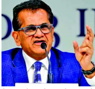
ગોવર્ધન છે. કાંતે કહ્યું કે ભારતને વિકાસના ચેમ્પિયન બનવા માટે ઓછામાં ઓછા ૧૨ રાજ્યોની જરૂર છે અને તેઓએ ૧૦ ટકાથી વધુના

નવીદિલ્હી, ભારતના G-20 શેરપા અમિતાભ કાંતે કહ્યું કે ભારતને $35 ટ્રિલિયનની અર્થવ્યવસ્થા બનવા માટે ૯-૧૦ ટકા વૃદ્ધિ દરની જરૂર પડશે અને આ લક્ષ્ય હાંસલ કરી શકાય છે. India G20 શેરપા અમિતાભ કાંતે ભારતના G-20 શેરપા અમિતાભ કાંતે ગુરુવારે જણાવ્યું હતું કે ભારતે ૨૦૪૭ સુધીમાં $35 ટ્રિલિયન અર્થતંત્ર બનાવવા માટે આગામી ત્રણ દાયકામાં ૯-૧૦ ટકાનો વિકાસ દર હાંસલ