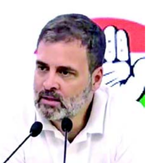
કે ૨૮ માર્ચે દિલ્હી હાઈકોર્ટે ટેક્સ એસેસમેન્ટને લઈને કોંગ્રેસ દ્વારા દાખલ કરવામાં આવેલી અરજીને ફગાવી દીધી હતી. હવે આ સમગ્ર મામલે રાહુલ ગાંધીએ કેન્દ્ર પર

લોકસભા ચૂંટણી ૨૦૨૪ પહેલા કોંગ્રેસ પાર્ટીને વધુ એક મોટો ઝટકો લાગ્યો છે. ખાતું ફીઝ કર્યા બાદ આવકવેરા વિભાગે શુક્રવારે કોંગ્રેસને ૧૮૨૨ કરોડ રૂપિયાની નવી ડિમાન્ડ નોટિસ જારી કરી હતી. આ ડિમાન્ડ નોટિસ ૨૦૧૭-૧૮ થી ૨૦૨૦-૨૧ માટે છે. જેમાં યાજની સાથે ઈન્ડોનો પણ સમાવેશ થાય છે. નવી નોટિસને લોકસભાની ચૂંટણી પહેલા રોકડની તંગીનો સામનો કરી રહેલી કોંગ્રેસ માટે એક ઝટકો માનવામાં આવી રહી છે. એક દિવસ પહેલા એટલે