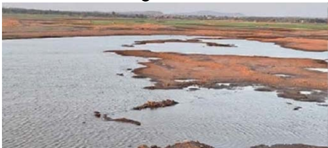
મુકો ચૂંટણીમાં પણ જોવા મળી રહ્યો છે. આ હાલત માત્ર સૌરાષ્ટ્રની જ નથી, આખા ગુજરાતની છે. ઉનાળા પહેલાં રાજ્યમાં જળાશયોમાં પાણી ખૂટ્યું છે. સૌરાષ્ટ્રના ૧૪૧ જળાશયોમાં માત્ર ૩૦.૩૮ ટકા પાણીનો જથ્થો બચ્યો છે કચ્છના ૨૦

ગાંધીનગર ઉનાળા પહેલા ગુજરાત માટે આવ્યા ચિંતાના વાદળો મંડરાયા છે. આખા ગુજરાતના પાણી પુરું પાડતા ડેમ તળિયા અટક થયા છે. હવે ઉનાળો કેમનું કાઢશો તે સુરહેલી છે. ઉનાળાની વધતી ગરમીએ લોકોની મુશ્કેલી વધારી છે. ગરમી વધતાં જળાશયોના સ્તરમાં ધરખમ ઘટાડો થયો છે. ગુજરાતના ૪૮ જળાશયોમાં હવે ૧૦ ટકાથી ઓછું પાણી બચ્યું છે. ૨૦૭ જળાશયોમાં સરેરાશ જળસ્તર ૫૪ ટકા બચ્યું છે. સૌરાષ્ટ્રના અનેક જળાશયો તળિયાઝાટક થયા છે. ત્યારે ગુજરાતમાં ઠેર ઠેર પાણીની તંગીનો