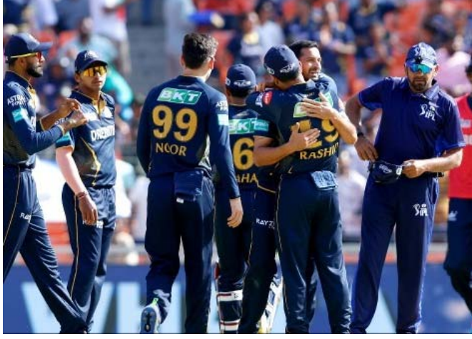
અમદાવાદમાં રવિવારે સનરાઈઝર્સ હૈદરાબાદને ૭ વિકેટે હરાવ્યું હતું.

ઈન્ડિયન પ્રીમિયર લીગ-૨૦૨૪માં બીજી જીત હાંસલ કરી