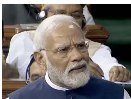
માતાનો ભાગ ન હતો? ઈન્દિરા ગાંધીની આગેવાની હેઠળની સરકારે પછ તેને ભારતથી અલગ કરવાનું કામ કર્યું.

૧૯૭૪માં ઈન્દિરા ગાંધીની સરકારે આ ટાપુ શ્રીલંકાને બેટમાં આપ્યો હતો. ૧૯૭૪માં બંને દેશો વચ્ચે બે બેઠક થઈ હતી. પહેલી બેઠક ૨૬ જૂને કોલંબોમાં અને બીજી ૨૮ જૂને દિલ્હીમાં થઈ હતી. બંને બેઠકોમાં શ્રીલંકાને ટાપુ આપવા પર સહમતી થઈ હતી. રિપોર્ટમાં કહેવામાં આવ્યું છે કે કરારમાં કેટલીક શરતો રાખવામાં આવી હતી જેમ કે - ભારતીય માછીમારો તેમની જાળ સૂકવવા માટે આ ટાપુ પર જઈ શકશે. ટાપુ પર બનેલા ચર્ચમાં ભારતીયોને વિઝા ફી એન્ડ્રી મળશે. ૧૦ ઓગસ્ટ, ૨૦૨૩ના રોજ પીએમ મોદીએ ગુલમાં અવિશ્વાસ પ્રસ્તાવ પર કચ્છથીવુને લઈને નિવેદન પણ આપ્યું હતું. તેમણે કહ્યું કે આ વિષયના લોકો જે સંસદની બહાર ગયા છે, થોડું એમનો પૂછો. આ કચ્છથીવુ ક્યાં છે અને શું છે? ડીએમકેના આ લોકો અને તેમની સરકાર મને પત્ર લખીને મોદીજીને કચ્છથીવુ પરત લાવવા કહે છે. તમિલનાડુથી આગળ અને શ્રીલંકા પાછળનો ટાપુ કોણે અને બીજાને કેમ સોંપ્યો? શું આ વિસ્તાર ભારત