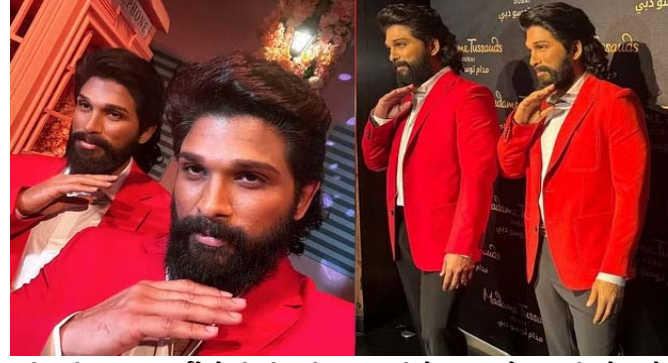
અલ્લુ અર્જુને 'પુષ્પા ૨: ધ રૂલ' માટે સમાચારમાં રહે છે. તે જ સમયે, તેણે ફિલ્મ 'પુષ્પા: ધ રાઈઝિંગ'ના પહેલા ભાગ માટે વૈશ્વિક ઓળખ મેળવી હતી. 'પુષ્પા' સ્ટારને મીણના પૂતળાથી સન્માનિત કરવામાં આવેલ નવીનતમ છે. આવી સ્થિતિમાં, તેણે 'પુષ્પા' સાથે 'પુષ્પા'ના આઈકોનિક પોઝનું પુનરાવર્તન કર્યું અને 'પુષ્પા' શૈલીમાં ફોટોગ્રાફ્સ મેળવ્યા.

મુંબઈ, સાઉથના સુપરસ્ટાર અલ્લુ અર્જુને સફળતાની વધુ એક સીડી ચઢી છે. અલ્લુ અર્જુને એક નવો 'માઈલસ્ટોન' હાંસલ કર્યો છે. અભિનેતાએ આખરે મેડમ તુસાદ દુબઈ ખાતે તેની મીણની પ્રતિમાનું અનાવરણ કર્યું. ૨૮ માર્ચ, ગુરુવારે સાંજે પ્રતિમાનું અનાવરણ કરવામાં આવ્યું હતું, જે અભિનેતાએ ખૂબ જ ઉત્સાહ સાથે ચાહકો સાથે શેર કર્યું હતું, અને તેની ખુશી વ્યક્ત કરી હતી. અલ્લુ અર્જુને તેની મીણની પ્રતિમા સાથેની પોતાની કેટલીક તસવીરો પણ શેર કરી છે, જે ઈન્સ્ટાગ્રામ પર વાયરલ થઈ રહી છે.