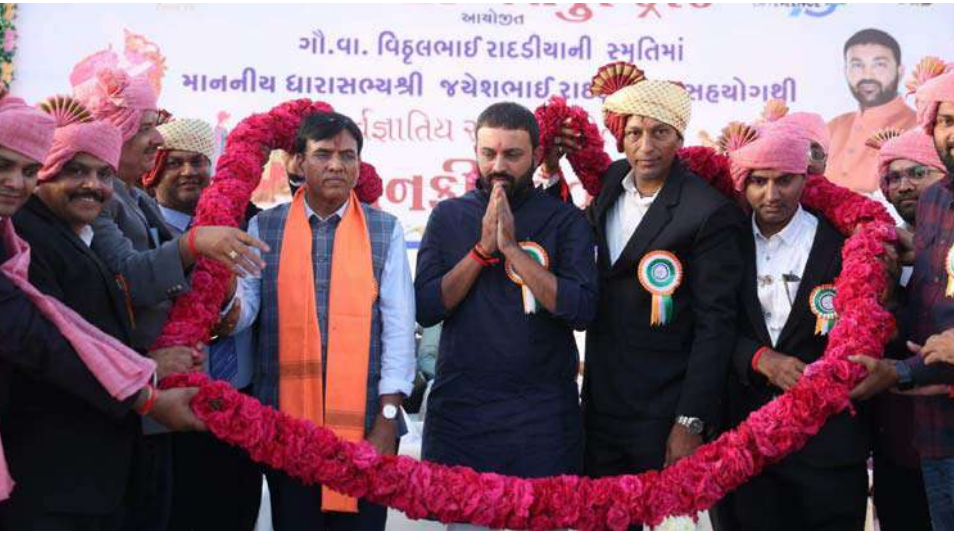
જેતપુર શહેર ખાતે જેસીઆઈ જેટપુર ટ્રસ્ટ આયોજિત વિઠલભાઈ રાદડીયાની પુણ્ય સ્મૃતીમા સર્વજ્ઞાતીય સમુહલગ્નોત્સવ "જાનકી વિવાહ" પ્રસંગે પોરબંદર લોકસભાના ભારતીય જનતા પાર્ટીના ઉમેદવાર શ્રી મનસુખ માંડવીયા પધારતા તેમનું સ્વાગત સન્માન કરીને દાતાશ્રીઓનું સન્માન તેમજ ૭૦ દીકરીઓને કન્યાદાન કરવાનો પવિત્ર અવસર પ્રાપ્ત થયો.