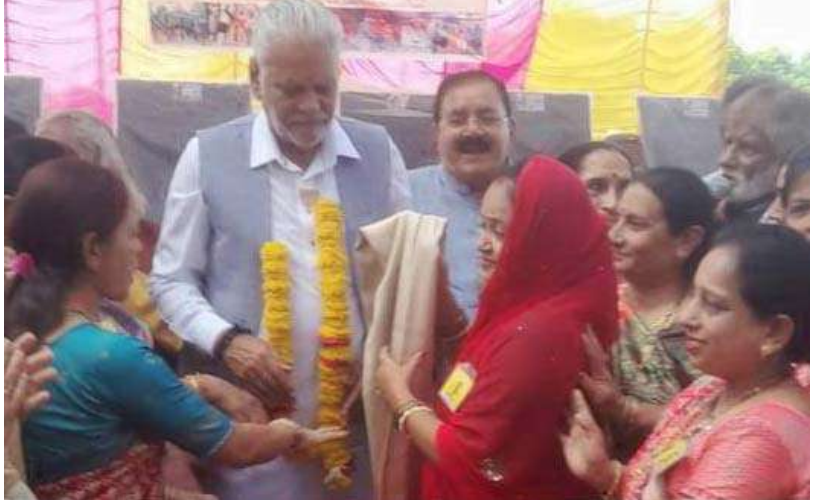
વગર સામાજિક પ્રસંગ પાર પાડવામાં સમુહલગ્નના આયોજનો મહત્વનું માધ્યમ બન્યા છે. દિકરીઓને કન્યાદાનમાં વિવિધ ચીજ-વસ્તુઓ અર્પણ કરી દાતાઓ પુણ્યનું

રાજકોટ શહેરના રૈયા ગામથી આગળ જતા કેન્દ્ર સરકારની લાઈટ હાઉસ આવાસ યોજનાની વસાહતના પટોંગણ ખાતે ઓમ શ્રી આશાપુરી પ્રગતિ ચેરીટેબલ ટ્રસ્ટ રાજકોટ આયોજિત ૧૪માં સર્વજ્ઞાતિય સમુહલગ્ન સમારોહમાં કેન્દ્રીય મંત્રી અને રાજકોટ લોકસભા ચૂંટણીના ભાજપના ઉમેદવાર પરશોતમભાઈ રૂપાલાએ પ્રેરક હાજરી આપી પ્રભુતામાં પગલા પાડવા જઈ રહેલ ૮ નવદંપતિઓને આશિર્વાદ પાઠવી શુભેચ્છા પાઠવેલ હતી. આ તકે પરશોતમભાઈ રૂપાલાએ જણાવેલ સમાજમાં સમાયતરે વિવિધ સામાજિક સંસ્થાઓ, ટ્રસ્ટો, મિત્ર મંડળ ધ્વારા સમુહ લગ્નના આયોજનો થાય છે ત્યારે મધ્યમ વર્ગના લોકોને કોઈપણ આર્થિક મુશ્કેલી