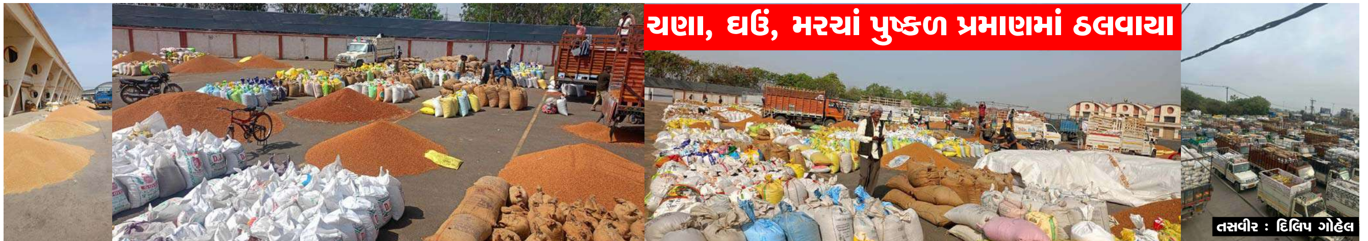
ચાણા, ઘઉં, મરચાં પુષ્કળ પ્રમાણમાં ઠલવાયા