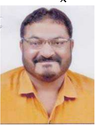
મેનેજિંગ કમિટિમાં સૌરાષ્ટ્ર-કચ્છનાં વેપાર ઉદ્યોગને ફાયદો

રાજકોટ ચેમ્બર ઓફ કોમર્સ એન્ડ ઇન્ડસ્ટ્રી વેપાર-ઉદ્યોગનું પ્રતિનિધિત્વ કરતી ૬૯ વર્ષ જૂની વરિષ્ઠ મહાજન સંસ્થા છે. રાજકોટ ચેમ્બર દ્વારા હર હંમેશ વેપાર-ઉદ્યોગના તેમજ આમ પ્રજાના પ્રશ્નોનું યોગ્ય અને સચોટ નિરાકરણ લાવવા માટે અગ્રેસર રહે છે. તેમજ કેન્દ્ર તથા રાજ્ય સરકારમાં એક સેતુ બની રજુઆતો કરી ઉદ્ભવતા પ્રશ્નોનું યોગ્ય નિરાકરણ લાવવા પ્રયાસ કરે છે.