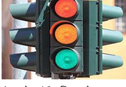
ઉભા રહેવામાંથી મુક્તિ મળશે. અમદાવાદ શહેરમાં અંદાજે ૬ કરોડના ખર્ચે ૧૦૦ સિગ્નલ પર આ સિસ્ટમ લગાવાશે. જેની મદદથી લોકોને ટ્રાફિકની સમસ્યાથી રાહત મળશે. આ સિસ્ટમ

ટ્રાફિક સિગ્નલ પર વધારે ઊભું નહીં રહેવું પડે અમદાવાદ, અમદાવાદીઓને ખુશી મળે તેવા સમાચાર સામે આવ્યા છે. વાત એવી છે કે, ટ્રાફિક સિગ્નલ પર થતો તમારો ટાઈમ વેસ્ટ હવે ઓછો થશે. કારણ કે અમદાવાદ મ્યુનિસિપલ કોર્પોરેશન એક એવી સિસ્ટમ લાવી રહ્યું છે કે જેનાથી લોકોનો સમય અને સાથે જ પેટ્રોલ પણ બચશે. કોર્પોરેશન ઈન્ટેલિજન્ટ ટ્રાફિક મેનેજમેન્ટ સિસ્ટમ લાવી રહ્યું છે. જે સિસ્ટમની મદદથી લોકોને ટ્રાફિક સિગ્નલ પર વધુ સમય અમદાવાદ, અમદાવાદીઓને ખુશી મળે તેવા સમાચાર સામે આવ્યા છે. વાત એવી છે કે, ટ્રાફિક સિગ્નલ પર થતો તમારો ટાઈમ વેસ્ટ હવે ઓછો થશે. કારણ કે અમદાવાદ મ્યુનિસિપલ કોર્પોરેશન એક એવી સિસ્ટમ લાવી રહ્યું છે કે જેનાથી લોકોનો સમય અને સાથે જ પેટ્રોલ પણ બચશે. કોર્પોરેશન ઈન્ટેલિજન્ટ ટ્રાફિક મેનેજમેન્ટ સિસ્ટમ લાવી રહ્યું છે. જે સિસ્ટમની મદદથી લોકોને ટ્રાફિક સિગ્નલ પર વધુ સમય