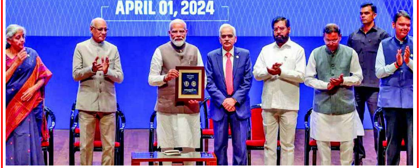
વડાપ્રધાને ૯૦ રૂપિયાનો સિક્કો પ્રથમ વખત જાહેર કર્યો છે. આ સિક્કાની ખાસિયત એ છે કે તેને શુદ્ધ ચાંદીથી બનાવવામાં આવ્યો છે. ત્યારે તે સિવાય તેમાં ૪૦ ગ્રામ ચાંદીનો ઉપયોગ કરવામાં આવ્યો છે. ૯૦ રૂપિયાના ચાંદીના સિક્કાની એકબાજુ બેન્કનો લોગો છે અને બીજી તરફ મુલ્યવર્ગ ૯૦ રૂપિયા લખ્યું છે.