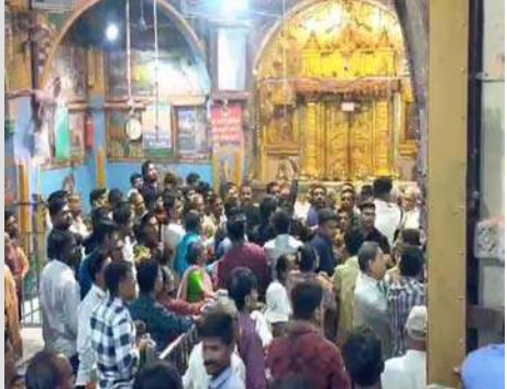
ડાકોર મંદિરમાં આજે સવારે મંગળા આરતી સમયે મંદિરમાં

ડાકોર, સુપ્રસિદ્ધ યાત્રાધામ ડાકોર રણછોડજી મંદિરમાં શરમજનક ઘટના બની હતી. સોમવારે વહેલી સવારની મંગળા આરતીમાં જ શ્રદ્ધાળુ ભક્તો બાખડી પડ્યા હતા. વહેલી સવારે મંગળા આરતી દર્શન સમયે ભક્તો દ્વારા મંદિરના ઘુમ્મટમાં જ ભક્તોએ મારામારી કરી હતી. દર્શન કરવાની જગ્યા બાબતમાં રોષે ભરાયેલા ભક્તો એકબીજા પર તૂટી પડ્યા હતા. ત્યારે મારામારીના દ્રશ્યો કેમેરામાં કેદ થયા છે. ખેડા જિલ્લાના સુપ્રસિદ્ધ યાત્રાધામ ડાકોરમાં આજે વહેલી સવારે મંગળાઆરતી સમયે છુટ્ટાહાથની મારામારી થઈ હતી. મંદિરના ઘુમ્મટમાં જ ભક્તો બાખડતા મામલો પોલીસ મથક સુધી લંબાયો છે. ડાકોર મંદિરમાં આજે સવારે મંગળા આરતી સમયે મંદિરમાં