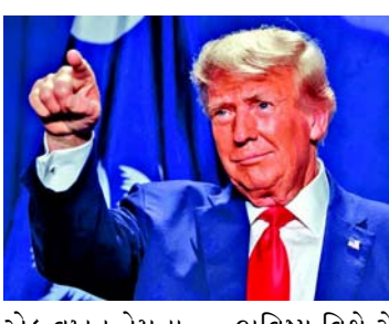
બિવિષ્ય વિશે ચેતવણી આપતા ભાષણમાં ટ્રમ્પે કહ્યું, હું આજે તમારી સમક્ષ જાહેર કરવા આવ્યો છું કે બિડેન સરહદ નરસંહાર... આ એક રક્તસ્રાવ છે, આ તે છે જે આપણા દેશને નષ્ટ કરી રહ્યું છે.

વોશિંગ્ટન, અમેરિકામાં જેમ જેમ અમેરિકા રાષ્ટ્રપતિની ચૂંટણી નજીક આવી રહી છે તેમ તેમ રાજકીય પક્ષોના દાવા અને વચનો પણ તેજ થઈ ગયા છે. વાત જાણે એમ છે કે, અમેરિકામાં રાષ્ટ્રપતિની ચૂંટણી માટે પ્રચાર ચાલુ છે. આ દરમિયાન પૂર્વ રાષ્ટ્રપતિ ડોનાલ્ડ ટ્રમ્પે તાજેતરમાં કહ્યું હતું કે જો તેઓ નવેમ્બરમાં યોજાનારી ચૂંટણી નહીં જીતે તો અમેરિકામાં રક્તપાત થશે. મંગળવારે ટ્રમ્પે બમણી ઝડપે ફરી એક વખત તેમના આ જ નિવેદનનું પુનરાવર્તન કર્યું. તેમણે તેમના સમર્થકો સાથે ગેરકાયદેસર ઈમિગ્રન્ટ્સ દ્વારા લૂંટ, બળાટકાર અને હત્યાકાંડનો સામનો કરી રહેલા