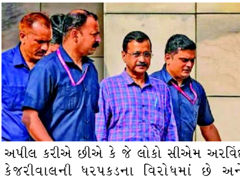
અપીલ કરીએ છીએ કે જે લોકો સીએમ અરવિંદ કેજરીવાલની ધરપકડના વિરોધમાં છે અને લોકશાહીને બચાવવા અને આ દેશને પ્રેમ કરવા માટે છે તેઓ પણ તેમના ધર, ગામ, બ્લોકમાં સામૂહિક ઉપવાસ કરી શકે છે. ગોપાલ રાયે કહ્યું, 'આપ નેતાઓની નકલી આરોપોના આધારે એક પછી એક ધરપકડ કરવામાં આવી.

નવીદિલ્હી, મુખ્યમંત્રી અરવિંદ કેજરીવાલ હાલ તિહાર જેલમાં બંધ છે. કોર્ટે તેને ૧૫ દિવસની ન્યાયિક કસ્ટીમાં તિહાર જેલમાં મોકલી દીધો છે. મુખ્ય પ્રધાન અરવિંદ કેજરીવાલની ૨૧ માર્ચે ઈડી દ્વારા કથિત દારૂ કૌભાંડ સંબંધિત મની લોન્ડરિંગ કેસમાં ધરપકડ કરવામાં આવી હતી. કેજરીવાલની ધરપકડના વિરોધમાં આમ આદમી પાર્ટીએ સામૂહિક ઉપવાસની જાહેરાત કરી છે. દિલ્હી સરકારના મંત્રી અને આપ નેતા ગોપાલ રાયે કહ્યું, "૭ એપ્રિલે દેશભરમાં સામૂહિક ઉપવાસ થશે. મુખ્યમંત્રી અરવિંદ કેજરીવાલની ધરપકડના વિરોધમાં આપના તમામ મંત્રીઓ, ધારાસભ્યો, સાંસદો અને પાર્ટીના નેતાઓ ૭ એપ્રિલે જંતર-મંતર ખાતે 'સામૂહિક ઉપવાસ' કરશે. અમે લોકોને પણ