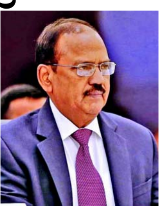
ક્યાંય પણ અને કોઈપણ હેતુ માટે, વાજબી નથી.

અને એસસીઓ દેશો વચ્ચેના સંબંધો સદીઓ જૂના છે અને તેઓ તેને વધુ ગાઢ બનાવવા માટે પ્રતિબદ્ધ છે. તેમણે એમ પણ કહ્યું કે એસસીઓ સભ્ય દેશોની સંપ્રભુતા અને પ્રાદેશિક અખંડિતતાનું સંપૂર્ણ સન્માન કરવું જોઈએ. અજીત ડોભાલે ૨૨ માર્ચે મોસ્કોમાં થયેલા આતંકવાદી હુમલાની સખત નિંદા કરી હતી અને પીડિતોના પરિવારો પ્રત્યે સંવેદના વ્યક્ત કરી હતી. તેમણે તેમના રશિયન સમકક્ષને કહ્યું કે ભારત તેના તમામ સ્વરૂપોમાં આતંકવાદના જોખમનો સામનો કરવા માટે રશિયન સરકાર અને લોકો સાથે એકજૂટ છે. એનએસ ડોભાલે કહ્યું છે કે સરહદ પારના આતંકવાદ સહિત આતંકવાદનું કોઈપણ કૃત્ય, કોઈપણ દ્વારા,