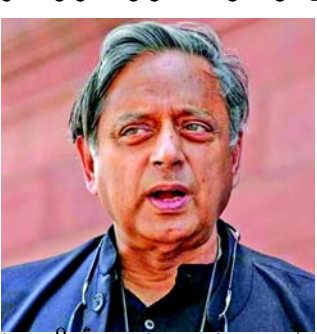
ભારતની વિવિધતા, બહુલતાવાદ અને સર્વસમાવેશક વિકાસને જાળવવા માટે અમુલ્ય છે," એમ તેમણે લખ્યું હતું. "મિસ્ટર મોદીનો વિકલ્પ એ અનુભવી, સક્ષમ અને વૈવિધ્યસભર ભારતીય નેતાઓનું જૂથ છે જે લોકોની સમસ્યાઓ માટે પ્રતિભાવ આપશે અને વ્યક્તિગત અહંકારથી પ્રેરિત નહીં હોય," એમ કોંગ્રેસ નેતાએ ઉમેર્યું હતું. તેઓ કહી ચોક્કસ વ્યક્તિને વડાપ્રધાન તરીકે પસંદ કરશે તે ગોપ્ય વિચારણા છે. આપણી લોકશાહી અને વિવિધતાનું રક્ષણ કરવું સૌથી પહેલા આવે છે," એમ થરૂરે જણાવ્યું હતું.

નવીદિલ્હી, કોંગ્રેસના નેતા શશિ થરૂરે કહ્યું છે કે વડાપ્રધાન નરેન્દ્ર મોદીનો વિકલ્પ કોણ હોઈ શકે તે પ્રશ્ન સંસદીય પ્રણાલીમાં "અપ્રસ્તુત" છે કારણ કે આપણે કોઈ વ્યક્તિને પસંદ નથી કરતા, પરંતુ પક્ષ અથવા પક્ષોના ગઠબંધનને પસંદ કરીએ છીએ. આજે સવારે એકસને લેતાં, થરૂરે કહ્યું કે એક પત્રકારે તેમને આ પ્રશ્ન પૂછ્યો હતો. "તેમ છતાં ફરી એક પત્રકારે મને એવા વ્યક્તિની ઓળખ કરવા કહ્યું છે કે જે મોદીનો વિકલ્પ છે. સંસદીય