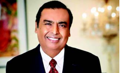
ક્રીએ તે આ શેર ૩.૦૨૪.૯૦ હતો, પર વીક લો ની વાત કરીએ તે શેર ૨,૦૮૫.૮૫ એ લો

(જી.એન.એસ)નવીદિલ્હી, તા.૦૩ મુકેશ અંબાણી એશિયાના સૌથી ધનિક વ્યક્તિ તો છે જ પણ ફોર્બ્સ દ્વારા જાહેર કરાયેલ ૨૦૨૪ના અબજોપતિઓની યાદીમાં ૮ નંબરના સૌથી ધનિક વ્યક્તિ બન્યા છે, આ સમાચારથી તેમની કંપનીના શેર પર શું અસર થઈ તે વિષે પણ તમને જણાવીશું, જેમાં આ સમાચાર લખાઈ રહ્યા છે ત્યારે રિલાયન્સ ઈન્ડસ્ટ્રીયલ લિમીટેડનો શેર ૦.૬૦ ટકાના ઘટાડા સાથે ૧૭.૮૦ રૂપિયા માર્કનસ સાથે ૨.૯૫૬ સાથેને ટ્રેડ કરી રહ્યો છે, પર વીક હાર્ઠની વાત