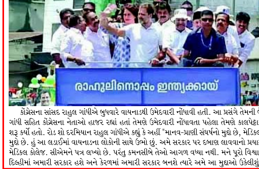
કોંગ્રેસના સાંસદ રાહુલ ગાંધીએ ભુધવારે વાયનાડથી ઉમેદવારી નોંધાવી હતી. આ પ્રસંગે તેમની બેન પ્રિયંકા ગાંધી સહિત કોંગ્રેસના નેતાઓ હાજર રહ્યાં હતાં તેમણે ઉમેદવારી નોંધાવતા પહેલા તેમણે કાલપેદાથી રોડ શો શરૂ કર્યો હતો. રોડ શો દરમિયાન રાહુલ ગાંધીએ કહ્યું કે અહીં 'માનવ-પ્રાણી સંઘર્ષનો મુદ્દો છે, મેડિકલ ક્લેવેજનો મુદ્દો છે. હું આ લડાઈમાં વાયનાડના લોકોની સાથે ઉભો છું. અમે સરકાર પર દબાણ લાવવાનો પ્રયાસ કર્યો છે. મેડિકલ ક્લેવેજ. સીએમને પત્ર લખ્યો છે. પરંતુ કમનસીબે તેઓ આગળ વધ્યા નથી. મને પૂરો વિશ્વાસ છે કે જો દિલ્હીમાં અમારી સરકાર હશે અને કેરળમાં અમારી સરકાર બનશે ત્યારે અમે આ મુદ્દાઓ ઉકેલીશું.