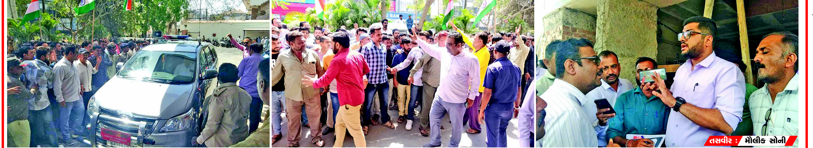
તસવીર : મોલીક સોની