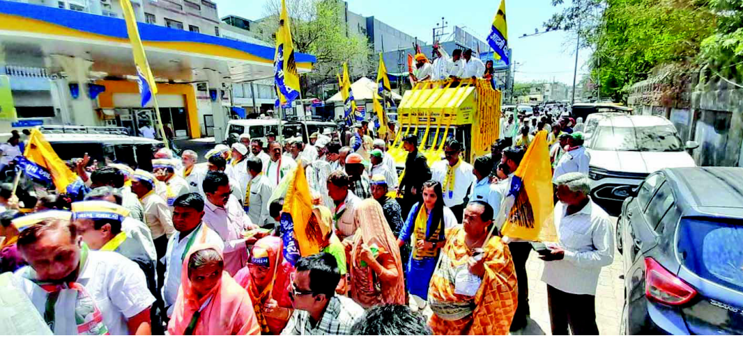
તસવીર : મોલીક સોની