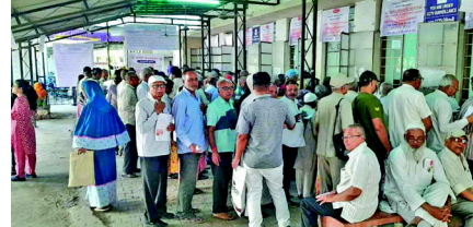
રવિવાર સહિતના તમામ દિવસો વેરો સ્વિકારાશે. હાલમાં ધરવેરાની કાર્પેટ ઓરિયા કરપદ્ધતિમાં નાણાકીય વર્ષ ૨૦૨૪-૨૫ની રિબેટ યોજના ચાલુ થઈ છે, જેમાં તમામ વેરો એકી સાથે ભરપાઈ કર્યેથી ઓપ્રિલ માસમાં ચાલુ વર્ષના મિલકત વેરો તથા સફાઈ વેરોની રકમ પર ૧૦ ટકા રિબેટ તથા મે માસમાં ચાલુ વર્ષના મિલકત વેરો તથા સફાઈ વેરોની રકમ પર ૫ ટકા સુધીનું રિબેટ તથા પી.ઓ.એસ., મહાનગરપાલિકાની વેબસાઈટ ઉપલબ્ધ બન્યું હતું. બીએમસીયુજરાત.કોમ પર ઓનલાઈન તેમજ એન્ડ્રોઈડ મોબાઈલ એપ્લિકેશન મારફત પેમેન્ટ કરવા પર વધુ ૨ ટકા રિબેટ મળવાપાત્ર છે.

ભાવનગર, તા.૪ મહાનગરપાલિકામાં ગત મંગળવારથી મિલકત વેરોમાં રીબેટ યોજના અમલી બની છે ત્યારે રિબેટનો લાભ લેવા કરદાતાઓનો ધસારો જોવા મળી રહ્યો છે અને બે દિવસના મ્યુ. તિજોરીમાં રૂ. ૪.૮૬ કરોડ જમાં થયા છે. પ્રથમ દિવસે ૧,૯૧૦ કરદાતાએ વેરો મિલકત વેરો ભર્યા હતા અને મનપાને રૂ. ૯૧,૩૨ લાખની વેરોની આવક થઈ હતી. બુધવારે બીજા દિવસે ૩૯૭૦ કરદાતાએ ઓનલાઈન-ઓફલાઈન વેરો ભર્યા હતા તેથી મહાપાલિકાને રૂ. ૩.૦૭ કરોડની વેરોની આવક થઈ હતી. બે દિવસમાં કુલ રૂ. ૪.૮૬ કરોડની મિલકત વેરોની મહાપાલિકાને આવક થઈ છે. મહાનગરપાલિકાની મુખ્ય કચેરી તથા બંને ઝોનલ કચેરીઓ (પૂર્વ તથા પશ્ચિમ) ખાતે મિલકત વેરો સવારે ૧૦.૩૦ થી બપોરે ૨.૩૦ અને બપોરે ૩ થી ૫ દરમિયાન સ્વીકારવા નિર્ધારિત કરાયેલ છે. જાહેર રજાઓ તથા શનિ-