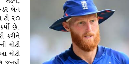
વર્લ્ડ કપ પહેલા પસંદગી માટે વિચારણા કરવા ઈચ્છતો નથી. હશે.' નિવેદનમાં વધુમાં કહેવામાં આવ્યું છે કે, 'ઈંગ્લેન્ડના ટેસ્ટ કેપ્ટનનું ધ્યાન માત્ર ટેસ્ટ ક્રિકેટ માટે જ નહીં, પરંતુ ભવિષ્યમાં તમામ ક્રિકેટ માટે બોલિંગ કરવા માટે સંપૂર્ણ રીતે ફિટ રહેવા પર છે. ઈંગ્લેન્ડની ટીમ વેસ્ટ ઈન્ડિઝ અને શ્રીલંકા સામે બે-ત્રણ મેચની ટેસ્ટ શ્રેણી રમશે.

લંડન, ઈંગ્લેન્ડ ક્રિકેટ ટીમના ઓલરાઉન્ડર બેન સ્ટોકસે આ વર્ષે જૂનમાં શરૂ થઈ રહેલા ટી ૨૦ વર્લ્ડ કપમાંથી ખસી જવાનો નિર્ણય કર્યો છે. ઈંગ્લેન્ડ ક્રિકેટ બોર્ડે એક નિવેદન જારી કરીને આ વાતની પુષ્ટિ કરી છે. આઈસીસીની મોટી ટૂનમિન્ટ પહેલા ઈંગ્લેન્ડની ટીમ માટે આ મોટો ઝટકો છે. આઈસીસી ટી ૨૦ વર્લ્ડ કપ ૧ જૂનથી અમેરિકા અને વેસ્ટ ઈન્ડિઝની યજમાનીમાં શરૂ થવા જઈ રહ્યો છે. તેની અંતિમ મેચ ૨૯ જૂને બાબાડોસમાં રમાશે. ઈંગ્લેન્ડ ક્રિકેટ બોર્ડે એક નિવેદન જારી કરીને કહ્યું કે, 'ઈંગ્લેન્ડના ક્રિકેટર બેન સ્ટોકસે આજે પુષ્ટિ કરી છે કે તે જૂનમાં વેસ્ટ ઈન્ડિઝ અને યુએસએમાં યોજાનાર આઈસીસી મેન્સ ટી ૨૦