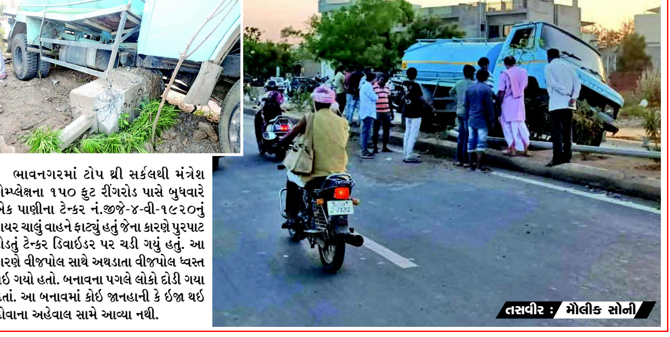
ભાવનગરમાં ટોપ ધ્રી સર્કલથી મંત્રેશ કોમ્પ્લેક્સના ૧૫૦ ફુટ રીંગરોડ પાસે બુધવારે એક પાણીના ટેન્કર નં.જીજી-૪-વી-૧૯૨૦નું ટાયર ચાલું વાહને ફાટ્યું હતું જેના કારણે પુરપાટ દોડતું ટેન્કર ડિવાઈડર પર ચડી ગયું હતું. આ કારણે વીજપોલ સાથે અથડાતા વીજપોલ ધ્વસ્ત થઈ ગયો હતો. બનાવના પગલે લોકો દોડી ગયા હતાં. આ બનાવમાં કોઈ જાનહાની કે ઈજા થઈ હોવાના અહેવાલ સામે આપ્યા નથી.