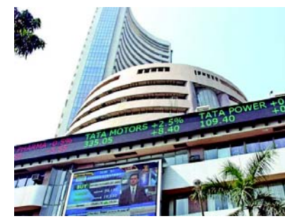
સુધારાનો નવો દોર શરૂ થવા સાથે માનસ તેજનું બની રહ્યું હતું અને મોટા ભાગના શેરો સતત ઉછળતા રહ્યા હતા. આગામી

મુંબઈ, લોકસભાની ચૂંટણી પૂર્વે શેરબજાર પણ રેકોર્ડિક તેજમાં આગળ વધતું રહ્યું હોય તેમ આજે સેન્સેકસ તથા નિકેટી ઓલટાઈમ હાર્ટ થયા હતા. સેન્સેકસે ૭૪૫૦૦ તથા નિકેટીએ ૨૨૬૧૯ની નવી ઉંચી સપાટી બનાવી હતી. શેરબજારમાં આજે ઉઘડતામાં જ તેજનો માહોલ રહ્યો હતો. વિશ્વબજારના પોઝીટીવ ટ્રેન્ડ ભારતીય અર્થતંત્ર વિશે વર્લ્ડબંકે વિકાસનું અનુમાન વધારતા લોકલ મ્યુચ્યુલકંડોની જોરદાર લેવાલી રીટેલ ઈન્વેસ્ટરોનું સતત વધતું રોકાણ ચૂંટણી બાદ ભારતમાં આર્થિક