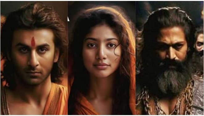
સાથે કરવામાં આવ્યો હતો. કામ કરવાને કારણે, ફિલ્મનું શૂટિંગ હકીકતમાં, આઈટફિટ્સ પર ફરીથી શરૂ થવામાં થોડા દિવસો વિલંબ થયો હતો. જો કે હવે રણબીર કપૂર, યશ અને સાઈ પલ્લવીની ફિલ્મ આખરે ફ્લોર પર આવી ગઈ છે. સોશિયલ મીડિયા પર ઘણા સમયથી નિતેશ તિવારીની રામાયણને લઈને ચર્ચા ચાલી રહી છે. મહિનાઓથી, તેના કલાકારો અંગેના વિવિધ અહેવાલોએ ફિલ્મ વિશે ચાહકોની ઉત્સુકતા વધારી દીધી છે. ફિલ્મમાં રણબીર કપૂર રામના રોલમાં જોવા મળશે, કેજીએફ ફેમ યશ રાવણના રોલમાં અને સાઈ પલ્લવી સીતાના રોલમાં જોવા મળશે.

મુંબઈ, નિતેશ તિવારી આજથી પોતાની કારકિર્દીની સૌથી મહત્વપૂર્ણ ફિલ્મ રામાયણનું શૂટિંગ શરૂ કરવા જઈ રહ્યા છે. આજે એટલે કે રજી એપ્રિલથી, મુંબઈની ફિલ્મ સિટીમાં સીતાની ભૂમિકા ભજવી રહેલી સાઈ પલ્લવી સહિત ફિલ્મના કલાકારો આ ફિલ્મ માટે પહેલીવાર કેમેરાનો સામનો કરવા જઈ રહ્યા છે. સોમવારે, ટીમે સૌથી મહત્વપૂર્ણ કામ કર્યું, એટલે કે લુક ડેસ્ટ. આ લુક ડેસ્ટ વેસ્ટેડ કોસ્ચ્યુમ