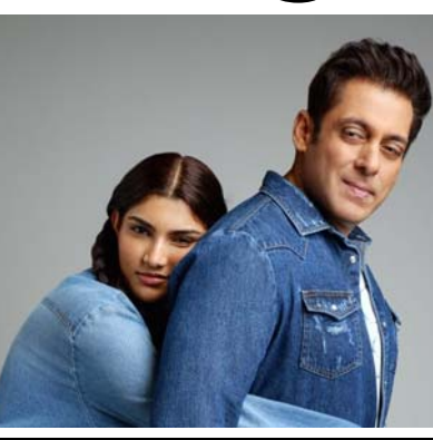
મુંબઈ, ફિલ્મ 'ફરે'થી બોલિવૂડમાં એન્ટ્રી કરનાર અલીઝેહ અગ્નિહોત્રી સલમાન ખાનની ભત્રીજી છે. તે સલમાનની બહેન અલવીરા ખાન-અગ્નિહોત્રી અને અભિનેતા અતુલ અગ્નિહોત્રીની મોટી પુત્રી છે. તાજેતરમાં, સલમાન ખાન અને અલીઝેહ બંનેએ તેમના સોશિયલ મીડિયા એકાઉન્ટ્સ પર ચાહકો સાથે એક સારા સમાચાર શેર કર્યા છે. તેણે કહ્યું હતું કે ટૂંક સમયમાં જ અલીઝેહની ફિલ્મ 'ફરે'