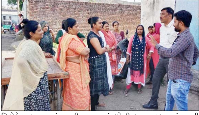
વિગેરે ચકાસવામાં આવી. આ સિવાય પ્રોજેક્ટ શાખા દ્વારા સમી

રાજકોટ, સ્વચ્છ સર્વેક્ષણ ૨૦૨૪ અને નિર્મળ ગુજરાત ૨.૦ અન્વયે રાજકોટ શહેરમાં આવેલ રાજકોટ મહાનગરપાલિકાના કુલ-૧૩૫ સ્લમ વિસ્તારો જેમાં મહાનગર પાલિકાના અધિકારીઓ દ્વારા સ્વચ્છતા અંગેના પેરામીટરની ચકાસણી કરવામાં આવી હતી. જેમાં સોલીડ વેસ્ટ મેનેજમેન્ટ શાખા દ્વારા કરવામાં આવતી સફાઈ કામગીરી, ૧૦૦% ડોર ટુ ડોર ગાર્બેજ કલેક્શનની કામગીરી