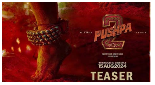
મુંબઈ, જે ફિલ્મની ચાહકો પાટ ૧ રિલીઝ થયા ત્યારથી રાહ જોઈ રહ્યા હતા. તેના માટે એક ખુશીના સમાચાર સામે આવ્યા છે. ટૂંક સમયમાં જ પુષ્પા-૨ ફિલ્મ રિલીઝ થશે એ પહેલા તમને જણાવી દઈએ કે, હાલમાં આ ફિલ્મનું પોસ્ટર શેર કરવામાં આવ્યું છે. મેક્સ દ્વારા શેર કરાયેલા પોસ્ટરમાં ચારેબાજુ સિંદૂર જોવા મળી રહ્યું છે. આ સિંદૂરની આસ-પાસ દીવા પણ જોવા મળી રહ્યા છે તેમજ પગમાં ઝાંઝર બાંધી કોઈ ડાન્સ કરી રહ્યું છે. પુષ્પા ફિલ્મે સારી એવી કમાણી કરી હતી. આ ફિલ્મના ડાયલોગ પણ સૌને ખુબ પસંદ આવ્યા હતા. ચાહકોનું માનવું છે કે, આ પગ અલ્લુ અર્જુનના છે. આ પહેલા મેક્સ એક પોસ્ટર શેર કર્યું હતું. આ પોસ્ટરમાં અલ્લુ