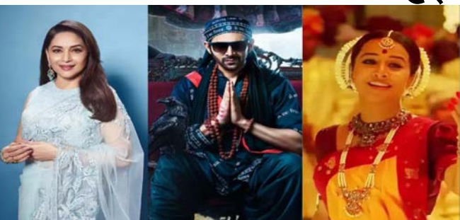
પહેલા શેઝુલમાં કાર્તિક આર્યનની સાથે તૃપ્તિ ડિમરી અને વિદ્યા બાલન પણ જોવા મળશે. બંને એક્ટરની સાથે મળીને ઘણાં ભાગની શૂટિંગ પૂર્ણ કર્યું છે. મીડિયા રિપોર્ટ મુજબ એવું જાણવા મળ્યું છે કે મુંબઈ સિવાય અન્ય ઘણી જગ્યાએ શૂટિંગ થશે. આ ફિલ્મમાં તેમની સાથે વધુ એક એક્ટ્રેસ જોડાવવાની છે, જે છે માધુરી દીક્ષિત. વિદ્યા બાલન અને કાર્તિક આર્યન મળીને 'ભૂલ ભૂલૈયા ૩'માં ખૂબ ધૂમ મચાવવાના છે.

મુંબઈ, કાર્તિક આર્યન તેના અપકમિંગ પ્રોજેક્ટને લઈને ચર્ચામાં રહે છે. તેના ખાતામાં ઘણી ફિલ્મો છે. મોટા મોટા ડાયરેક્ટર્સ તેની સાથે ફિલ્મ બનાવવા માંગે છે. હાલમાં જ તેને વિશાલ ભારદ્વાજની ફિલ્મ સાઈન કરી. તેમાં તે ગેંગસ્ટર હુસૈન ઉસ્તરાના રોલમાં જોવા મળવાનો છે. ફિલ્મને લઈને વધુ જાણકારી સામે આવી નથી. પરંતુ આ ફિલ્મ આવતા વર્ષે થિયેટરોમાં રિલીઝ