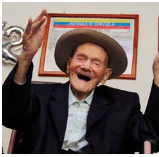
આપી હતી. જુઆનનો જન્મ ૨૭ મે ૧૮૦૮ના રોજ થયો હતો. તેમના ૧૧ પુત્રો, ૪૧ દોહત્રી, ૧૮ પૌત્ર-પૌત્રીઓ અને ૧૨ ગ્રેટ-ગ્રેટ ગ્રાન્ડ ચિલ્ડ્રન છે. ગિનિસના અહેવાલ

વેનેઝુએલા, વિશ્વના સૌથી વૃદ્ધ વ્યક્તિએ દુનિયાને અલવિદા કહી દીધું છે. આ વ્યક્તિનું નામ જુઆન વિસેન્ટ પેરેઝ મોરા હતું અને તેમની ઉંમર ૧૧૪ વર્ષ હતી. જુઆન વિસેન્ટ પેરેઝ મોરા વેનેઝુએલાના રહેવાસી હતા. ફેબ્રુઆરી ૨૦૨૨ માં ગિનિસ બુક ઓફ વર્લ્ડ રેકોર્સ તેમને સૌથી વૃદ્ધ વ્યક્તિ જાહેર કર્યા હતા. તે સમયે તેમની ઉંમર ૧૧૨ વર્ષ ૨૫૦ દિવસ હતી. વેનેઝુએલાના પ્રમુખ નિકોલસ માદુરોએ સોશિયલ મીડિયા પ્લેટફોર્મ ૬ પર જુઆનના મોતની જાણકારી આપી હતી. જુઆનનો જન્મ ૨૭ મે ૧૮૦૮ના રોજ થયો હતો. તેમના ૧૧ પુત્રો, ૪૧ દોહત્રી, ૧૮ પૌત્ર-પૌત્રીઓ અને ૧૨ ગ્રેટ-ગ્રેટ ગ્રાન્ડ ચિલ્ડ્રન છે. ગિનિસના અહેવાલ