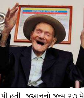
આપી હતી. જુઆનનો જન્મ ૨૭ મે ૧૮૦૮ના રોજ થયો હતો. તેમના ૧૧ પુત્રો, ૪૧ દોહત્રી, ૧૮ પૌત્ર-પૌત્રીઓ અને ૧૨ ગ્રેટ-ગ્રેટ ગ્રાન્ડ ચિલ્ડ્રન છે. ગિનિસના અહેવાલ

વેનેઝુએલા, વિશ્વના સૌથી વૃદ્ધ વ્યક્તિએ દુનિયાને અલવિદા કહી દીધું છે. આ વ્યક્તિનું નામ જુઆન વિસેન્ટ પેરેઝ મોરા હતું અને તેમની ઉંમર ૧૧૪ વર્ષ હતી. જુઆન વિસેન્ટ પેરેઝ મોરા વેનેઝુએલાના રહેવાસી હતા. ફેબ્રુઆરી ૨૦૨૨ માં ગિનિસ બુક ઓફ વર્લ્ડ રેકોર્સ તેમને સૌથી વૃદ્ધ વ્યક્તિ જાહેર કર્યા હતા. તે સમયે તેમની ઉંમર ૧૧૨ વર્ષ ૨૫૦ દિવસ હતી. વેનેઝુએલાના પ્રમુખ નિકોલસ માદુરોએ સોશિયલ મીડિયા પ્લેટફોર્મ ૬ પર જુઆનના મોતની જાણકારી આપી હતી. જુઆનનો જન્મ ૨૭ મે ૧૮૦૮ના રોજ થયો હતો. તેમના ૧૧ પુત્રો, ૪૧ દોહત્રી, ૧૮ પૌત્ર-પૌત્રીઓ અને ૧૨ ગ્રેટ-ગ્રેટ ગ્રાન્ડ ચિલ્ડ્રન છે. ગિનિસના અહેવાલ