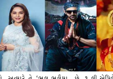
થશે. અત્યારે તે 'ભૂલ ભૂલૈયા ૩'ના શૂટિંગમાં બિઝી છે. થોડા જર્મની વેકેશનથી પરતી પરત ફરીને કામ શરૂ કર્યું છે.

મુંબઈ, કાર્તિક આર્યન તેના અપકમિંગ પ્રોજેક્ટને લઈને ચર્ચામાં રહે છે. તેના ખાતામાં ઘણી ફિલ્મો છે. મોટા મોટા ડાયરેક્ટર્સ તેની સાથે ફિલ્મ બનાવવા માંગે છે. હાલમાં જ તેને વિશાલ ભારદ્વાજની ફિલ્મ સાઈન કરી. તેમાં તે ગેંગસ્ટર હુસૈન ઉસ્તરાના રોલમાં જોવા મળવાનો છે. ફિલ્મને લઈને વધુ જાણકારી સામે આવી નથી. પરંતુ આ ફિલ્મ આવતા વર્ષે થિયેટરોમાં રિલીઝ