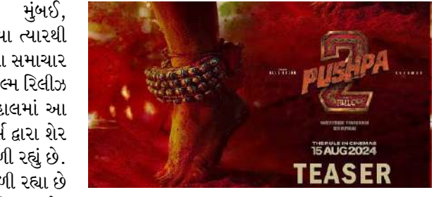
અર્જુનનો હાથ જોવા મળી રહ્યો હતો. ફિલ્મનું ટીઝર ૮ એપ્રિલના રોજ રિલીઝ થશે. તમને જણાવી દઈએ કે, મેક્સે આ ફિલ્મની પહેલી ઝલક શેર કરવા માટે ૮ એપ્રિલનો દિવસ પસંદ કર્યો છે. કારણ કે, આ દિવસે સુપર સ્ટાર અલ્લુ અર્જુનનો જન્મદિવસ પણ છે.

મુંબઈ, જે ફિલ્મની ચાહકો પાર્ટ ૧ રિલીઝ થયા ત્યારથી રાહ જોઈ રહ્યા હતા. તેના માટે એક ખુશીના સમાચાર સામે આવ્યા છે. ટૂંક સમયમાં જ પુષ્પા-૨ ફિલ્મ રિલીઝ થશે એ પહેલા તમને જણાવી દઈએ કે, હાલમાં આ ફિલ્મનું પોસ્ટર શેર કરવામાં આવ્યું છે. મેક્સ દ્વારા શેર કરાયેલા પોસ્ટરમાં ચારેબાજુ સિંદૂર જોવા મળી રહ્યું છે. આ સિંદૂરની આસ-પાસ દીવા પણ જોવા મળી રહ્યા છે તેમજ પગમાં ઝાંઝર બાંધી કોઈ ડાન્સ કરી રહ્યું છે. પુષ્પા ફિલ્મે સારી એવી કમાણી કરી હતી. આ ફિલ્મના ડાયલોગ પણ સૌને ખુબ પસંદ આવ્યા હતા. ચાહકોનું માનવું છે કે, આ પગ અલ્લુ અર્જુનના છે. આ પહેલા મેક્સ એક પોસ્ટર શેર કર્યું હતું. આ પોસ્ટરમાં અલ્લુ