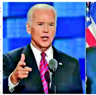
રાજ્યોમાં ટ્રમ્પ બિડેન કરતાં બેથી આઠ ટકા પોઈન્ટ્સ આગળ છે. જો કે, વિસ્કોન્સિન રાજ્યમાં, રાષ્ટ્રપતિ બિડેન ટ્રમ્પ કરતાં ત્રણ પોઈન્ટ્સ આગળ છે.

આ વર્ષે નવેમ્બરમાં રાષ્ટ્રપતિની ચૂંટણી યોજાવાની છે. તે પહેલા આ લેસ્ટેટ ઓપિનિયન પોલ છે. આ મુજબ રાષ્ટ્રપતિ જો બિડેન સાતમાંથી ૬ મેદાનમાં તેમના મુખ્ય પ્રતિસ્પર્ધી ડોનાલ્ડ ટ્રમ્પથી પાછળ છે. જે ૭ રાજ્યોમાં ભૂતપૂર્વ રાષ્ટ્રપતિ ટ્રમ્પ આગળ છે તેમાં પેન્સિલવેનિયા, મિશિગન, એરિઝોના, જ્યોર્જિયા, નેવાડા અને નોર્થ કેરોલિના છે. આ રાજ્યોમાં ટ્રમ્પ બિડેન કરતાં બેથી આઠ ટકા પોઈન્ટ્સ આગળ છે. જો કે, વિસ્કોન્સિન રાજ્યમાં, રાષ્ટ્રપતિ બિડેન ટ્રમ્પ કરતાં ત્રણ પોઈન્ટ્સ આગળ છે.