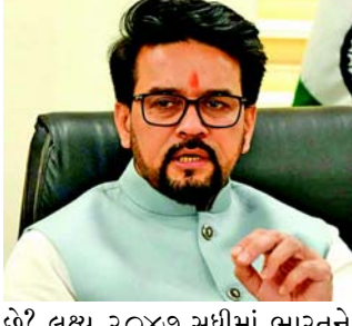
અનુરાગ ઠાકુરે કહ્યું કે અમારી ફરજ છે કે અમે તેમને યાદ અપાવીએ કે ૨૦૦૯ થી ૨૦૧૪ વચ્ચે ઘણા કૌભાંડો થયા હતા.

કોંગ્રેસના કૌભાંડોને કારણે આ ભૂલી ગયા છે. તેમની ઉંમર માત્ર ૮ અને ૧૦ વર્ષની હતી. અનુરાગ ઠાકુરે કહ્યું, "તેઓ ૨૭ કોભાંડ કે સીડબ્લ્યુજી કોભાંડ વિશે જાણતા નથી. તેઓ અગસ્તા વેસ્ટવેલ્ડ, કોલસા કોભાંડ અને તે બધા વિશે જાણતા નથી." અનુરાગ ઠાકુરે કહ્યું કે અમારી ફરજ છે કે અમે તેમને યાદ અપાવીએ કે ૨૦૦૯ થી ૨૦૧૪ વચ્ચે ઘણા કૌભાંડો થયા હતા.