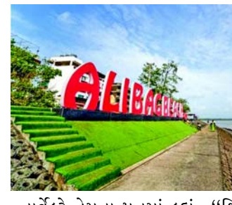
નારવેકરે તેમના પત્રમાં કહ્યું, "શિવાજી મહારાજે એક મજબૂત નૌકાદળનો પાયો નાખ્યો અને કોક્ષમાંથી મયનાક ભંડારીએ તેનું નેતૃત્વ કર્યું. ખડતલ લડાઈ અને મયનાક ભંડારીની બહાદુરીના કારણે અંગ્રેજોએ અલીબાગના ખંડેરી-ઉંદરી બંદરના કિલ્લામાંથી પીછેહઠ કરવી પડી હતી.

મહારાષ્ટ્ર વિધાનસભાના અધ્યક્ષ રાહુલ નારવેકરે રાજ્ય સરકારને અલીબાગનું નામ બદલીને 'મયનાકનગરી' કરવાની અપીલ કરી છે. મુંબઈ નજીક સ્થિત દરિયાકાંઠાનું શહેર અલીબાગ એક પ્રવાસન વિસ્તાર છે. હડકીતમાં, ઓલ ઈન્ડિયા ભંડારી એસોસિએશનનું એક પ્રતિનિધિમંડળ તાજેતરમાં નારવેકરને મળ્યું હતું અને નામ બદલવાની વિનંતી કરી હતી. વિધાનસભા અધ્યક્ષે ગુરુવારે મુખ્ય પ્રધાન એકનાથ શિંદેને પત્ર લખીને કહ્યું હતું કે મરાઠા યોદ્ધા શિવાજીના શાસન દરમિયાન, દરિયાકાંઠાની સુરક્ષા અને દરિયાકાંઠાના યુદ્ધની કામગીરી વિદેશી આક્રમકારોને રોકવા માટે મહત્વપૂર્ણ હતી.