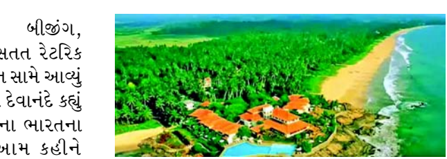
આસપાસ માછીમારોના હિતોની અવગણના કરી. હવે આના પર શ્રીલંકાના મંત્રી ડગ્લાસ દેવાનંદે કહ્યું છે કે ભારતમાં ચૂંટણીનો સમય છે અને કાચાથીવુ ટાપુને લઈને આવી વાતો સાંભળવી અસામાન્ય નથી. દેવાનંદે કહ્યું કે મને લાગે છે કે ભારત તેના હિત માટે કામ કરી રહ્યું છે અને તે જગ્યાએ ભારતીય માછીમારોને માછલી પકડવાની મંજૂરી આપવાનો પ્રયાસ કરી રહ્યું છે.

કચ્ચથીવુ ટાપુને લઈને ભારતમાં સતત રેટરિક ચાલુ છે. હવે આ અંગે શ્રીલંકાનું નિવેદન સામે આવ્યું છે. શ્રીલંકાના મત્સ્યોદ્યોગ મંત્રી ડગ્લાસ દેવાનંદે કહ્યું છે કે કાચાથીવુ ટાપુ પરત લેવા અંગેના ભારતના નિવેદનોનો કોઈ આધાર નથી. આમ કહીને શ્રીલંકાના મંત્રીએ કાચાથીવુ ટાપુ પર ભારતના દાવાને ફગાવી દીધા. શ્રીલંકાના મંત્રીનું આ નિવેદન એવા સમયે સામે આવ્યું છે જ્યારે પીએમ મોદી અને ભારતમાં તેમની સરકાર કોંગ્રેસ પાર્ટી અને ડીએમકે પાર્ટી પર કાચાથીવુ ટાપુને લઈને રાષ્ટ્રીય હિતોની અવગણના કરવાનો આરોપ લગાવી રહી છે. ભાજપ સરકારનો આરોપ છે કે કોંગ્રેસ અને ડીએમકેએ કાચાથીવુ ટાપુની