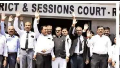
અંદાજ કરી હતી. રાજકોટ બારની લાઈબ્રેરીની બુકોની જાળવણીના શુભ હેતુથી બારમાં ઝેરોક્ષ મશીન રાખ્યું હતું તેમ છતાં રાજકોટ બાર સાથે અંગત અદાવત હોય તે રીતે વર્તી રહેલો હોય જેના કારણે બારના સભ્યોમાં રોષ પ્રવર્તી રહ્યો છે. પીડીજ દ્વારા કોર્ટપાસ માધ્યમથી રાજકોટ બાર એસોસિએશન તથા તેના સભ્યો સાથે ધર્ષણ કરવા ઈરાદાપૂર્વક પ્રયાસ થઈ રહ્યાનો આક્ષેપ કરી તેના વિરોધમાં કાર્યક્રમ આપવાની પણ જાહેરાત કરવામાં આવી છે.

રાજકોટ: રાજકોટ બાર એસોસિએશનના રૂમમાંથી ૪૦ વર્ષથી આવેલા ઝેરોક્ષ મશીનની પ્રિન્સિપલ ડિસ્ટ્રિક્ટ જજની સુચનાથી રજિસ્ટ્રારે જમીન કાર્યવાહી કરતા તેના વિરોધમાં ચુકવારે વકીલોએ કાળી પટ્ટી ધારણ કરી સુઓચ્ચાર સાથે વિરોધ નોંધાવ્યો હતો અને પ્રિન્સિપલ ડિસ્ટ્રિક્ટ જજ અંગત અદાવત હોય અને ધર્ષણ થાય તેમ ઈરાદાપૂર્વક વર્તી રહ્યાનો આક્ષેપ રાજકોટ બાર એસોસિએશને કર્યો છે. રાજકોટ બાર એસોસિએશને જારી કરેલી યાદીમાં જણાવ્યું હતું કે, બાર રૂમમાં છેલ્લા ૪૦ વર્ષથી આવેલા ઝેરોક્ષ મશીન પીડીજ વચ્છાણીના હુકમથી રાજકોટ ડિસ્ટ્રિક્ટ કોર્ટના રજિસ્ટ્રાર દ્વારા કોર્ટપાસ જાતની પ્રોસિજર અનુસર્યા વગર કે સ્થળ પર પંચનામું કે રોજકામ કર્યા વગર તથા વર્તમાન હોદ્દાદારોને જાણ કર્યા વગર કે કોઈ હુકમની બજવણી કર્યા વગર ગેરકાયદેસર રીતે મનસ્વી રીતે જમ કરેલ હતું. આ ઝેરોક્ષ મશીન પરત ચલાવ સિનિપર અને જુનિયર વકીલોએ કરેલી રજૂઆતો પણ નજર