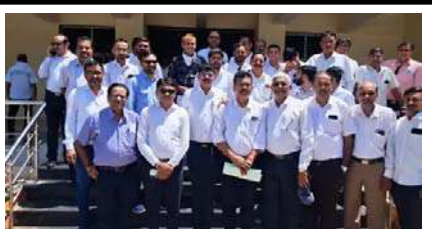
પરિપત્ર દસ્તાવેજની કામગીરી ટેકનિકલ હોય છે. ભવિષ્યમાં જ્યારે પણ જરૂર પડે ત્યારે પણ વારંવાર તેનો ઉપયોગ થતો હોય છે. ત્યારે આ કામગીરી સચોટ રીતે થાય તેના માટે વકીલોની હાજરી અનિવાર્ય છે. ભવિષ્યમાં કોઈપણ પ્રશ્ન ન ઉદભવે તે માટેના ટેકનિકલ મુદ્દાઓ જોઈને દસ્તાવેજની પ્રક્રિયા વકીલો જ કરાવતા હોય છે. સામાન્ય લોકોને આ માટેના ગરવી ગુજરાત સહિતના સોફ્ટવેરમાં કોઈપણ વાવે તેવી શક્યતા

રાજકોટ: નાજરમાં નોંધણી સર નિરીક્ષક અને સુપ્રિટેન્ડન્ટ ઓફ સ્ટેમ્પ્સ કચેરી દ્વારા એક પરિપત્ર જાહેર કરાયો છે. જેમાં દસ્તાવેજ કરતી વખતે લખી આપનાર, લખાવી લેનાર અને માત્ર સાક્ષી સિવાય કોઈપણ અનઅધિકૃત વ્યક્તિને પ્રવેશ કરવાની મનાઈ ફરમાવવામાં આવી છે. સામાન્ય રીતે દસ્તાવેજ કરતી વખતે વકીલો સાથે હોય છે. ત્યારે આ પરિપત્ર દ્વારા એડવોકેટને ટાર્ગેટ કરવામાં આવ્યા હોવાના આરોપ સાથે આજે નોંધણી કચેરીએ વકીલો દ્વારા વિરોધ કરવામાં આવ્યો હતો. તેમજ આ પરિપત્ર પરત લેવા આવેદન પાઠવી રજૂઆત કરવામાં આવી હતી. રેવન્યુ બાર એસોસિએશનના સભ્ય જણાવ્યું હતું કે, રાજ્ય સરકાર દ્વારા પરિપત્ર બહાર પાડવામાં આવ્યો છે. જેમાં દસ્તાવેજ સમયે પરીદેનાર, વેચનાર અને સાક્ષી સિવાય કોઈને સાથે રહેવાની મનાઈ કરી દેવામાં આવી