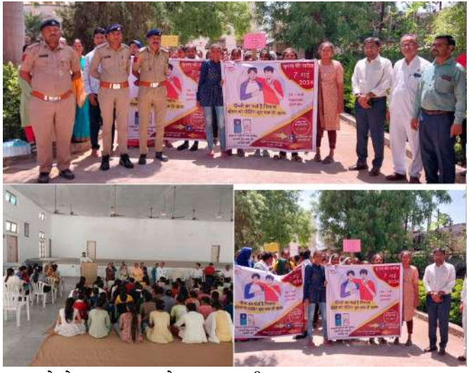
યુવાઓએ મતદાન માટે શપથ લીધા હતા.

(અતુલ કારિયા) અમરેલી: સિસ્ટમેટીક વોટર્સ એજ્યુકેશન એન્ડ ઈલેક્ટોરલ પાર્ટીસીપેશન (SVEE) અંતર્ગત જિલ્લાના વિવિધ વિસ્તારોમાં મતદાન જાગૃતિ પ્રસારવાના આયોજનના ભાગરૂપે કાર્યક્રમો શરૂ છે. અમરેલી જિલ્લાના ધારી સ્થિત યોગીજી મહારાજ મહિલા કોલેજ ખાતે મતદાન જાગૃતિ કાર્યક્રમ અન્વયે યુવાઓ બાઈક રેલીમાં જોડાયા હતા. ધારી પ્રાંત અધિકારીશ્રી તથા તાલુકા વિકાસ અધિકારીશ્રીએ સહભાગી બનીને મતદાનનો સંદેશો પ્રસારવ્યો હતો. આ પ્રસંગે બહોળી સંખ્યામાં વિદ્યાર્થીઓ,