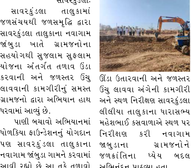
ઊંડા ઉતારવાની અને જળસ્તર ઊંચું લાવવા અંગેની કામગીરી અને સ્થળ નિરીક્ષણ સાવરકુંડલા લીલીયા તાલુકાના ધારાસભ્ય મહેશભાઈ કસવાળાએ સ્થળ પર નિરીક્ષણ કરી નવાગામ જાંબુડાના ગ્રામજનોને જાણકાંતિના ધ્યેય બદલ અભિનંદન પાઠવ્યા હતા.

સાવરકુંડલા: સાવરકુંડલા તાલુકામાં જળસંચયથી જળસમૃદ્ધિ દ્વારા સાવરકુંડલા તાલુકાના નવાગામ જાંબુડા ખાતે ગ્રામજનોના સહયોગથી કરતા ૨ ટ્રેક્ટર દ્વારા ટ્રોલી સાથે મળી કુલ અંદાજીત રૂ. ૩.૧૦ લાખની કિંમતનો મુદામાલ જમ કરવામાં આવેલ છે. અને નિયમોનુસાર કાર્યવાહી કરવા માટે ખાણ પનીજ ઓફિસ ગીર સોમનાથને અહેવાલ કરવામાં આવેલ છે. આમ ખનિજ રેતી ચોરી કરનાર સામે તંત્ર એ લાલ આંખ કરતા ખનિજ ખોરોમાં ફફડાટ મચી ગયેલ છે.