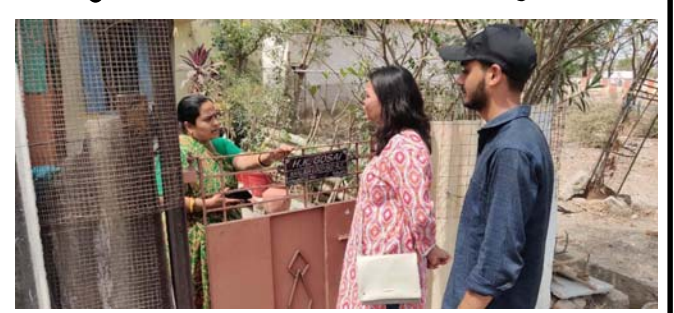
જાગૃતિ ઝુંબેશ ચલાવવામાં આવી હતી. આ ઝુંબેશ હેઠળ રાજકોટના લોકો કોલોની, કોન્સ્ટિટ્યુશન કોલોની તથા આર.ઓ.બી. ક્વાર્ટર્સ વિસ્તારમાં વોર્ડ ઓફિસરશ્રી દ્વારા ધરે- ધરે મુલાકાત લઈ મતદારોને જાગૃત કરવામાં આવ્યા હતા. મતદારોને મતદાન વિશેની સમજૂતી આપી, ચૂંટણીમાં અચૂક મતદાન કરવા તથા કરાવવા માટે અપીલ કરવામાં આવી હતી તેમ મામલતદારશ્રી રાજકોટ પૂર્વની યાદીમાં જણાવાયું છે.