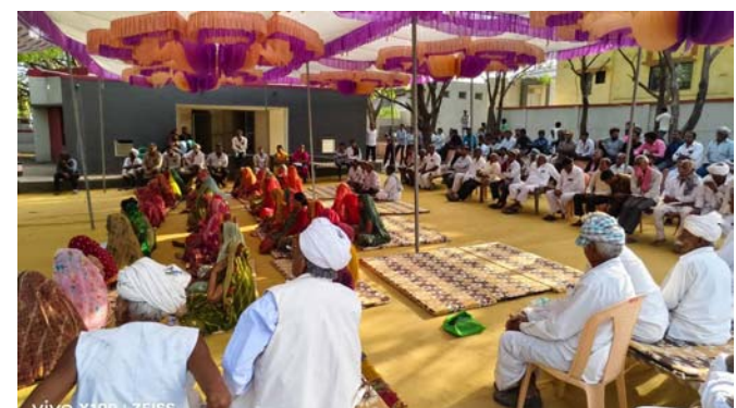
ગુંદાળા જસ ગામે જિલ્લા ચૂંટણી અધિકારી તથા કલેક્ટર શ્રી પ્રભવ જોશીના અધ્યક્ષસ્થાને વિશેષ ખાટલા બેઠક યોજવામાં આવી હતી. આ ગામમાં પુરુષ મતદારોના પ્રમાણમાં મહિલાઓનું મતદાન ઓછું હોય છે, ત્યારે ખાટલા સભામાં “મતદાર જાગૃતિ તથા યુનાવી પાઠશાળા” કાર્યક્રમ થકી તમામ નાગરિકોને મતાધિકાર

રાજકોટ, ચૂંટણી એ લોકશાહીનું પર્વ અને દેશનો ગર્વ છે. હાલ લોકસભાની ચૂંટણી આવી પહોંચી છે ત્યારે વધુમાં વધુ મતદારો પોતાના મતાધિકારનો ઉપયોગ કરીને લોકશાહીની પ્રક્રિયામાં ભાગીદાર બને તે માટે, રાજકોટ જિલ્લા ચૂંટણી અધિકારી શ્રી પ્રભવ જોશીના નેતૃત્વમાં જિલ્લાના વિવિધ વિસ્તારોમાં સ્વીપ (સિસ્ટમેટિક વોર્ટ્સ એજ્યુકેશન એન્ડ ઈલેક્ટોરલ પાર્ટિસિપેશન) હેઠળ મતદાન જાગૃતિના પ્રયાસો ચાલી રહ્યા છે. જે અંતર્ગત વીંછિયા તાલુકાના