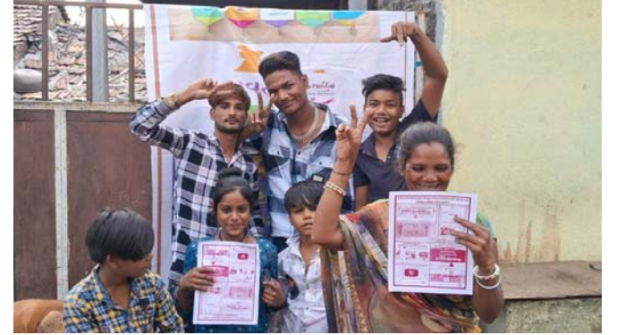
કુબલિયાપરા, શેરી તથા તેમની મતદાનની પવિત્ર ફરજની યાદ અપાવી આગામી લોકસભા ચૂંટણીમાં તા.૭ મે ના રોજ અવશ્ય મતદાન કરવા અપીલ કરવામાં આવી હતી. ઉપરાંત, મતદાર જાગૃતિ અંગેના પેપરલેટનું વિતરણ પણ કરવામાં આવ્યું હતું.