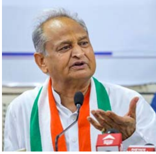
રહેવાસી છે. એવું સામે આવ્યું છે કે તેણે જોધપુરથી તેના એક સંબંધીને કરોડોની કિંમતની જમીન તગડી કિંમતે આપી હતી. ચૂંટણી દરમિયાન પ્રકાશમાં આવેલા આ મામલાથી

જયપુર, લોકસભા ચૂંટણી દરમિયાન જોધપુરથી મોટી ગેરરીતિનો મામલો સામે આવ્યો છે. આ મામલો પૂર્વ સીએમ અશોક ગેહલોત સાથે જોડાયેલો છે. આવી સ્થિતિમાં તે સતત હેડલાઈન્સમાં રહે છે. આરોપ છે કે પૂર્વ સીએમ અશોક ગેહલોતના સંબંધીને ૧૫ કરોડ રૂપિયાની જમીન ૩.૬૭ કરોડ રૂપિયામાં આપવામાં આવી હતી. જોધપુર ઉવલપમેન્ટ ઓથોરિટી (જીડીએ) તરફથી આ મામલો સામે આવ્યો છે. પૂર્વ સીએમ ગેહલોત જોધપુરના