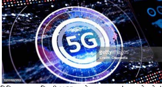
ડિજિટલ ગામ દિલ્હી NCR પાસે બનાવવામાં આવશે. જેનું કામ એપ્રિલના અંત સુધીમાં શરૂ થશે. ગામડાઓમાં કૃષિ ક્રાંતિમાં 5G સેવાનો ઉપયોગ કરવામાં આવશે. આ મોડલ

નવીદિલ્હી, દેશમાં 4G ક્રાંતિ બાદ હવે 5G સેવાઓની તૈયારીઓ શરૂ થઈ ગઈ છે. દરમિયાન, સરકાર 5G સેવાઓથી સજ્જ ડિજિટલ મોડલ ગામ બનાવવાની તૈયારી કરી રહી છે. જેના કારણે લોકો ટૂંક સમયમાં અનુભવી શકશે કે 5G સેવાઓ કેવી રીતે કૃષિ, શિક્ષણ અને આરોગ્યને બદલી શકે છે. 5G ના આ મિશન વિશે માહિતી આપતા જણાવવામાં આવ્યું હતું કે 5G સેવા હવે માત્ર શહેરોમાં જ નહિ પરંતુ ગામડાઓમાં પણ ક્રાંતિ લાવશે. હવે સરકાર 5G સેવાઓથી સજ્જ ગામડાઓ બનાવવા જઈ રહી છે. તમને જણાવી દઈએ કે, પહેલું મોડલ