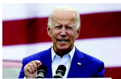
ધ હિલ અનુસાર, મેરીલેન્ડની મુલાકાત લેનાર બિડેને તૂટેલા પુલને કારણે થયેલા નુકસાનનો સ્ટોક લીધો હતો. સ્થળનું નિરીક્ષણ કરતાં તેણે કહ્યું, 'હું અહીં તમારા લોકો માટે આવ્યો છું. આ મુશ્કેલ સમયમાં આખો દેશ

વોશિંગ્ટન, રાષ્ટ્રપતિ જો બિડેને બાલ્ટીમોરમાં તૂટેલા ફ્રાન્સિસ સ્કોટ બ્રિજની મુલાકાત લીધી હતી. તેમણે કહ્યું કે અમે પુલને ફરીથી બનાવવા માટે સ્વર્ગ અને પૃથ્વીને એક કરીશું. બિડેને કહ્યું, 'મિત્રો, આ પુલને શક્ય તેટલી ઝડપથી ફરીથી બનાવવા માટે અમે સ્વર્ગ અને પૃથ્વીને ખસેડવા જઈ રહ્યા છીએ.' અમેરિકી રાષ્ટ્રપતિએ નુકસાનને વિનાશક ગણાવ્યું અને કહ્યું, "અમે પુલના પુનઃનિર્માણમાં મદદ કરવા માટે બનતું બધું કરીશું." ફેડરલ સરકાર શ્રમ અને બાંધકામ સામગ્રીનો ખર્ચ પણ ઉઠાવશે.