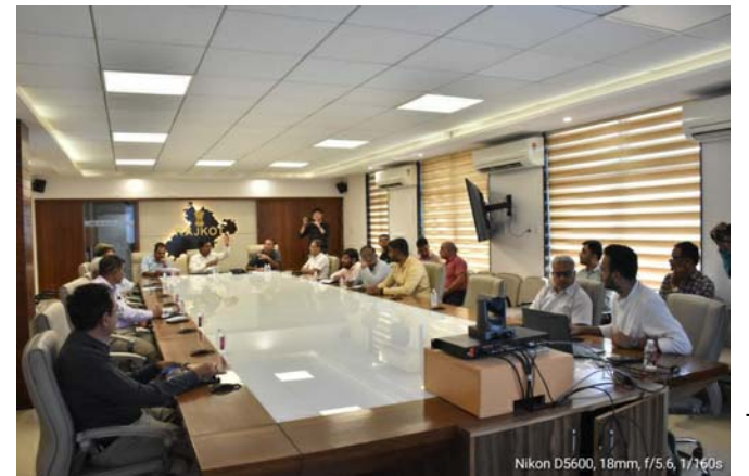
રાજકોટ, આગામી લોકસભા - ૨૦૨૪ ચૂંટણી અન્વયે ગુજરાતમાં ૭ મે ના રોજ મતદાન થવા જઈ રહ્યું છે. જેની પ્રક્રિયાના ભાગ રૂપે આજરોજ કલેક્ટર અને જિલ્લા જિલ્લા ચૂંટણી અધિકારીશ્રીની અધ્યક્ષતામાં ઈ. વી.એમ. મશીનની પહેલી રેન્ડમાઈઝેશન પ્રક્રિયા પૂર્ણ કરવામાં આવી છે. રાજકીય પક્ષોના આગેવાનોની ઉપસ્થિતિમાં કલેક્ટર ઓફિસ ખાતે ફર્સ્ટ રેન્ડમાઈઝેશન પ્રક્રિયા હાથ ધરવામાં આવી હતી. જેમાં ૬૮ થી ૭૫ વિધાનસભા મત વિસ્તારના ૨૨૩૬ બુથ માટે જરૂરી ઈ.વી.એમ. ની ફાળવણી માટે પ્રક્રિયા હાથ ધરવામાં આવી હતી. અધિક ચૂંટણી અધિકારી શ્રી