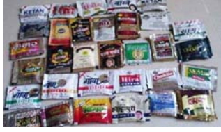
મિક્સર, સાડીઓ, ચુડીદાર, દુપટ્ટા અને ટ્રાઉઝર સામેલ છે. બિદર, શિવમોગા, ચિકમંગલુરુ અને ગુલબર્ગા આ વિસ્તરમાં સૌથી ઉપર છે. ગેરકાયદે વહેંચવામાં આવી રહેલા આ સામાન જમ કરીને પર પોલીસે ધરપકડની કાર્યવાહી શરૂ કરી છે. રિપોર્ટ અનુસાર, પોલીસે શિવમોગામાં ચોખા, મીઠું અને તેલના પાઉચ પણ પકડ્યા છે.

નવીદિલ્હી, લોકસભા ચૂંટણી દરમિયાન ઉમેદવારો મતદારોને આકર્ષવા અવનવી તરકીબો અજમાવી રહ્યા છે. મીડિયા અહેવાલ મુજબ આ વખતે ઉમેદવારો મતદારોને આકર્ષવા માટે તમાકુ, પુશ્પાદાર ગુટખા, સ્માર્ટ ટીવી જેવી ચીજો પણ આપવામાં આવી છે. જાણકારનો કહેવા પ્રમાણે ચૂંટણીમાં લડાણી તરીકે પાન-મસાલાનો આપવા સામાન્ય નથી. સામાન્ય રીતે લોકોને કપડાંની ઓફર કરવામાં આવે છે. મુખ્ય ચૂંટણી અધિકારી વેક્ટેશ કુમારે જણાવ્યું કે, જમ કરાયેલી સામગ્રીમાં કુકર,