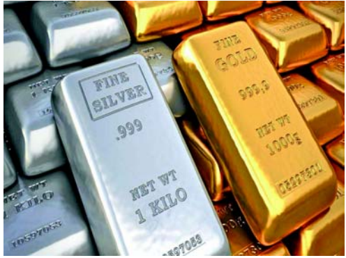
મુંબઈ, MCX પછી આજે સોના અને ચાંદીના ભાવે બુલિયન માર્કેટમાં પણ તમામ રેકોર્ડ તોડી નાખ્યા છે.

આજે સોનું ૧૧૮૨ રૂપિયા મોંઘુ થયું અને ૭૧૦૬૪ રૂપિયા પ્રતિ ૧૦ ગ્રામના દરે ખુલ્યું. જ્યારે આજે ચાંદીનો ભાવ કિલો દીઠ રૂ. ૨૨૮૭ વધીને ખૂલ્યો હતો. આજે ચાંદી રૂ. ૮૧૩૮૩ પર ખુલી છે.