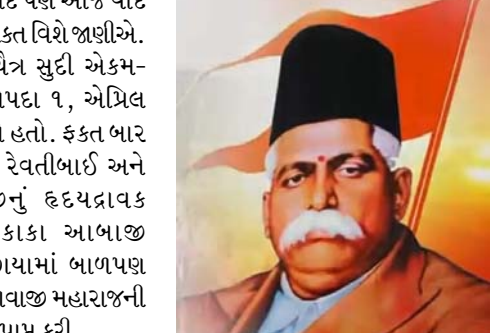
ચૈત્ર સુદ એકમ, ગુડી પડવો, તા. ૯-૪-૨૦૨૪ મંગળવાર જન્મદિવસ

આપણા દેશમાં કાલગણના માટે ઘણી પદ્ધતીઓ છે. પરંતુ આ પદ્ધતી ઈ.સ. પહેલાની વૈદિક કાલગણના મુજબની ખુબ જ પ્રાચીન પદ્ધતિ છે. આજના દિવસે બ્રહ્મજ્ઞએ સુદીપ્તિનું નિર્માણ કરેલું. સમ્રાટ વિક્રમાદિત્ય દ્વારા વિક્રમી સંવતનો શુભારંભ, મર્યાદા પુરુષોત્તમ ભગવાન શ્રી રામનો રાજ્યાભિષેક, દશાવતારમાં મત્સ્ય અવતાર અવતરણ, આ દિવસે સ્વામી દયાનંદ સરસ્વતી દ્વારા આર્યસમાજની સ્થાપના થઈ. નવરાત્રીનો પ્રારંભ (શક્તિની આરાધના) તથા ભગવાન ગૃહેલાલનો જન્મ દિવસ જેવા દિવસો છે. આજ દિવસે નાગપુરમાં એક મહાન દેશભક્ત ડો. કેશવરાવ બલીરામ હેડગેવારનો જન્મ થયેલ છે. જેમણે વિશ્વનું સૌથી મોટું દેશભક્ત સંગઠન એવા રાષ્ટ્રીય સ્વયંસેવક સંઘની સ્થાપના કરેલ. આ મહાન દેશભક્ત વિશે જોઈએ.