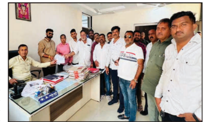
પોઈન્ટ એટલે કે જગ્યા આપવી જોઈએ. કારણ કે કજુરડા ગામથી વાડીનાર ૧૪ કિ.મી., ભરાણા ૯

વાડીનાર : નેશનલ હાઈવેથી નીચેના ૮-૧૦ ગામોને જોડતો સ્ટેટ હાઈવે વચ્ચે વાહન અવરજવર માટે જગ્યા મુકવા અંગે સંબંધિત વિભાગ- કચેરી સમક્ષ રજૂઆત કરવામાં આવી છે.