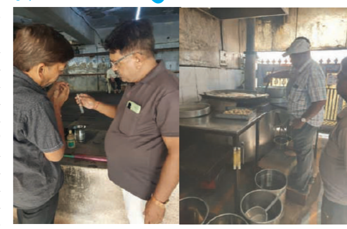
નમૂનીમાંથી દાંડી નમકની થેલીનો નાપાસ થતાં ધોરણસરની કાર્યવાહી કરવામાં આવી હતી. તેમજ શહેરના અલગ અલગ રેસ્ટોરન્ટ, ફાસ્ટફૂડ, આઈસ ફેક્ટરી, માટલા ફૂલ્કીવાળાને ત્યાં મનપાની ફૂડ શાખાએ ચેકિંગ કરી સફાઈ તથા સ્વચ્છતા જાળવવા, હાઈજીનિક કન્ટ્રીશન મેઈન્ટેઈન કરવા, સમયસર પેસ્ટ કંટ્રોલિંગ કરાવવા, કર્મચારીના ફીટનેશ સર્ટીફિકેટ

જામનગર : જામ્યુકોની ફૂડ શાખાએ મસાલાની સીઝનને અનુલક્ષી બહારથી આવેલા અન આઈલેટ કરી વ્યાજ કરતાં પાસેથી લેવામાં આવેલા નમૂના પૈકી ભારત મરચાં અને અ-વન મસાલા સેન્ટરમાંથી લીધેલું મરચાંનું સેમ્પલ નાપાસ થતાં કેસ કરી રૂ. ૧૦ હજારનો દંડ ફટકાર્યો હતો. ગ્રેઈન માર્કેટમાં કાશ ટેડર્સ અને અમૃતા ડેરીમાંથી પારસમણી બ્રાન્ડ ધીના નમૂના લીધા હતા. જે તપાસમાં ફેઈલ જતાં રૂ. ૨૦ હજારનો દંડ ફટકાર્યો હતો. આ ઉપરાંત લોડીબજારમાં આવેલી એન. જી. ટ્રેડર્સ નામની પેટીમાંથી લીધેલા નમૂના નાપાસ તથા ડેડીગનેટેડ ઓફિસર સમક્ષ મંજૂરી અર્થે મુકાયો હતો. દિગ્વિજય પ્લોટ શેરી નંબર ૨૪ માટે આવેલી સદગુરૂ ડેરીમાંથી પનીરનો નમૂનો નાપાસ થયો હતો. આથી તેણે રૂ. ૧૦ હજારનો દંડ ફટકારાયો હતો. ગ્રેઈન માર્કેટમાં આવેલી પેટી છગનલાલ એન્ડ