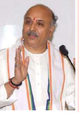
રૂપાલાના વિરોધમાં અસ્મિતા અને સ્વાભિમાન સંમેલન

સુરેન્દ્રનગર પરશોત્તમ રૂપાલા વિવાદમાં આંતરરાષ્ટ્રીય હિન્દુ પરિષદનાં અધ્યક્ષ પ્રવિણ તોગડીયાએ મહત્વનું નિવેદન આપ્યું છે. રૂપાલાની ટીપ્પણી બાદ સર્જાયેલ વિવાદ અંગે જવાબ આપતા તેમણે જણાવ્યું હતું કે આ વિવાદને હવે શાંત કરવો જોઈએ. આગેવાનો સાથે બેઠક યોજી હતી, જેના આગામી સમયમાં ગામે-ગામ હનુમાન ચાલીસા કેન્દ્રની સ્થાપના અંગે ચર્ચા વિચારણા કરી હતી.