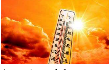
ભેજના કારણે ડિસ્કમ્પર્ટ કન્ટ્રિશનની સંભાવના છે. તેમજ છેલ્લા ૨૪ કલાકમાં નોંધાયેલ તાપમાનના આંકડા પર નજર કરીએ તો તેમાં અમદાવાદ ૪૦.૦ ડિગ્રી, ગાંધીનગર ૩૯.૩ ડિગ્રી, ડીસા ૪૧.૧ ડિગ્રી, વલ્લભ વિધાનનગર

અમદાવાદ, રાજ્યમાં કાળઝાળ ગરમીનો પ્રકોપ જોવા મળી રહ્યો છે. જેમાં મોટાભાગના શહેરોમાં તાપમાન ૪૦ ડિગ્રી પાર ગયું છે. તેમજ ૭ શહેરોમાં તાપમાનનો પારો ૪૦ ડિગ્રી ઉપર નોંધાયું છે. સૌથી વધુ તાપમાન ભુજમાં ૪૧.૭ ડિગ્રી તાપમાન નોંધાયું છે. તેમજ સૌરાષ્ટ્ર અને કચ્છમાં ડિસ્કમ્પર્ટ કન્ટ્રિશનની આગાહી કરવામાં આવી છે. ડીસામાં ૪૧.૧, અમદાવાદમાં ૪૦ ડિગ્રી તાપમાન સાથે રાજકોટમાં ૪૧, સુરેન્દ્રનગરમાં ૪૧.૧ ડિગ્રી તથા ભુજમાં ૪૧.૭ ડિગ્રી, કંડલામાં ૪૦.૭ ડિગ્રી તાપમાન છે. ગરમી અને