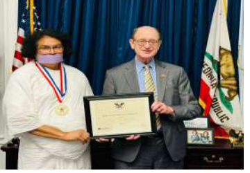
કાર્યની પ્રશંસા કરતાં તેમના હસ્તાક્ષરિત પ્રશસ્તિપત્રમાં જણાવ્યું હતું કે, "જાહેર કલ્યાણ માટેના તમારા યોગદાન માટે હું તમને અભિનંદન આપું છું અને આ મહાન રાષ્ટ્ર અને માનવતાની સેવા સ્વયંસેવક નેતૃત્વ માટે તમારી ઊંડી પ્રશંસા કરું છું અને અમેરિકન લોકોને વિશ્વાસ છે કે તમે ભવિષ્યમાં પણ આ જ રીતે માનવતાની સેવા કરવાનું ચાલુ રાખશો."

અમરેલી, તા. ૧૨ 'અહિંસા વિશ્વ ભારતી' અને 'વર્લ્ડ પીસ સેન્ટર'ના સ્થાપક જૈન આચાર્ય લોકેશજીને વોશિંગ્ટનમાં કેપિટોલ હિલ પર અમેરિકન રાષ્ટ્રપતિ એવોર્ડથી સન્માનિત કરવામાં આવ્યા હતા. સન્માનના ભાગરૂપે, તેમને રાષ્ટ્રપતિ પુરસ્કાર, ગોલ્ડન શિલ્ડ, સન્માનનું પ્રમાણપત્ર અને રાષ્ટ્રપતિ બિરોની હસ્તાક્ષર ધરાવતા પ્રશસ્તિપત્રથી સન્માનિત કરવામાં આવ્યા હતા. પ્રમાણપત્ર અને પ્રશસ્તિપત્ર વરિષ્ઠ કોંગ્રેસમેન બ્રેડ શેરમેને વાંચ્યું હતું. અમેરિકન રાષ્ટ્રપતિ પુરસ્કારથી સન્માનિત થનાર તેઓ પ્રથમ ભારતીય સાધુ છે. અમેરિકા રાષ્ટ્રપતિ જો બિડેને જૈન આચાર્ય લોકેશજીના માનવતાવાદી