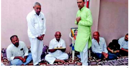
અર્પણ કરવામાં આવશે. એ પ્રમાણે છત્તીસગઢના દુર્ગ વિસ્તારમાં એક બસ દુર્ઘટનામાં ૧૫ લોકોનાં મોત થયાં હતાં તેમની વિગતો મેળવવામાં આવી રહી છે અને તેમના પરિવારજનોને પણ ૧૫,૦૦૦ લેખે કુલ મળીને રૂપિયા ૨,૨૫,૦૦૦ની સહાયતા રાશિ અર્પણ કરવામાં આવશે. રાજધાનીમાં માર્ગચૂંકાઓને કુલ મળીને રૂપિયા ૩,૭૫,૦૦૦ની સહાયતા અર્પણ કરવામાં આવી છે. પૂજ્ય મોરારીબાપુએ તમામ મૃતકોના નિવાજ માટે પ્રાર્થના કરી છે અને તેમના પરિવારજનોને દિવસોજી પાઠવી છે.

ભાવનગર, તા. ૧૨ બે દિવસ પહેલા ધોરાજીનો એક પરિવાર સામાજિક કારણોસર માડાસણ ગામે જઈ કારમાં પરત ધોરાજી તરફ આવી રહ્યો હતો ત્યારે કારનું ટાયર ફાટતાં કાર ભાદર નદીના પુલની રેલીંગ તોડી નીચે ખાબકી હતી. જોતજોતમાં કાર પાણીમાં ગરકાવ થઈ ગઈ હતી અને તેમાં સવાર પટેલ પરિવારના ચાર સભ્યો નાં મોત નિપજ્યા હતા. પૂજ્ય મોરારીબાપુએ તમામ મૃતકોના પરિવારજનોને પ્રત્યેકને રૂપિયા પંદર હજાર લેખે કુલ મળીને રૂપિયા ૬૦,૦૦૦ની સહાયતા રાશિ અર્પણ કરી છે જે ધોરાજી સ્થિત ભરતભાઈ દત્તા અને અન્યો દ્વારા વિતરીત કરવામાં આવી છે. હરિયાણામાં મહેન્દ્ર ગઢ ખાતે સ્કુલ બસ દુર્ઘટનામાં પ્રાપ્ત અહેવાલો અનુસાર ૬ બાળકોનાં કરુણ મોત નિપજ્યા છે. આ અકસ્માતની વિગતો મેળવવામાં આવી રહી છે અને દિલ્હી સ્થિત કમલકુમાર શર્મા અને તેમના સાથીઓ દ્વારા પ્રત્યેકને રૂપિયા પંદર હજાર લેખે કુલ મળીને રૂપિયા ૯૦,૦૦૦ની સહાયતા રાશિ