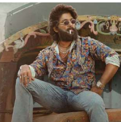
મુંબઈ, 'પુષ્પા' ફિલ્મ સાઉથના સુપર સ્ટાર અલ્લુ અર્જુનનો ગઈકાલે જન્મ દિવસ હતો. આ દિવસે તેની આગામી ફિલ્મ 'પુષ્પા-૨'ને ટિઝર પણ રીલીઝ થયું હતું. આ સાથે અલ્લુ અર્જુન ફિલ્મ ઈન્ડસ્ટ્રીમાં ૨૧ વર્ષ પુરા કર્યા છે. ફિલ્મી બેક ગ્રાઉન્ડમાંથી આવવા છતાં પરંપરાગત પથથી દૂર રહીને છેલ્લા બે દાયકામાં અનન્ય ભૂમિકાઓ ભજવીને સફળતા મેળવી છે.

મુંબઈ, 'પુષ્પા' ફિલ્મ સાઉથના સુપર સ્ટાર અલ્લુ અર્જુનનો ગઈકાલે જન્મ દિવસ હતો. આ દિવસે તેની આગામી ફિલ્મ 'પુષ્પા-૨'ને ટિઝર પણ રીલીઝ થયું હતું. આ સાથે અલ્લુ અર્જુન ફિલ્મ ઈન્ડસ્ટ્રીમાં ૨૧ વર્ષ પુરા કર્યા છે. ફિલ્મી બેક ગ્રાઉન્ડમાંથી આવવા છતાં પરંપરાગત પથથી દૂર રહીને છેલ્લા બે દાયકામાં અનન્ય ભૂમિકાઓ ભજવીને સફળતા મેળવી છે. અલ્લુની ફિલ્મ ઈન્ડસ્ટ્રીમાં એક ડાન્સ