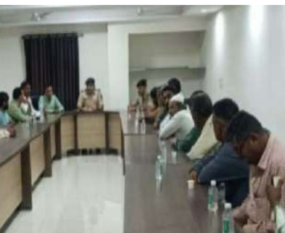
હદમાં રહેતા હિન્દુ-મુસ્લીમ સમાજના આગેવાનો સાથે ચેટીયાંદ, ઈદ, ડો.બાબાસાહેબ આંબેડકર જયંતિ, રામ નવમી વિગેરે તહેવાર અનુસંધાને શાંતિ જળવાઈ રહે અને કોમી એકતા જળવાય રહે તે હેતુથી બી ડીવીઝન પોલીસ સ્ટેશન ખાતે મીટીંગનું આયોજન કરવામાં આવેલ. જેમાં સમાજના આગેવાનો