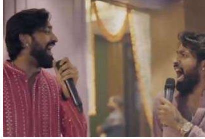
મુંબઈ, સોશિયલ મીડિયા પર એક વીડિયો વાયરલ થઈ રહ્યો છે. જેમાં જોઈ શકાય છે કે પંડ્યા બ્રધર્સ સાથે મળીને ભજન ગાતા જોવા મળી રહ્યા છે. વીડિયો

જોયા બાદ એવું લાગી રહ્યું છે કે બંને ભાઈ ભક્તિના રંગમાં રંગાયા છે. બંનેએ શાનદાર કુર્તા પહેર્યા છે. સોશિયલ મીડિયા પર આ વીડિયો વાયરલ થયો છે. હાર્દિક પંડ્યા ભજન પર ઝૂમતા નજરે પડી રહ્યા છે. બંને ભાઈ હાથ મિલાવીને 'હરે રામા હરે કિષ્ના' ભજન ગાઈ રહ્યા છે. જોવામાં આવે તો જ્યારે હાર્દિક પંડ્યા મુંબઈ ઈન્ડિયન્સના કેપ્ટન બન્યા છે, ત્યારથી તેની મુશ્કેલીઓ ઓછી નથી થઈ રહી. સ્ટેડિયમ અને સોશિયલ મીડિયા પર ફેન્સ તેમને ટ્રોલ કરતા નજરે આવી રહ્યા છે. તેવામાં આ વીડિયો વાયરલ થયો છે. આ પહેલા પણ હાર્દિક પંડ્યાનો એક વીડિયો વાયરલ થયો હતો.