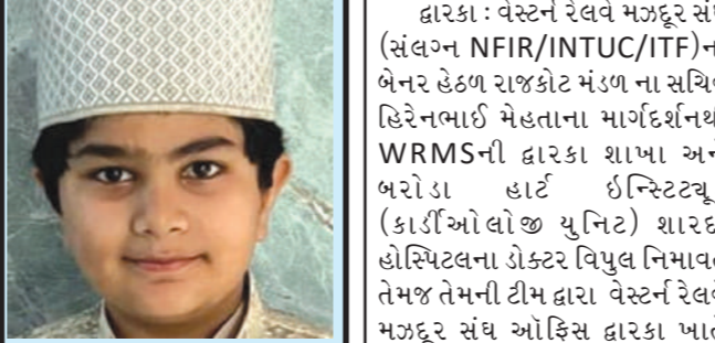
જામનગર શહેરના ખોજ નાકા બહાર વિસ્તારમાં રહેતા મુસાણી પરિવારનો માત્ર ૧૦ વર્ષનો લાડલો ટીકરો દ્વારા રમજાન માસ દરમ્યાન પુરા ૩૦ રોજા રાખી એક ખરો અર્થમાં અલ્લાહ ની ઈબાદત કરી હતી. હાલ રમજાન માસ ચાલી રહ્યો છે. મુસ્લિમ સમાજ ના વડીલો, યુવાનો તેમજ બાળકો અલ્લાહની બંદગી કરી રહ્યા છે. ત્યારે વડીલોને જોઈ જવાદ શબ્દોથી મુસાણી દ્વારા પોતાના જીવનમાં પ્રથમવાર અંદાજિત ૧૪ કલાક સુલૂખ ભુખ્યા તરસ્યાં રહી ૩૦ રોજા પુરા રાખ્યા હતા. આ માસુમ બાળકીએ પુરા મહિના રોજા રાખીને મોટા લોકો જે રોજું નથી રાખતા અને પ્રેરણા મળે તેવું કાર્ય કરી બતાવ્યું છે.