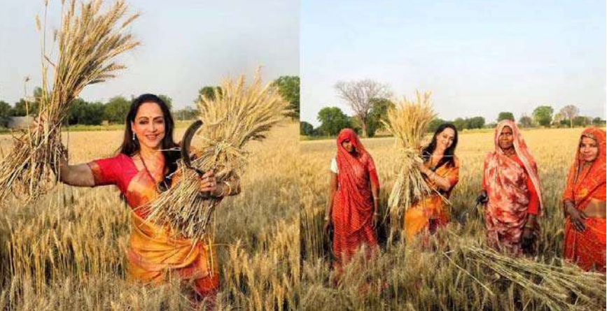
મથુરામાં બીજેપી ઉમેદવાર અને સાંસદ હેમા માલિની ઘઉંની કાપણી કરતી મહિલાઓને મળવા પહોંચી હતી. હેમા માલિનીએ મહિલાઓ સાથે ઘઉંની કાપણી પણ કરી હતી. ઘઉં કાપવાનો વીડિયો સોશિયલ મીડિયા પર વાયરલ થઈ રહ્યો છે.