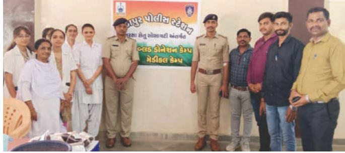
કેમ્પમાં કુલ ૭૨ જેટલી બ્લડની બોટલ માટે એકત્રિત કરવામાં આવી હતી તેમજ અત્રેના પોલીસ અધિકારીઓ, કર્મચારીઓ, જી.આર.ડી., પોલીસ પરિવારના સભ્યોનું મેડીકલ ચેકઅપ પણ કરવામાં આવેલ.

જામનગર : આજરોજ મીઠાપુર પોલીસ સ્ટેશન વિસ્તારમાં સુરક્ષા સેતુ સોસાયટી અંતર્ગત મીઠાપુર પોલીસ અધિકારી તથા કર્મચારીઓ તેમજ જનરલ હોસ્પિટલ બ્લડ બેંક ખંભાળીયા તથા પી.એચ.સી. સુરજકરાડી મેડીકલ સ્ટાફના સહયોગથી બ્લડ ડોનેશન કેમ્પ તેમજ મેડીકલ ચેકઅપ કેમ્પનું આયોજન કરવામાં આવેલ. આ બ્લડ ડોનેશન