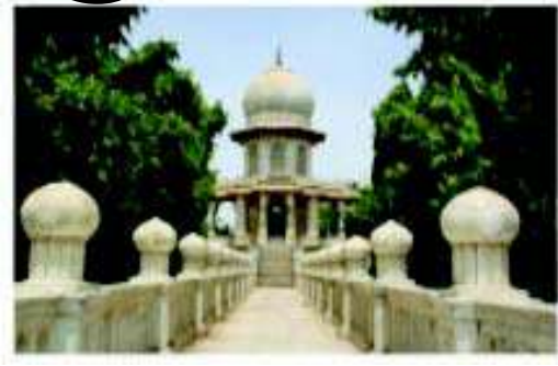
મહાન રાજવીના કાર્યોનું મૂલ્યાંકન :

તપ્તસિંહજીએ રાજા તરીકે ઇ.સ.૧૯૮૮માં પૂર્ણ સત્તા સંભાળ્યા પછી સ્ટેટ કાઉન્સિલની રચના કરેલ તેમાં ચાર સભ્યોની નિમણૂક કરી હતી. દરેક સભ્ય હસ્તક એક-એક વિભાગ રખાયો હતો. (૧) વડા દીવાન-રાજકીય અને મહેસૂલી વિભાગ (૨) વડા-વ્યુડિસિયલ કાઉન્સિલર, પોલીસ અને ન્યાય વિભાગ (૩) વડા નાણાકીય કાઉન્સિલર, નાણા વિભાગ (૪) વડા સંયુક્ત રીતે સ્ટેટ ઇજનેર અને જાહેર બાંધકામ કાઉન્સિલર-જાહેર બાંધકામ. આ પ્રકારની વહીવટી કાર્યવહારીને મુંબઈના તે વખતના ગવર્નર જેની અનુમતિ હતી. વહિવટી તંત્રમાં કારોબારી અને ન્યાય તંત્રનું સત્તા વિભાજન કરાયું હતું. અગત્યનો અને નોંધપાત્ર સુધારો સૌરાષ્ટ્ર ભરમાં કદાચ પ્રથમ પ્રયાસ હતો. પ્રથમ કાઉન્સિલરના એક કાઉન્સિલર સર એમ.એમ. ભાવનગરી નિવૃત્ત થયા પછી તુરંત જ બ્રિટિશ સંસદના સભ્ય બન્યા હતા. ઇ.સ. ૧૯૮૮થી દરેક ખાતાના મુખ્ય જવાબદાર અધિકારીની જગ્યા ઉપર આધુનિક અંગ્રેજી કેળવણી પામેલાની નિમણૂકો થવાવાગી હતી. આ રીતે વહીવટી તંત્રમાં પરીવર્તન ઢારા આધુનિકરણે પ્રવેશ કર્યો હતો. વેલપ્રથા અને નવજરાણાની પ્રથા નાબૂદ કરવામાં આવી હતી, લગ્નની ઉંમર માટેનો કાયદો બનાવવામાં આવ્યો હતો. કર્ચદાર ગરાસિયાઓ અને ભાયાતો માટે ઉલ્કર્ષની ચોજના બનાવવામાં આવી હતી. ઇ.સ. ૧૯૮૮માં અનાવૃષ્ટિ થતાં ગરીબોને રાહત માટે 'ગરીબખાનું' શરૂ કરવામાં આવ્યું હતું. સિંઈની સવારો અને અંગરક્ષકોની ટુકડી વિખેરી નાખી તેમાંના સદામ વ્યક્તિઓને આધુનિક લશ્કરી તાલીમ આપી, વેલ્સર્સની ટુકડી ઊભી કરી તેના કમાન્ડિંગ ઓફિસર તરીકે મુરદાસલીની નિમણૂક કરવામાં આવી હતી. તાલીમ પામેલ પાયદળ (હેક્ટરહિમ)ની ટુકડી તૈયાર કરવામાં આવી હતી.