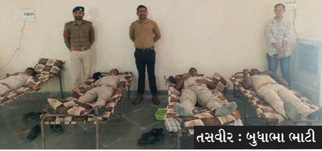
તસવીર : બુધાભા ભાટી