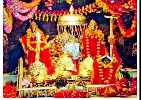
૨૨ હજાર અને સાંજે ૬ વાગ્યા સુધીમાં લગભગ ૨૮ હજાર ૫૦૦ ભક્તોએ નોંધણી કરાવી હતી. જોકે, રૂમ બંધ થવામાં હજુ બે કલાક બાકી હતા.

કર્ટા, ચૈત્ર નવરાત્રિના કારણે માતા વૈષ્ણોદેવીના દરબારમાં દરરોજ ભક્તિનો પૂર જોવા મળે છે. માતાજીના દર્શન કરવા દેશ-વિદેશથી લોકો આવી રહ્યા છે. નવરાત્રિના ત્રણ દિવસમાં એક લાખથી વધુ ભક્તોએ દરબારમાં માથું ટેકવું હતું. ધર્મનગરી ભક્તોથી ગુંજી રહી છે. સર્વત્ર ભક્તિમય વાતાવરણ છે. દરેક જગ્યાએ માતાના ગુણગાન સંભળાય છે. ગુરુવારે સાંજે ૬ વાગ્યા સુધીમાં, લગભગ ૨૮,૫૦૦ ભક્તો માતાની સ્તુતિ કરીને ઈમારત તરફ આગળ વધ્યા હતા. શનિવાર અને રવિવારે ભક્તોની સંખ્યામાં વધારો થવાની સંભાવના છે. નોંધણી પંડના જણાવ્યા અનુસાર ગુરુવારે બપોરે ૧૨ વાગ્યા સુધીમાં ૧૪ હજાર, ૪ વાગ્યા સુધીમાં