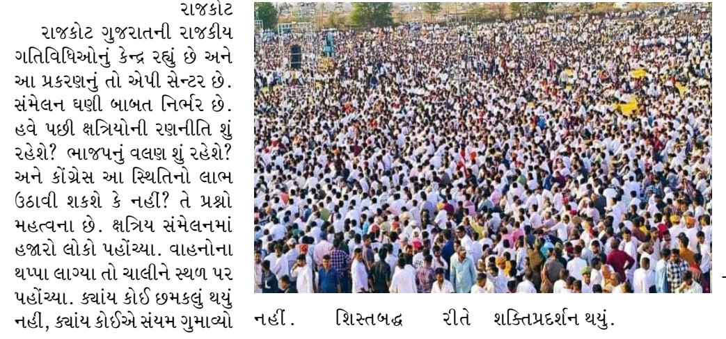
રાજકોટ ગતિવિધિઓનું કેન્દ્ર રહ્યું છે અને આ પ્રકરણનું તો એપી સેન્ટર છે. સંમેલન ઘણી બાબત નિર્ભર છે. હવે પછી ક્ષત્રિયોની રક્ષાનીતિ શું રહેશે? ભાજપનું વલણ શું રહેશે? અને કોંગ્રેસ આ સ્થિતિનો લાભ ઉઠાવી શકશે કે નહીં? તે પ્રશ્નો મહત્વના છે. ક્ષત્રિય સંમેલનમાં હજારો લોકો પહોંચ્યા. વાહનોના થપ્પા લાગ્યા તો ચાલીને સ્થળ પર પહોંચ્યા. ક્યાંય કોઈ ઇમકલું થયું નહીં. ક્યાંય કોઈએ સંયમ ગુમાવ્યો નહીં. શિસ્તબદ્ધ રીતે શક્તિપ્રદર્શન થયું.