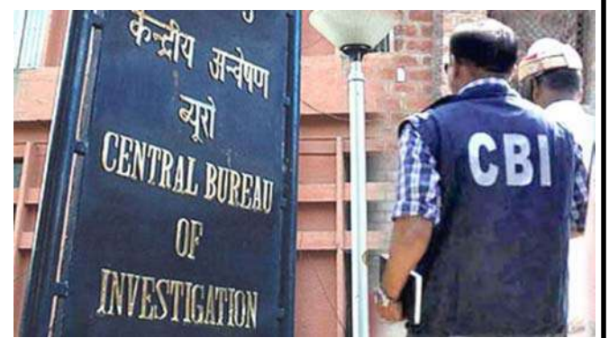
પ્લાન્ટના આઈ અધિકારિયો સહિત મેઘા એન્જિનયરિંગ એન્ડ ઇન્ફ્રાસ્ટ્રક્ચર લિમિટેડની સામે કેસ નોંધવામાં આવ્યો છે. તમને જણાવી દઈએ કે હાલમાં ચૂંટણી બોન્ડને લઈને મેઘા એન્જિનયરિંગ ઇન્ફ્રાસ્ટ્રક્ચર લિમિટેડ પૂબ ચર્ચામાં રહ્યું છે. હેદરાબાદની કંપની એન્જિનયરિંગ એન્ડ ઇન્ફ્રાસ્ટ્રક્ચર ચૂંટણી બોન્ડ દ્વારા રાજકીય પક્ષોને દાન આપનારી બીજી સૌથી મોટી કંપની છે.

નવીદિલ્હી, સ્ટીલ મંત્રાલય તથા મેઘા એન્જિનયરિંગ ઇન્ફ્રાસ્ટ્રક્ચર લિમિટેડના અધિકારિયો પર ૩૧૫ કરોડ રૂપિયાની એનઆઈએસપી પરિયોજનામાં કથિક ભ્રષ્ટાચારને લઈને કેસ નોંધવામાં આવ્યો છે. સીબીઆઈએ આ જાણકારી આપી હતી. તપાસ એજન્સીએ જણાવ્યું છે કે ૩૧૫ કરોડ રૂપિયાની પરિયોજનાના અમલકરણમાં ભ્રષ્ટાચારને લઈ સ્ટીલ મંત્રાલયના એનએમીસીસી આયન એન્ડ સ્ટીલ