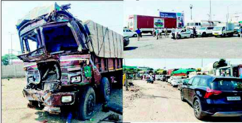
શકતાં હેરાન થયેલા વાહનચાલકોમાં ભારે દેકારો મચી ગયો હતો અને તંત્રવાહકો પર ઉકળાટ ઠાલવ્યો હતો. આ જામમાં ફસાઈ જવાને કારણે અનેક લોકોના ટાઈમટેબલ ખોરવાઈ ગયા હતાં.

રાતે શરૂ થયેલી ટ્રક હટાવવાની કામગીરી છેક સવાર સુધી ચાલી : અનેક વાહન ચાલકો ટ્રાફિકમાં ફસાયા