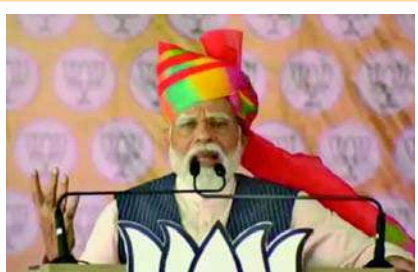
ભાજપા સરકારને મળ્યું છે. જે સન્માન કોંગ્રેસ પાર્ટીએ ક્યારેય આપ્યું નથી. તે સન્માન કરવાનું સૌભાગ્ય અમને મળ્યું. કોંગ્રેસ જેવી પાર્ટીઓએ

મધ્યપ્રદેશ, મધ્યપ્રદેશમાં ચાર તબક્કામાં લોકસભાની ચૂંટણી યોજવાની છે. રાજકીય પક્ષોએ પ્રથમ તબક્કાની સાથે બીજા તબક્કાની બેઠકો પર ચૂંટણી પ્રચાર તેજ કર્યો છે. પીએમ નરેન્દ્ર મોદી રવિવારે બીજા તબક્કાની હોશંગાબાદ બેઠકના પિપરિયામાં જનસભાને સંબોધિત કરી રહ્યા છે. પીએમ મોદીએ બાબા સાહેબને યાદ કરત કહ્યું કે મહુમાં તેમનું ઘર છે. જે અહીંથી નજીક છે. તેઓ દેશ વિદેશમાં જ્યાં પણ રહ્યા તે સ્થાનોને પંચ તીર્થના રૂપમાં વિકસિત કરવાનું સૌભાગ્ય