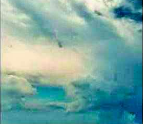
૩૦.૮ ડિગ્રીએ આવી ગયો હતો. સોરઠેનાં મહત્તમ તાપમાનમાં ઘટાડો નોંધાયો છે ત્યારે જૂનાગઢ કળષિ યુનિવર્સિટીને હવામાન વિભાગના સૂત્રોએ જણાવ્યું હતું કે, જૂનાગઢ, ગીર સોમનાથ, પોરબંદર જિલ્લામાં તા. ૧૩ થી ૧૭ એપ્રિલ પ દિવસ દરમિયાન મુખ્યત્વે આકાશ ચોખ્ખું થી અંશત વાદળાચું રહેશે.

રાજકોટ, રાજકોટ સહિત સૌરાષ્ટ્ર-કચ્છમાં માવઠાની આગાહી કરવામાં આવી છે. ત્યારે આજે સવારે પવનના સૂસવાટા હુકાયા હતા અને આછા વાદળા છવાઈ ગયા હતા. સર્વત્ર મહત્તમ તાપમાનનો પારો ઉંચે ચડતા ગરમી યથાવત રહી છે.