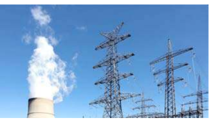
દિશાનિર્દેશો જારી કર્યા છે (જે અંતર્ગત સરકાર તે નિર્દેશ કરી શકે છે કે એક ઉત્પાદન કંપની,

નવીદિલ્હી, ઉનાળાની ઋતુમાં દેશમાં વીજળીની ઊંચી માગને પહોંચી વળવા માટે ભારત સરકારે ગેસ આધારિત પાવર પ્લાન્ટ્સ કાર્યરત કરવાનો નિર્ણય લીધો છે. ગેસ-આધારિત જનરેટિંગ સ્ટેશનોમાંથી મહત્તમ વીજ ઉત્પાદન સુનિશ્ચિત કરવા માટે સરકારે તમામ ગેસ-આધારિત જનરેટિંગ સ્ટેશનોને ઇલેક્ટ્રિસિટી એક્ટ, ૨૦૦૩ની કલમ ૧૧ હેઠળ