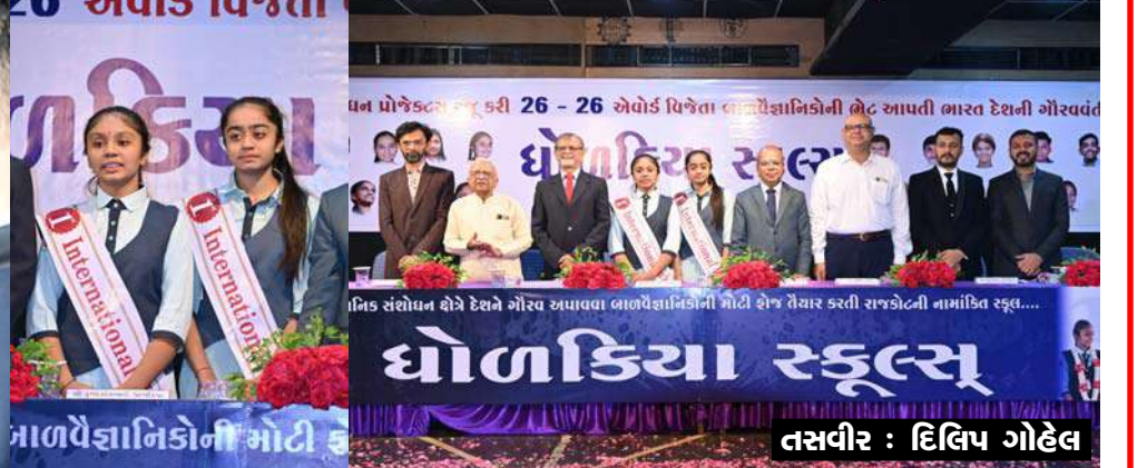
મોનીટરીંગ પ્રોજેક્ટ રજૂ કર્યો હતો. આ દુર્ઘટના બાદ બંને છાત્રાએ મોડેલ તૈયાર કર્યું હતું અને વેઈટ બેલેન્સ તેમજ ડિઝાઇન કાઉન્ટર સર્કિટ ગોઠવી હતી. વજન વધે એટલે બેરીંગેટ બંધ થઈ જાય અને સાયરન વાગે તેવી ટેકનીક ગોઠવવામાં આવી હતી. આ પ્રોજેક્ટ આંતરરાષ્ટ્રીય વિજ્ઞાન મેળા માટે પસંદ થતા બંને વિદ્યાર્થીનીઓએ પ્રોટોટાઇપ મોડેલ તૈયાર કરવા ખુબ મહેનત લીધી