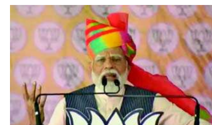
ભાજપા સરકારને મળ્યું છે. જે સન્માન કોંગ્રેસ પાર્ટીએ ક્યારેય આપ્યું નથી. તે સન્માન કરવાનું સૌભાગ્ય અમને મળ્યું. કોંગ્રેસ જેવી પાર્ટીઓએ

મધ્યપ્રદેશ, મધ્યપ્રદેશમાં ચાર તબક્કામાં લોકસભાની ચૂંટણી યોજવાની છે. રાજકીય પક્ષોએ પ્રથમ તબક્કાની સાથે બીજા તબક્કાની બેઠકો પર ચૂંટણી પ્રચાર તેજ કર્યો છે. પીએમ નરેન્દ્ર મોદી રવિવારે બીજા તબક્કાની હોશંગાબાદ બેઠકના પિપરિયામાં જનસભાને સંબોધિત કરી રહ્યા છે. પીએમ મોદીએ બાબા સાહેબને યાદ કરત કહ્યું કે મહુમાં તેમનું ઘર છે. જે અહીંથી નજીક છે. તેઓ દેશ વિદેશમાં જ્યાં પણ રહ્યા તે સ્થાનોને પંચ તીર્થના રૂપમાં વિકસિત કરવાનું સૌભાગ્ય