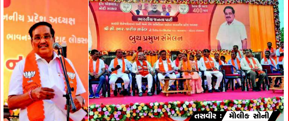
તસવીર : મોલીક સોની