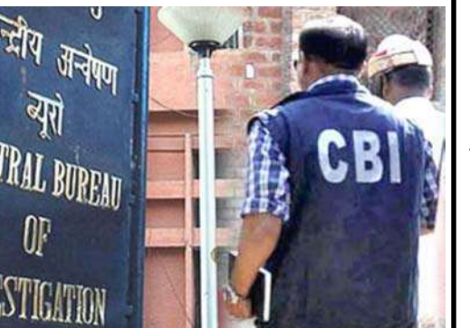
પ્લાન્ટના આઈ અધિકારિઓ સહિત મેઘા એન્જિનયરિંગ એન્ડ ઇન્ફ્રાસ્ટ્રક્ચર લિમિટેડના સામે કેસ નોંધવામાં આવ્યો છે. તમને જણાવી દઈએ કે હાલમાં ચૂંટણી બોન્ડને લઈને મેઘા એન્જિનયરિંગ ઇન્ફ્રાસ્ટ્રક્ચર લિમિટેડ પૂબ ચર્ચામાં રહ્યું છે. હેદરાબાદની કંપની એન્જિનયરિંગ એન્ડ ઇન્ફ્રાસ્ટ્રક્ચર ચૂંટણી બોન્ડ દ્વારા રાજકીય પક્ષોને દાન આપનારી બીજી સૌથી મોટી કંપની છે.

નવીદિલ્હી, સ્ટીલ મંત્રાલય તથા મેઘા એન્જિનયરિંગ ઇન્ફ્રાસ્ટ્રક્ચર લિમિટેડના અધિકારિયો પર ૩૧૫ કરોડ રૂપિયાની એનઆઈએસપી પરિયોજનામાં કથિક ભ્રષ્ટાચારને લઈને કેસ નોંધવામાં આવ્યો છે. સીબીઆઈએ આ જાણકારી આપી હતી. તપાસ એજન્સીએ જણાવ્યું છે કે ૩૧૫ કરોડ રૂપિયાની પરિયોજનાના અમલકરણમાં ભ્રષ્ટાચારને લઈ સ્ટીલ મંત્રાલયના એનએમીસી આયન એન્ડ સ્ટીલ