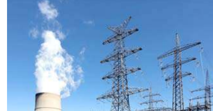
દિશાનિર્દેશો જારી કર્યા છે (જે અંતર્ગત સરકાર તે નિર્દેશ કરી શકે છે કે એક ઉત્પાદન કંપની,

નવીદિલ્હી, ઉનાળાની ઋતુમાં દેશમાં વીજળીની ઊંચી માગને પહોંચી વળવા માટે ભારત સરકારે ગેસ આધારિત પાવર પ્લાન્ટ્સ કાર્યરત કરવાનો નિર્ણય લીધો છે. ગેસ-આધારિત જનરેટિંગ સ્ટેશનોમાંથી મહત્તમ વીજ ઉત્પાદન સુનિશ્ચિત કરવા માટે સરકારે તમામ ગેસ-આધારિત જનરેટિંગ સ્ટેશનોને ઇલેક્ટ્રિસિટી એક્ટ, ૨૦૦૩ની કલમ ૧૧ હેઠળ