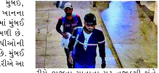
ટીમે ભુજના માતાના મઠ નજીકથી બંને આરોપીની ધરપકડ કરી છે. આરોપીઓની

મુંબઈ, બોલિવૂડ એક્ટર સલમાન ખાનના ઘરની બહાર થયેલા ફાયરિંગ કેસમાં મુંબઈ ક્રાઈમ બ્રાન્ચને મોટી સફળતા મળી છે. પોલીસે ફાયરિંગના બંને આરોપીઓની ગુજરાતના ભુજમાંથી ધરપકડ કરી છે. મુંબઈ ક્રાઈમ બ્રાન્ચના એક વરિષ્ઠ અધિકારીએ આ કાર્યવાહીની સ્પષ્ટતા કરી છે. મળતી માહિતી મુજબ ક્રાઈમ બ્રાન્ચની