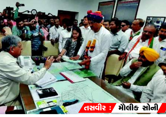
ભગવત માન પાસે ઉપસ્થિત રહ્યા હતાં.