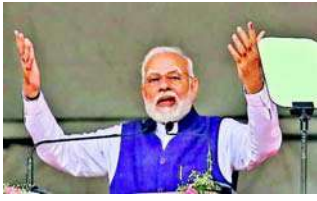
સનાતન મુદ્દે કોંગ્રેસ પર નિશાન સાધતા કહ્યું હતું કે, કોંગ્રેસની માનસિકતામાં કેવા પ્રકારની વિકૃતિ છે. વન નેશન વન ઈલેક્શન પર વડાપ્રધાન મોદીએ

જેમાં પણ આપણે બે વર્ષ સુધી કોવિડ સામે લડ્યા છતાં કામની સ્પીડ કહો અને સ્ટેલ કહો. ડીએમકેની તાજેતરની સનાતન વિરોધી ટિપ્પણી અને તેમના પર લોકોના ગુસ્સા પર વડા પ્રધાન નરેન્દ્ર મોદીએ કહ્યું હતું કે, કોંગ્રેસને પૂછવું જોઈએ કે સનાતન વિરુદ્ધ આટલું ઝેર ફૂંકનારા લોકો સાથે બેસવાની તેમની શું મજબૂરી છે? પ્રધાનમંત્રી નરેન્દ્ર મોદીએ