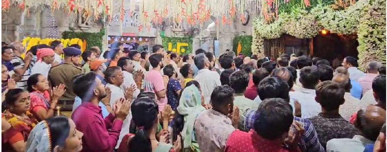
ચૈત્રી આઠમને પગલે પાવાગઢ, અંબાજી, બહુચરાજી, ચોટીલા સહિતના માઈ મંદિરોમાં ભક્તોનો મહાસાગર ઉમટ્યો છે. આજ વહેલી સવારથી જ માઈ ભક્તો માંના દરબારમાં જતા જોવા મળ્યા. આ તરફ માં નર્મદાની ઉત્તરવાહિની પંચકોશી પરિક્રમાના પહેલા રવિવારે ૫૦ હજારથી વધુ પરિક્રમાવાસીઓ ઉમટ્યા.