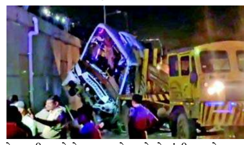
કે ચાલીસ લોકો ઘાયલ છે અને તેમાંથી ૩૦ને કટક એસસીબી મેડિકલ કોલેજમાં લઈ જવામાં આવ્યા છે.

જાજપુર, ઓડિશાના જાજપુર જિલ્લામાં ગઈરહેતે અકસ્માત સર્જાયો હતો. કોલકાતા જતી બસ પુલ પરથી નીચે ખાબકી હતી. આ અકસ્માતમાં એક મહિલા સહિત પાંચ લોકોના મોત થયા હતા અને ૪૦ ઘાયલ થયા હતા. પોલીસના જણાવ્યા અનુસાર, નેશનલ હાઈવે-૧૬ પર ભારાબતી પુલ પર રાત્રે ૯ વાગ્યે આ અકસ્માત થયો હતો. બસમાં ૫૦ મુસાફરો હતા અને બસ પુરીથી કોલકાતા જઈ રહી હતી. આ અકસ્માતમાં ચાર પુરૂષ અને એક મહિલાના મોત થયા છે. પોલીસે જણાવ્યું