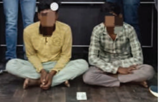
લાખની માલમતા કબજે કરી છે.

જામનગર : જામનગરમાં ગોકુલ નગર નજીક રામનગર શેરી નંબર પાંચમાં રહેતા અને નિવૃત્ત જીવન જીવતા એક બુઝુર્ગની ચાલુ રિક્ષામાં રૂપિયા ૧.૬૦ની સોનાની કંઠી સેરવી લેવાઈ હતી જે ચોરીનો ભેદ પોલીસે ગણતરીના કલાકોમાં જ ઉકેલી નાખ્યો છે, અને બે રીક્ષા ચાલક તસ્કરોને ઝડપી લઈ તેઓ પાસેથી ચોરી કરેલ કંઠી અને રીક્ષા કબજે કરી છે.