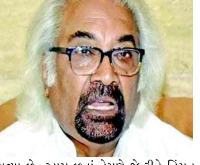
આવ્યા છે. આમ છતાં તેમણે જે રીતે હિંમત અને હિંમત બતાવી અને આગળ વધ્યા તે પ્રશંસનીય છે. સામ પિત્રોડાએ કહ્યું કે લોકો રાહુલ ગાંધીને પસંદ કરી રહ્યા છે અને તેમને

નવીદિલ્હી, કોંગ્રેસના નેતા અને ઈન્ડિયન ઓવરસીઝ કોંગ્રેસના પ્રમુખ સામ પિત્રોડા જેઓ પોતાના નિવેદનોને કારણે અવારનવાર ચર્ચામાં રહે છે, તેમણે આગામી ચૂંટણીમાં રાહુલ ગાંધીની ભૂમિકા અને ઈન્ડિયા એલાયન્સના કામને લઈને નિવેદન આપ્યું છે. તેમનું કહેવું છે કે રાહુલ ગાંધી તેમના માટે ખૂબ જ ખાસ વ્યક્તિ છે. તે એક શિક્ષિત યુવાન અને મહેનતુ માનવ વ્યક્તિ છે. એક ઈન્ટરવ્યુમાં પિત્રોડાએ રાહુલ ગાંધીના ખૂબ વખાણ કર્યા હતા. પિત્રોડાનું કહેવું છે કે રાહુલ ગાંધી પર લાંબા સમયથી સતત શબ્દિક પ્રહારો થઈ રહ્યા છે, તેમને દાયકાઓથી નિશાન બનાવવામાં