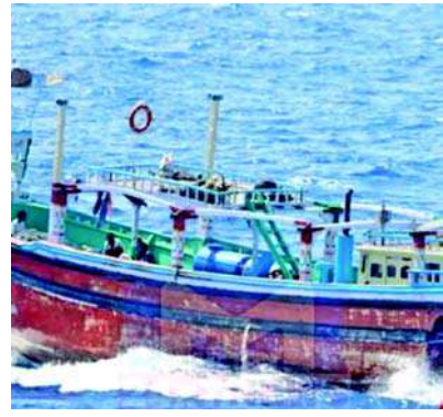
દરિયાઈ પેટ્રોલિંગ દરમિયાન, 'ધો' (સ્યોશિયલ ૮૪૦૦) પર હુમલો કર્યો હતો.

હર્શિશ અને ૭૧ કિલો હેરોઈનનો સમાવેશ થાય છે. CMF એ ૪૨ દેશોની નૌકાદળ ભાગીદારી છે જેનો ઉદ્દેશ સમુદ્રમાં સુરક્ષા અને સ્થિરતાને પ્રોત્સાહન આપીને આંતરરાષ્ટ્રીય નિયમો-આધારિત વ્યવસ્થા જાળવવાનો છે. ભારતીય નૌકાદળ ગયા નવેમ્બરમાં સીએમએફમાં જોડાયું હતું. નૌકાદળના પ્રવક્તાએ જણાવ્યું હતું કે ભારતીય નૌકાદળના માર્કો કમાન્ડોએ પશ્ચિમ અરબી સમુદ્રમાં દરિયાઈ સુરક્ષા કામગીરી માટે તૈનાત ભારતીય નૌકાદળના જહાજ INS તલવાર પર તૈનાત, ૧૩ એપ્રિલે, ઓપરેશન 'ફિસમ બેરાકુડા' હેઠળ