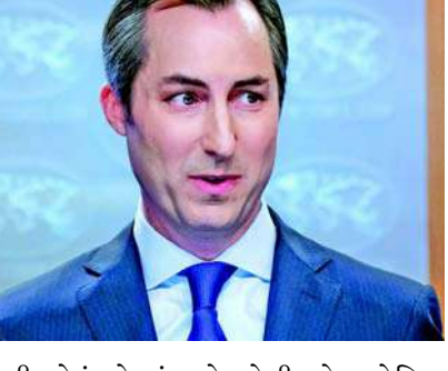
સૌથી મોટું લોકતંત્ર છે. તેથી, તે અમેરિકા માટે એક મહત્વપૂર્ણ વ્યૂહાત્મક ભાગીદાર છે અને મને આશા છે કે ભવિષ્યમાં પણ તે આવું જ રહેશે. જ્યારે સવાલ એ ઊભો થયો કે શું વિદેશ વિભાગ ભારતીય વિપક્ષી નેતા અરવિંદ

વોશિંગ્ટન, અમેરિકામાં રાષ્ટ્રપતિ જો બાઇડેન પ્રશાસન માને છે કે ભારત અમેરિકાનું મહત્વપૂર્ણ વ્યૂહાત્મક ભાગીદાર છે. યુએસ સ્ટેટ ડિપાર્ટમેન્ટના પ્રવક્તા મેથ્યુ મિલરે કહ્યું કે સંબંધોમાં કોઈ અણધાર્યા ફેરફારની અપેક્ષા નથી. મિલર વિદેશ વિભાગના તાજેતરના નિવેદનો તેમજ ભારતમાં લોકસભાની ચૂંટણી પહેલા યુએસમાં પ્રકાશિત થયેલા ભારત સરકારની ટીકા કરતા કેટલાક લેખો સંબંધિત પ્રશ્નોના જવાબ આપી રહ્યા હતા. આ સમયાગા દરમિયાન તેમણે ભારત સાથે અમેરિકાના સંબંધોને પુનઃ સમર્થન આપ્યું હતું. તેમણે કહ્યું કે ભારત અમેરિકાનું મહત્વપૂર્ણ વ્યૂહાત્મક ભાગીદાર છે. તેમણે પ્રેસ બ્રીફિંગ દરમિયાન કહ્યું, 'ભારત વિશ્વનું