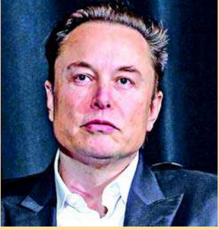
કંપનીની પોલીસીનું સતત ઉલ્લંઘન કરી રહ્યા હતા. કેટલીય વાર ચેતવણી આપવા છતાં તેમણે કંપનીની પોલીસીને નજરઅંદાજ કરવામાં આવી હતી.

નવીદિલ્હી, એલન મસ્કની ભારત યાત્રાને લઈને ઘણા સમાચાર સામે આવ્યા છે. એક્સ ટેક ઓવર કર્યા બાદ એલન મસ્કની એક્સ કંપનીએ ભારતમાં અંદાજે ૨.૧૩ લાખ એકાઉન્ટ પર બાન લગાવ્યો છે. આ ફેસલો કંપનીની પોલીસીને ધ્યાનમાં લઈને લેવાયો છે. જેને કારણે તમામ લોકોને સતર્ક રહેવાની જરૂર છે. એક્સ તરફથી માહિતી આપવામાં આવી છે કે આ એકાઉન્ટને બાન કરવાની નિર્ણય લેવાયો છે. કારણકે તે