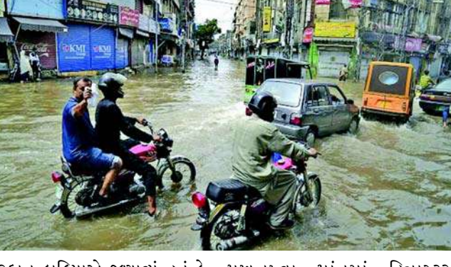
અરફાન કાઠિયાએ જણાવ્યું હતું કે પંજાબમાં ૨૧ લોકોના મોત થયા છે, જ્યાં આ અઠવાલિયે વધુ વરસાદની અપેક્ષા છે. અફઘાનિસ્તાનની સરહદે આવેલા ઉત્તર-પશ્ચિમ ખેબર

પાકિસ્તાન, સમગ્ર પાકિસ્તાનમાં ત્રણ દિવસ સુધી સતત ભારે વરસાદ અને વીજળી પડવાને કારણે ઓછામાં ઓછા ૪૯ લોકોના મોત થયા છે, અધિકારીઓએ સોમવારે જણાવ્યું હતું કે, મુશળધાર વરસાદને કારણે અધિકારીઓએ દેશના દક્ષિણ-પશ્ચિમમાં કટોકટીની સ્થિતિ જાહેર કરવાની સૂચના આપી છે. જ્યારે તેઓ ઘઉંની કાપણી કરી રહ્યા હતા ત્યારે વીજળી પડતાં કેટલાક ખેડૂતો મૃત્યુ પામ્યા હતા અને વરસાદને કારણે ઉત્તર પશ્ચિમ અને પૂર્વ પંજાબ પ્રાંતમાં ડઝનેક મકાનો ધરાશાયી થયા હતા. પ્રાંતીય ડિઝાસ્ટર મેનેજમેન્ટ ઓથોરિટીના પ્રવક્તા