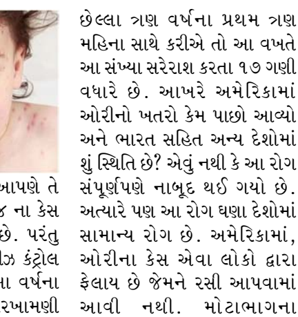
કેસ નોંધાયા હતા. જો આપણે તે મુજબ જોઈએ તો ૨૦૨૪ ના કેસ તુલનાત્મક રીતે ઓછા છે. પરંતુ યુએસ સેન્ટર ઓફ ડિસીઝ કંટ્રોલ અનુસાર, જો આપણે આ વર્ષના પ્રથમ ત્રણ મહિનાની સરખામણી

માટે ચિંતાનું કારણ બની ગયું છે. હકીકતમાં, ઓરી ફરી એકવાર અમેરિકામાં પાછી આવી છે. ડેટા અનુસાર, ૨૦૨૪માં ૩ એપ્રિલ સુધી કુલ ૧૧૩ કેસ નોંધાયા છે. અમેરિકા મુશ્કેલીમાં છે કારણ કે વર્ષ ૨૦૦૦માં અહીં ઓરી નાબૂદ થઈ હતી. તે પછી કેટલાક મામલાઓ સામે આવ્યા પરંતુ યુએસ દરેક વખતે તેનો સામનો કરવામાં સફળ રહ્યું. પછી વર્ષ ૨૦૧૯ આવ્યું જ્યારે ઓરીએ ૨૫ વર્ષમાં સૌથી ઘનીર સ્વરૂપ લીધું. તે વર્ષે ૧૨૭૪