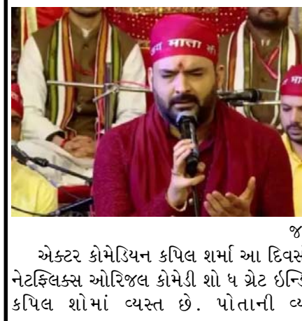
જમ્મુ, એક્ટર કોમેડિયન કપિલ શર્મા આ દિવસોમાં નેટફ્લિક્સ ઓરિજલ કોમેડી શો ૬ ગ્રેટ ઈન્ડિયન કપિલ શર્મા વ્યસ્ત છે. પોતાની વ્યસ્ત

શેઝુઅલમાંથી સમય નીકાળીને એક દિવસ પહેલાં જમ્મુ સ્થિત માતા વૈષ્ણોદેવી મંદિર પહોંચ્યા હતા. કપિલની સાથે પત્ની અને બાળકો પણ હતા. જમ્મુતી કપિલની તસવીરો અને વિડીયો સામે આવી રહ્યા છે. શ્રી માતા વૈષ્ણોદેવીની આરાધના કરતા જોઈ શકાય છે. આ સાથે માતા રાનીની આરાધના કરતા જોઈ શકાય છે. કપિલ માતા રાનીના ગીત ગાઈ રહ્યા છે. આ સાથે એક પૂરી મંડળી છે. કપિલ શર્માએ આશા ફિલ્મના તૂને મુઝે બુલાયા સહિત અનેક ભક્તિ ફિલ્મો ગાયા હતા. પહેલાં કપિલ શર્માએ પત્ની અને બાળકોની સાથે માતા વૈષ્ણોદેવીના દર્શન કરીને આશીર્વાદ લીધા અને પછી માતાના ભજન કર્યાં. આ દરમિયાન ગિત્તી અને બાળકો માતાની ભક્તિમાં રમતા જોવા મળ્યા.