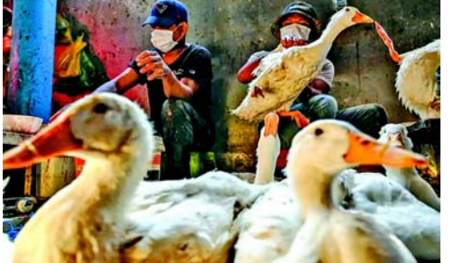
બર્ડ ફ્લૂ જોવા મળતાં વહીવટીતંત્રે પગલાં લીધાં છે. ભારત સરકારના એક્શન પ્લાન મુજબ જિલ્લા મેજીસ્ટ્રેટની અધ્યક્ષતામાં બેઠક યોજવામાં આવી છે. આ બેઠકમાં એપિક સેન્ટરથી એક કિલોમીટરની ત્રિજ્યામાં ઉછેરવામાં આવતા પક્ષીઓને મારી નાખવાનો નિર્ણય લેવામાં આવ્યો છે.

અલપુ, કેરળમાં ફરી એકવાર બર્ડ ફ્લૂના કેસ સામે આવ્યા છે, જે બાદ આ રોગ ફેલાવાનો ખતરો મંડરાઈ રહ્યો છે. બર્ડ ફ્લૂના કેસો મળ્યા બાદ વહીવટીતંત્ર સક્રિય મોડમાં હોવાનું જણાય છે. અધિકારીઓનું કહેવું છે કે કેરળના અલપુજા જિલ્લામાં બે સ્થળોએ બર્ડ ફ્લૂનો ફેલાવો નોંધાયો છે. તેમાં ઈદથવા ગ્રામ પંચાયતના વોર્ડ નંબર ૧ અને ચેરુથાણા ગ્રામ પંચાયતના વોર્ડ નંબર ૩નો સમાવેશ થાય છે. એવું જાણવા મળ્યું છે કે પાળેલા બતકોમાં બર્ડ ફ્લૂની પુષ્ટિ થઈ છે. અધિકારીઓનું કહેવું છે કે બર્ડ ફ્લૂના લક્ષણો દર્શાવ્યા બાદ બતકના સેમ્પલની તપાસ કરવામાં આવી છે. આ નમૂનાઓ ભોપાલની એક લેબમાં મોકલવામાં આવ્યા હતા, જ્યાં રોગની પુષ્ટિ થઈ છે. જિલ્લા વહીવટીતંત્રના અધિકારીનું કહેવું છે કે નમૂનામાં એવિયન ઈન્ફ્લુએન્સાની પુષ્ટિ થઈ છે. તેમણે ભાજપના '૪૦૦ પાર'ના નારા પર આકરા પ્રહારો કર્યા હતા. બીજેપીના '૪૦૦ પાર' ના નારા પર રેવન્ટ રેડીએ કહ્યું, "સુત્રસાર છે પરંતુ સ્વોગન સફળ થવાનું નથી. લોકોએ બીજેપીને બે વાર તક આપી પરંતુ તેણે માત્ર ડી રાજાની પત્ની એની રાજા અર્હીથી ચૂંટણી લડી રહ્યા છે. કોંગ્રેસ આ બેઠક જીતવા માટે તમામ પ્રયાસ કરી રહી છે. આ જ કમમાં તેલંગાણાના મુખ્યમંત્રી રેવંત રેડી પણ આપ્યું; વડાપ્રધાને જણાવ્યું વાયનાડ પહોંચ્યા હતા. મીડિયા સાથે વાત કરતી વખતે