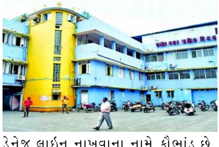
ડ્રેનેજ લાઈન નાખવાના નામે કોભાંડ છે. શહેરમાં જે જગ્યાએ ડ્રેનેજની લાઈનો નાખવામાં આવી ન હતી તેવા સ્થળોના નામે નકલી બિલ વીની ફાઈલો તૈયાર કરવામાં આવી હતી અને કોર્પોરેશનના એકાઉન્ટ વિભાગને પેમેન્ટ માટે ફોર્મ મોકલવામાં આવ્યા હતા. આ સમગ્ર મામલો ઓડિટ વિભાગમાંથી પસાર થયા બાદ

ઈન્દોર, ઈન્દોર મ્યુનિસિપલ કોર્પોરેશનમાં નકલી બિલ દ્વારા કરોડો રૂપિયાના કોભાંડનો મામલો સામે આવ્યો છે. પાંચ કંપનીઓના કોન્ટ્રાક્ટરોએ બનાવેલી બિલો આપીને રૂ. ૨૮ કરોડની છતરપિંડી કરી છે. કોર્પોરેશનની ફરિયાદ બાદ એમજી રોડ પોલીસ સ્ટેશન છેતરપિંડી સહિતની ગંભીર કલમો હેઠળ ગુનો નોંધ્યો છે. કહેવામાં આવી રહ્યું છે કે પોલીસ તપાસમાં અધિકારીઓની મિલિભંગત પણ બહાર આવશે. ઈન્દોર મ્યુનિસિપલ કોર્પોરેશનમાં દરરોજ કોભાંડના કિસ્સા પ્રકાશમાં આવે છે. ક્યારેક ફાઈલો ચોરાઈ જાય છે તો ક્યારેક નકલી બિલો આપીને કોભાંડ કરવામાં આવે છે. આ બાબત પ્રકાશમાં આવ્યો હતો જ્યારે હિસાબ વિભાગે ડ્રેનેજ વિભાગ પાસેથી આ અંગેની માહિતી એકત્ર કરી તપાસ કરી તો ખબર પડી કે આ ફાઈલો પર કામ માટે વર્ક ઓર્ડર આપવામાં આવ્યા નથી. તો તેમના બિલ કેવી રીતે પસાર થઈ શકે. આ સમગ્ર મામલે મહાનગરપાલિકાએ એમજી રોડ પોલીસ સ્ટેશનમાં પાંચ કંપનીઓ વિરુદ્ધ FIR નોંધવામાં. વાસ્તવમાં મહાનગરપાલિકામાં રૂ. ૨૮ કરોડનું નકલી બિલ કોભાંડ આનાથી ઘણું વધારે હોવાની શક્યતા છે. અધિકારીઓને એવી પણ શંકા છે કે કોન્ટ્રાક્ટરોની ટોળકીએ આવા ઘણા કેસોમાં ચૂકવણી કરાવી છે. ભૂગર્ભમાં થયેલા આવા કામો માટે કરોડો રૂપિયા ચૂકવવામાં આવતા હતા, જેની ચકાસણી સરળ નથી.