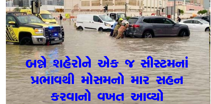
બન્ને શહેરોને એક જ સીસ્ટમનાં પ્રભાવથી મોસમનો માર સહન કરવાનો વખત આવ્યો