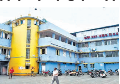
પ્રેનેજ લાઈન નાખવાના નામે કોભાંડ છે. શહેરમાં જે જગ્યાએ પ્રેનેજની લાઈનો નાખવામાં આવી ન હતી તેવા સ્થળોના નામે નક્કી બિલ વીની ફાઈલો તૈયાર કરવામાં આવી હતી અને કોર્પોરેશનના એકાઉન્ટ વિભાગને પેમેન્ટ માટે ફોર્મ મોકલવામાં આવ્યા હતા. આ સમગ્ર મામલો ઓડિટ વિભાગમાંથી પસાર થયા બાદ

ઈન્દોર, ઈન્દોર મ્યુનિસિપલ કોર્પોરેશનમાં નક્કી બિલ દ્વારા કરોડો રૂપિયાના કોભાંડનો મામલો સામે આવ્યો છે. પાંચ કંપનીઓના કોન્ટ્રાક્ટરોએ બનાવટી બિલો આપીને રૂ. ૨૮ કરોડની છેતરપિંડી કરી છે. કોર્પોરેશનની ફરિયાદ બાદ એમજી રોડ પોલીસ સ્ટેશને છેતરપિંડી સહિતની ગંભીર કલમો હેઠળ ગુનો નોંધ્યો છે. કહેવામાં આવી રહ્યું છે કે પોલીસ તપાસમાં અધિકારીઓની મિલિભંગત પણ બહાર આવી છે.