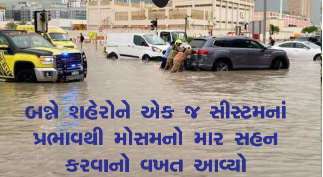
બન્ને શહેરોને એક જ સીસ્ટમનાં પ્રભાવથી મોસમનો માર સહન કરવાનો વખત આવ્યો

મુંબઈ, દુબઈ અને મુંબઈ વચ્ચે ૨૦૦૦ કિલોમીટરનું અંતર છે છતા બન્ને શહેરોને એક જ સીસ્ટમનાં પ્રભાવથી મોસમનો માર સહન કરવાનો વખત આવ્યો છે. બે દિવસ પૂર્વે દુબઈમાં અનરાધાર વરસાદ વરસતા જળબંબાકાર પુરની હાલત સર્જઈ હતી. જ્યારે મુંબઈમાં અસામાન્ય ગરમીનો માહોલ સર્જ્યો હતો. આ બન્ને સ્થિતિ માટે એક જ હવામાન સીસ્ટમ જવાબદાર રહી છે. હવામાન વિભાગના નિષ્ણાંતોએ કહ્યું કે, એક જ એન્ટી સાયકલોનિક સીસ્ટમથી દુબઈ અને મુંબઈને અસામાન્ય સ્થિતિનો સામનો કરવો પડ્યો છે. એન્ટીસાયકલોન તથા લોકલ હવામાનની સીસ્ટમ ભેગી થતા