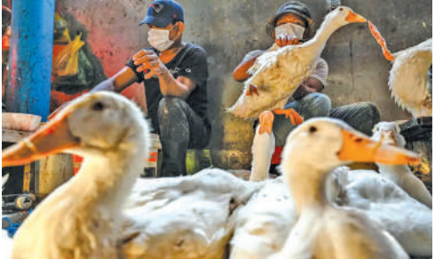
બર્ડ ફ્લૂ જોવા મળતાં વહીવટીતંત્રે પગલાં લીધાં છે. ભારત સરકારના એક્શન પ્લાન મુજબ જિલ્લા મેજસ્ટ્રેટની અધ્યક્ષતામાં બેઠક યોજવામાં આવી છે. આ બેઠકમાં એપિક સેન્ટરથી એક કિલોમીટરની ત્રિજ્યામાં ઉછેરવામાં આવતા પક્ષીઓને મારી નાખવાનો નિર્ણય લેવામાં આવ્યો છે.

અલપ્પુ, કેરળમાં ફરી એકવાર બર્ડ ફ્લૂના કેસ સામે આવ્યા છે, જે બાદ આ રોગ ફેલાવાનો ખતરો મંડરાઈ રહ્યો છે. બર્ડ ફ્લૂના કેસો મથ્યા બાદ વહીવટીતંત્ર સક્રિય મોડમાં હોવાનું જણાય છે. અધિકારીઓનું કહેવું છે કે કેરળના અલપ્પુજા જિલ્લામાં બે સ્થળોએ બર્ડ ફ્લૂનો ફેલાવો નોંધાયો છે. તેમાં ઈદદથા ગ્રામ પંચાયતના વોર્ડ નંબર ૧ અને ચેરુશાણા ગ્રામ પંચાયતના વોર્ડ નંબર ૩નો સમાવેશ થાય છે. એવું જાણવા મળ્યું છે કે પાળેલા બતકોમાં બર્ડ ફ્લૂની પુષ્ટિ થઈ છે. અધિકારીઓનું કહેવું છે કે બર્ડ ફ્લૂના લક્ષણો દર્શાવ્યા બાદ બતકના સેમ્પલની તપાસ કરવામાં આવી છે. આ નમૂનાઓ ભોપાલની એક લેબમાં મોકલવામાં આવ્યા હતા, જ્યાં રોગની પુષ્ટિ થઈ છે. જિલ્લા વહીવટીતંત્રના અધિકારીનું કહેવું છે કે નમૂનામાં એવિયન ઈન્ફ્લુએન્ઝાની પુષ્ટિ થઈ છે.