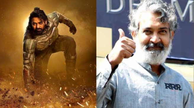
આપવામાં આવશે. અમિતાભ બચ્ચને તેમની ફિલ્મ ‘કલ્કી ૨૮૯૮ છક’ નું બીજું નવું પોસ્ટર તેમના ઈન્સ્ટાગ્રામ પર રિલીઝ કર્યું છે,

નવિદલ્હી સદીના મહાનાયક અને બોલીવુડ ના મેગાસ્ટાર અમિતાભ બચ્ચન આ દિવસોમાં તેમની બહુપ્રતિષ્ઠિત આગામી મેગા બજેટ ફિલ્મ ‘કલ્કી ૨૮૯૮’ માટે ખૂબ ચર્ચામાં છે, જેમાં દક્ષિણના સુપરસ્ટાર પ્રભાસ અને દીપિકા પાઠુકોણ મુખ્ય ભૂમિકામાં જોવા મળશે. ફિલ્મના ઘણા પોસ્ટર સતત રિલીઝ થઈ રહ્યા છે તેની સાથેજ ફિલ્મનું બિગ બીનું પોસ્ટર શેર કરતી વખતે જણાવવામાં આવ્યું હતું કે રવિવારે તેમના પાત્ર વિશે માહિતી