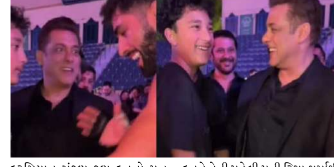
દરમિયાન સંજય જય દત્તનો પુત્ર શહરાન પણ સલમાન સાથે જોવા મળ્યો હતો. જણાવી દઈએ કે શહરાન સંજય દત્તનો અને તેની ત્રીજી પત્ની માન્યતા દત્તનો પુત્ર છે અને તેની હવે દુબઈથી પરત કર્યા બાદ મુંબઈ એરપોર્ટ પરથી સલમાન ખાનનો એક વીડિયો વાયરલ થઈ રહ્યો છે. તેઓ સોશિયલ મીડિયા પર વાયરલ થઈ રહ્યો છે. હવે દુબઈથી પરત કર્યા બાદ મુંબઈ એરપોર્ટ પરથી સલમાન ખાનનો એક વીડિયો વાયરલ થઈ રહ્યો છે. જેમાં સલમાન ખાન સાથે સુરક્ષાકર્મીઓનો કાફલો પણ જોવા મળ્યો હતો. દુબઈમાં એક કાર્યક્રમમાં હાજરી આપ્યા બાદ આજે સવારે કેમેરામાં સલમાન ખાનની ઝલક રેકોર્ડ કરી હતી, જેનો વીડિયો હવે ઈન્ટરનેટ પર વાયરલ થઈ રહ્યો છે. સલમાન ખાનના વર્ક ફ્રન્ટ વિશે વાત કરીએ તો, અભિનેતા છેલ્લે ફિલ્મ 'ટાઈગર ૩' માં સિલ્વર સ્ક્રીન પર જોવા મળ્યો હતો. 'ટાઈગર ૩' બાદ હવે સલમાન ખાન 'સિકંદર'માં જોવા મળશે. જેની અભિનેતાએ ઈદના અવસર પર ચાહકો માટે જાહેરાત કરી હતી.

દુબઈ, બોલિવૂડ સુપરસ્ટાર સલમાન ખાન વિશેની ચર્ચાઓ એવી છે ક્યારેય સમાપ્ત થતી નથી. છેલ્લા કેટલાક દિવસોથી સલમાન ખાન પોતાની સુરક્ષાને લઈને ચર્ચામાં છે. જાનથી મારી નાખવાની ધમકીઓ અને તેના ઘર ગેલેક્સીની બહાર ફાયરિંગની ઘટના પછી, ભાઈજાનની સુરક્ષા હેડલાઈન્સનો ભાગ બની ગઈ છે. એવામાં હવે હાલ દુબઈથી સલમાન ખાનનો એક વીડિયો વાયરલ થઈ રહ્યો છે. તાજેતરમાં તેઓ એક શોનો ભાગ બનવા માટે દુબઈ ગયા હતા અને તેઓ ભારત અને પાકિસ્તાન કરાટે મેચ જોવા ગયા હતા. આ દરમિયાન સંજય જય દત્તનો પુત્ર શહરાન પણ સલમાન સાથે જોવા મળ્યો હતો. જણાવી દઈએ કે શહરાન સંજય દત્તનો અને તેની ત્રીજી પત્ની માન્યતા દત્તનો પુત્ર છે અને તેની હવે દુબઈથી પરત કર્યા બાદ મુંબઈ એરપોર્ટ પરથી સલમાન