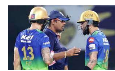
અમ્પાયર સાથે દલીલ કરવા બદલ સજા થઈ છે. પાંચ વર્ષ પહેલા રાજસ્થાન રોયલ્સ સામે રમાયેલી મેચમાં નો બોલ આપવામાં આવ્યા બાદ ધોની ગુસ્સે થયો હતો. જોકે, કેન્ચાઈઝીએ ધોની વતી આ દંડ ભર્યાં હતાં. આવી જ રીતે ગયા વર્ષે ૧૩ એપ્રિલે સન રાઈઝર્સ હૈદરાબાદના એક ખેલાડીને અમ્પાયરના વિરોધના બોજનો સામનો કરવો પડ્યો હતો.

કોલકાતા, વિરાટ કોહલી ફરી એકવાર ચર્ચામાં છે. રવિવારે ઈડન ગાર્ડન્સમાં અમ્પાયરના નિર્ણયથી કોહલી ઘણો નારાજ દેખાઈ રહ્યો હતો. કોલકાતા નાઈટ રાઈડર્સ અને રોયલ ચેલેન્જર્સ બેંગ્લોર વચ્ચે રમાયેલી મેચમાં આ અંગે મેદાનની વચ્ચે ભારે હોબાળો થયો હતો. મામલો એ હદે પહોંચી ગયો કે કોહલીએ પોતાની વિકેટ પર અમ્પાયર સાથે દલીલ કરવાનું શરૂ કરી દીધું. વાસ્તવમાં, કોહલી ત્રીજી ઓવરમાં આઉટ જાહેર થતાં નારાજ હતો. આ પછી તેની અમ્પાયર સાથે દલીલ થઈ હતી. ચાલો જાણીએ કે અમ્પાયર સાથે દલીલ કરવાની શું છે સજા? એમએસ ધોની જેવા ખેલાડીઓને પણ હેનરિક કલાસેનને તેની મેચ ફીના ૧૦ ટકા દંડ ફટકારવામાં આવ્યો હતો. વાસ્તવમાં, અમ્પાયર સાથે દલીલ કરવી આઈપીએલ આચાર સંહિતા વિરુદ્ધ છે. આ માટે કલમ ૨.૭ હેઠળ ગુનાઓ જાહેર કરવામાં આવ્યા છે. આઈપીએલની આચારસંહિતામાં જાહેર ટીકા અથવા અયોગ્ય ટિપ્પણીઓ માટે સજાની જોગવાઈઓ સામેલ છે. ૧૩ એપ્રિલ ૨૦૨૪ના રોજ જાણ્યું પંત પણ અમ્પાયર સાથે દલીલ કરતો જોવા મળ્યો હતો. અટ્ટા એજ ટેકનોલોજીનો ઉપયોગ ન કરવા પર તે ગુસ્સે હતો. જોકે, તે અમ્પાયર પર નિર્ભર કરે છે કે તેઓ કોહલી વિશે ફરિયાદ કરે છે કે નહીં. ૨૨૩ રનનો પીછો કરવા વિરાટ કોહલી આઉટ થયો હતો.