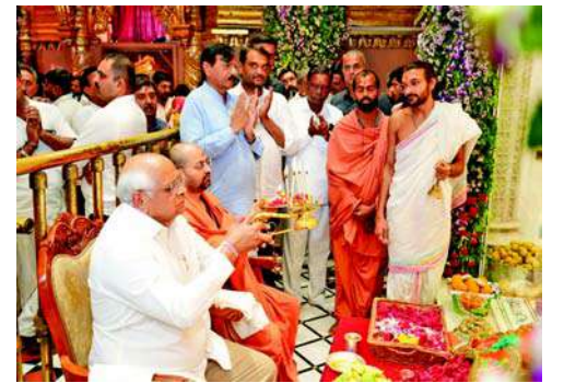
મહારાજની ભક્તિભાવપૂર્વક આરતી કરી હતી અને તમામ લોકોના સુખ, શાંતિ અને સમૃદ્ધિ માટે પ્રાર્થના પણ કરી હતી. હનુમાન જયંતિની આ ભવ્ય ઉજવણીમાં કષ્ટભંજન દેવ હનુમાનજી મંદિરના સંતો, આગેવાનો અને ભક્તોએ ઉત્સાહ અને ઉમંગ સાથે ભાગ લીધો હતો.

બોટાદ, મુખ્યમંત્રી ભૂપેન્દ્ર પટેલે મંગળવારે પ્રસિદ્ધ યાત્રાધામ શ્રી કષ્ટભંજન દેવ હનુમાનજી મંદિર, સાળંગપુર ધામ ખાતે આયોજિત હનુમાન જયંતિ ઉત્સવમાં ભક્તિભાવ સાથે ઉપસ્થિત રહ્યા હતા. મુખ્યમંત્રી ભૂપેન્દ્ર પટેલે ભગવાન હનુમાનજી મહારાજને ચઢવામાં આવેલ મહા અશ્રુકૂટની આરતીમાં ભાગ લીધો હતો અને સૌના સુખાકારી માટે પ્રાર્થના કરી હતી.