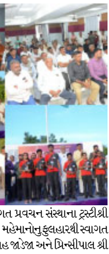
રાજકોટ, ઈન્ડરનેશનલ સ્કૂલમાં શાળાના બાળકોના વાલીઓ માટે પ્રેરણાદાયી વાલીનો વાર્ષિક સેમીનાર રાખવામાં આવ્યો હતો