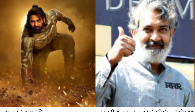
આપવામાં આવશે. 'કલ્કી ૨૮૮૮ છઠ્ઠ' નું બીજું નવું પોસ્ટર અમિતાભ બચ્ચને તેમની ફિલ્મ તેમના ઈન્સ્ટાગ્રામ પર રિલીઝ કર્યું છે,

નવિદલ્હી સદીના મહાનાયક અને બોલીવુડ ના મેગાસ્ટાર અમિતાભ બચ્ચન આ દિવસોમાં તેમની બહુપ્રતિષ્ઠિત આગામી મેગા બજેટ ફિલ્મ 'કલ્કી ૨૮૮૮' માટે ખૂબ ચર્ચામાં છે, જેમાં દક્ષિણના સુપરસ્ટાર પ્રભાસ અને દીપિકા પાદુકોણ મુખ્ય ભૂમિકામાં જોવા મળશે. ફિલ્મના ઘણા પોસ્ટર સતત રિલીઝ થઈ રહ્યા છે તેની સાથેજ ફિલ્મનું બિગ બીનું પોસ્ટર શેર કરતી વખતે જણાવવામાં આવ્યું હતું કે રવિવારે તેમના પાત્ર વિશે માહિતી