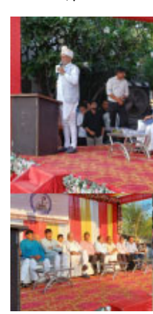
આપી હતી. તેમણે આ તકે જણાવેલ કે દેશના

રાજકોટ વાંકાનેર તાલુકાના જલ્દીડા ગામ પાતે ફોરેસ્ટ શુપ ઓફ કંપની પાતે વાંકાનેર-બામણબોર બાઉન્ડ્રી નેશનલ હાઈવે ઈન્ડસ્ટ્રીયલ એસોસીએશનના ઉપક્રમે સંસ્થાના સભાસદ ઉદ્યોગકારોનો એક સ્નેહમિલન યોજવામાં આવેલ હતું. જેમાં ૧૦૦થી વધુ ઉદ્યોગકારો ઉપસ્થિત રહ્યા હતા. અને ઉલ્લેખનીય છે કે વાંકાનેર-બામણબોર નેશનલ હાઈવે ઉપર સ્પીનીંગ ઉદ્યોગ, પેકેજીંગ ટેબલવેર પ્રોડક્ટ્સ સહિત ૧૦૦થી વધુ ઉદ્યોગોના યુનિટ કાર્યરત છે. આ સ્નેહમિલનના કાર્યક્રમમાં રાજકોટ લોકસભા હેઠળના બાજપના ઉમેદવારો પરશોતમભાઈ રૂપાલાએ પ્રેરક હાજરી