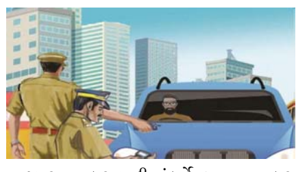
૮,૧૪૨ મતદાર યાદી સંદર્ભે ૭૬૦, મતદાર કાપલી સંદર્ભે ૨૦૦૦ તથા અન્ય ૧,૮૦૦ મળીને કુલ ૧૧,૦૦૨ ફરિયાદો મળી છે, ઉપરાંત મુખ્ય ચૂંટણી અધિકારીની કચેરી ખાતેના કંટ્રોલ રૂમ ઉપર ૧૮૩ ફરિયાદો, મીડિયા મારફતે ૧૮ ફરિયાદો, ટપાલ-ઈમેઈલ દ્વારા રાજકીય પક્ષો તરફથી ૩૯,

ગાંધીનગર, ગુજરાતમાં ચૂંટણી જાહેર થઈ ત્યારથી માંડીને અત્યાર સુધીમાં કુલ રૂ. ૧૨૧.૬૫ કરોડની બેનબરી ગેરકાયદેસર પ્રતિબંધિત ચીજો પકડાઈ છે. ચૂંટણી ખર્ચ નિયંત્રણ અને દેખરેખ માટે રાજ્યમાં કાર્યરત ૭૫૬ ફ્લાઈંગ સ્કવોડ તથા ૧,૨૦૩ સ્ટેટિક સર્વેલન્સ ટીમ દ્વારા આ બધી ચીજો પકડાઈ છે, જેમાં દારૂ-નશીલા પદાર્થો, જર-ઝંવેરાત, રોકડ રકમ વગેરે સામેલ છે. રાજ્યમાં ૧૬મી માર્ચથી ૨૧મી એપ્રિલ સુધીમાં ચૂંટણી તંત્રની મોબાઈલ એપ સી-વિજિલ ઉપર આચારસંહિતાના ભંગ બાબતની કુલ ૨,૮૩૮ ફરિયાદો મળી છે, નેશનલ ગ્રિવન્સ સર્વિસીસ પોર્ટલ ઉપર મતદાર ઓળખકાર્ડ અંગે