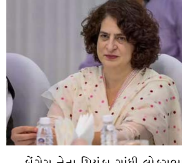
કોંગ્રેસ નેતા પ્રિયંકા ગાંધી લોકસભા ચૂંટણી માટે ગુજરાતમાં પ્રચાર કરશે. પ્રિયંકા ગાંધી ૨૭ એપ્રિલે ધરમપુરના દરબારગઢ ખાતે વલસાડથી પાર્ટીના ઉમેદવાર અનંત પટેલના સમર્થનમાં જાહેર સભાને સંબોધશે. વિધાનસભાની ચૂંટણીમાં અનંત પટેલની ભારત જોડો યાત્રા વચ્ચે કોંગ્રેસના નેતા રાહુલ ગાંધી પ્રચાર કરવા પહોંચ્યા હતા. હવે પ્રિયંકા ગાંધી લોકસભા ચૂંટણીમાં તેમના માટે વલસાડમાં આવી રહ્યાં છે. પ્રિયંકા ગાંધી લાંબા સમય બાદ ગુજરાતમાં કોંગ્રેસ માટે પ્રચાર કરશે. ભાજપે વલસાડ લોકસભા બેઠક પરથી ધવલ પટેલને મેદાનમાં ઉતાર્યા છે. વલસાડ ગુજરાતની તે બેઠકમાંથી એક છે જેના પર કોંગ્રેસની પકડ સારી છે. પ્રિયંકા ગાંધી છેલ્લે માર્ચ ૨૦૧૯માં ગુજરાત પહોંચ્યા હતા. આ પછી તેઓ પ્રથમ CWC મીટિંગમાં હાજરી આપવા આવ્યા હતા.

અમદાવાદ, ગુજરાતમાં કોંગ્રેસ આ લોકસભાની ચૂંટણીમાં લડી લેવાના મુડમાં છે. વિધાનસભા સમયે હાઈકોમનાં મંથી રાહુલ કે પ્રિયંકાએ ગુજરાત આવવાનું ટાળ્યું હતું પણ ૫ વર્ષ બાદ પ્રિયંકા વલસાડમાં આવી રહ્યાં છે. પ્રિયંકા ગાંધી લાંબા સમય બાદ ગુજરાતમાં કોંગ્રેસ માટે પ્રચાર કરશે. પ્રિયંકા ગાંધી ૨૭ એપ્રિલે વલસાડના ધરમપુરમાં જનસભાને સંબોધશે. પાર્ટીએ અહીંથી વર્તમાન પારાસભ્ય અનંત પટેલને ઉમેદવાર બનાવ્યા છે. તેઓ ભાજપના ધવલ પટેલ સામે ચૂંટણી લડી રહ્યા છે.