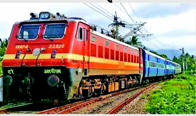
એક મુસાફરની ફરિયાદના આધારે રેલવેએ મુસાફરોને આ રાહત આપવાનો નિર્ણય કર્યો છે. તેનાથી સમગ્ર દેશના લોકોને રાહત મળશે.

નવીદિલ્હી, રેલવેએ મુસાફરોને મોટી રાહત આપી છે. IRCTC દ્વારા વસૂલવામાં આવતી મનમાની ફી અંગે પત્ર મોકલ્યો હતો. જેમાં તેણે કહ્યું હતું કે, જો IRCTC વેબસાઈટ દ્વારા બુક કરવામાં આવેલી વેઈટિંગ ટિકિટ કન્ફર્મ ન થાય તો રેલવે પોતે જ તે ટિકિટો કેન્સલ કરી દે છે. તેમજ અમારા દ્વારા ચુકવવામાં આવતી રકમનો મોટો ભાગ સર્વિસ ચાર્જ તરીકે કાપવામાં આવે છે.