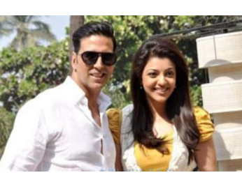
જાહેરાત થઈ ચૂકી છે. તેમની સાથે આ ફિલ્મમાં સાઉથની જાણીતી એક્ટ્રેસ કાજલ અગ્રવાલ પણ હોવાનું ચર્ચાઈ રહ્યું છે. પ્રાથમિક ફિલ્મમાં અદાયની એન્ટ્રી અંગે સત્તાવાર

મુંબઈ, અદાય કુમાર પોતાના કેરેક્ટર સાથે હંમેશા આખરા કરતા હોવાથી એક્શન-કોમેડી અને ડ્રાન્સ સહિતના તમામ રોલ પર હાથ અજમાવી ચૂક્યા છે. અદાય સતત નવું કરતા રહેવાની પોતાની આદતને આગળ ધવાવતા તેલુગુ ઈન્ડસ્ટ્રીમાં આગમન કરવાનો નિર્ણય લીધો છે. બિગ બજેટ તેલુગુ ફિલ્મ ‘કનપ્પા’માં અદાય કુમારનો સમાવેશ થયો છે. વિષ્ણુ માંચુનો લીડ રોલ ધરાવતી આ ફિલ્મમાં અદાયની એન્ટ્રી અંગે સત્તાવાર