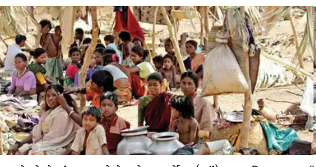
વક્તા તે છે કે ઈજીપ્તના ફેરોહ કે ટોલેલી ફિલાડેલ્ફીયા કે સમાટ્ર કિલઓવેટ્રાના સમયથી ગોલ્ડન હાર્વેસ (ધઉ) દ્વારા વિખ્યાત બની રહેલા સુદાનમાં લાખો લોકો ભૂખમરો અને પાણીની તંગીથી

સુદાન, સતત ચાલતા યુદ્ધ અને વહીવટી તંત્રના લગભગ અભાવે સુદાનને નિષ્ફળ રાષ્ટ્ર બનાવ્યું છે. પરિસ્થિતિ દૈન્ય દ્રાવક બની છે. દુનિયામાં પોતાના જ દેશમાં અગણિત લોકો નિર્વાસિત બની ગયા છે. ન તો યાજ્ઞમાં કે ન તો યુકેનમાં આ પરિસ્થિતિ છે. સુદાનમાં લાખો લોકો ભૂખમરો વેઠી રહ્યા છે. પીવાનાં પાણીની પણ અસહ્ય તંગી છે. વિધિની