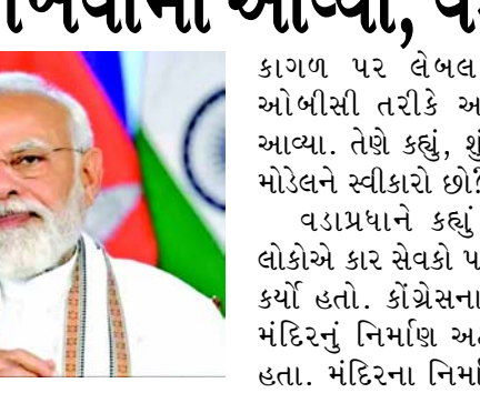
મોડલને સમગ્ર દેશમાં લાગુ કરવા માંગે છે. કર્ણાટક મોડલ એ છે કે ઓબીસીને આપવામાં આવેલા ૨૭ ટકા ક્વોટામાંથી તે મુસ્લિમ જાતિઓને આપવામાં આવ્યો છે. કર્ણાટકના તમામ મુસ્લિમોને એક

લખનૌ, વડા પ્રધાન નરેન્દ્ર મોદી આજે ઉત્તરપ્રદેશમાં ચૂંટણી રેલીઓને સંબોધન કર્યું હતું તેમણે આ રેલીઓમાં વિરોધ પક્ષોને નિશાન પર લીધા હતાં વડાપ્રધાન મોદીએ શાહજહાંપુરમાં બરેલી મોડ મેંદાનમાં ભાજપના ઉમેદવારના સમર્થનમાં એક જનસભાને સંબોધી હતી. સંબોધન પહેલા નાયબ મુખ્યમંત્રી બ્રજેશ પાલક અને કેબિનેટ મંત્રી સુરેશ કુમાર ખન્નાએ મંચ પર હાજુમાન જીની તસવીર રજૂ કરીને તેમનું સ્વાગત કર્યું હતું. મોદીએ કહ્યું કે કોંગ્રેસ કર્ણાટક