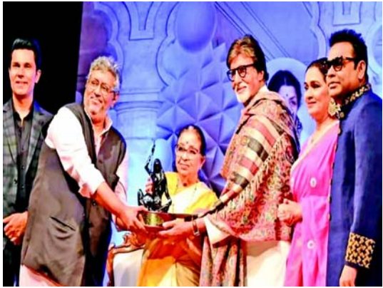
મંગેશકરની બહેન ઉષા મંગેશકરે અમિતાભને પોતાના હાથે એવોર્ડ આપ્યો હતો.

મુંબઈ, દીનાનાથ મંગેશકર નાટ્યગૃહ ખાતે આયોજિત કાર્યક્રમમાં બોલિવૂડ મેગાસ્ટાર અમિતાભ બચ્ચનને પ્રતિષ્ઠિત લતા દીનાનાથ મંગેશકર એવોર્ડથી સન્માનિત કરવામાં આવ્યા હતા. આ અવસર પર અમિતાભ બચ્ચનને સ્વર્ગસ્થ ગાયિકા લતા મંગેશકરને યાદ કરીને પોતાના ભાવનાત્મક વિચારો શેર કર્યા હતા. બિગ બીને સંગીત, કલા, સંસ્કૃતિ અને સામાજિક કાર્યમાં તેમના અજોડ યોગદાન માટે આ એવોર્ડ આપવામાં આવ્યો છે. બિગ બીએ આ ઈવેન્ટ માટે કુર્તા-પાયજામા સેટ સાથે મહત્વની શાલ પહેરી હતી. તેમની સાથે, શિવાંગી કોલ્હાપુરે, રણદીપ લુહા, એઆર રહેમાન અને મહારાષ્ટ્ર ભૂષણ ૨૦૨૩ વિજેતા અશોક સરાફ જેવા ઘણા પ્રખ્યાત કલાકારો સ્ટેજ પર જોઈ શકાય છે. લતા