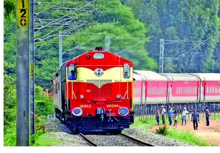
કલાકે ભાવનગર પહોંચશે. આ ટ્રેન દિલ્હી કેન્ટથી ૪ મે, ૨૦૨૪ થી ૨૮ જૂન, ૨૦૨૪ સુધી ચાલશે. એસી ૨ ટાયર, એસી ૩ ટાયર,

ભાવનગરથી દિલ્હીની સ્લીપર કોચની ટીકટ રૂ.૬૭૫ છે. જ્યારે થર્ડ એસીમાં ૧૭૭૫ અને સેકન્ડ એસીના ૨૪૪૫ ચુકવવાના રહેશે. ટ્રેન નં. ૦૮૫૫૭ ભાવનગર-દિલ્હી કેન્ટ 'સમર વીકલી સ્પેશિયલ ટ્રેન' ભાવનગર ટર્મિનસથી દર શુક્રવારે ૧૫.૧૫ કલાકે ઉપડશે અને બીજા દિવસે ૧૩.૧૦ કલાકે દિલ્હી કેન્ટ પહોંચશે. ટ્રેન નંબર ૦૮૫૫૮ દિલ્હી કેન્ટ-ભાવનગર 'સમર વીકલી સ્પેશિયલ ટ્રેન' દિલ્હી કેન્ટ સ્ટેશનથી દર શનિવારે ૧૫.૨૫ કલાકે ઉપડશે અને બીજા દિવસે ૧૨.૨૫