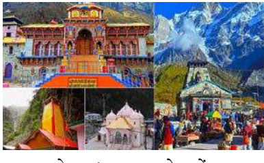
શ્રદ્ધાળુઓ ચારધામ યાત્રાએ પહોંચ્યા હતા. આ વખતે ચારધામ યાત્રામાં વિક્રમી સંખ્યામાં શ્રદ્ધાળુઓ આવે તેવી અપેક્ષા છે. ચારધામ યાત્રા માટે દેશ-વિદેશમાંથી

દહેરાદુન, ઉત્તરાખંડની ચારધામ યાત્રા આ વર્ષે ૧૦મી મે ૨૦૨૪થી શરૂ થઈ રહી છે. જેના માટે પ્રવાસન વિભાગે ઓનલાઇન રજીસ્ટ્રેશન શરૂ કર્યું છે. આ વર્ષે ચારધામ યાત્રા માટે મોટી સંખ્યામાં યાત્રિકો નોંધણી કરાવી રહ્યા છે. ૧૫મી એપ્રિલથી રજીસ્ટ્રેશન શરૂ થયા બાદ ૨૫મી એપ્રિલ સુધીમાં કુલ ૧૫ લાખ ૧૨ હજાર ૮૮૦ ભક્તોએ પોતાનું રજીસ્ટ્રેશન કરાવ્યું છે. જ્યારે ગત વર્ષે ૫૪.૮૨ લાખ