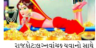
રાજકોટ:લગ્નવાંચકુ યુવાનો સાથે પ્રમર્યાંતિય યુવતીને પરણાવી છેતરપિંડી કરવાના બનાવો અવાર-નવાર સામે આવી રહ્યા છે. આવી જ એક ઘટનામાં રાજકોટ શહેરના એક યુવાન સાથે ૨.૫૦ લાખની કગાઈ કરવામાં આવી હતી. ૮ વર્ષ પહેલાના આ બનાવમાં