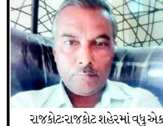
રાજકોટ:રાજકોટ શહેરમાં વધુ એક હિટ એન્ડ રનની ઘટના સામે આવી છે. શહેરના કોઠારિયા રોડ પ્રમાણે હોલ નજીક એકિટવાને પાછળથી આઈસરનો

ચાલક ઠોકરે લઈ નાસી છૂટતા એકિટવાચાલક ઘોઠ અને પાછળ બેઠેલા તેમના પિતરાઈ ભાઈ ફંગોળાઈ જતાં બંનેને ઈજા થતાં સિવિલ હોસ્પિટલમાં ખસેડવા હતાં. જેમાં પિતરાઈ ભાઈનું સારવાર દરમિયાન મોત નિપજતાં પિતરાઈ ભાઈની ટ્યાપી કરી હતી. ઉલ્લેખનીય છે કે, બંને ભાઈઓ પોખણડળ ગામે સરગાઈ પ્રસંગમાંથી પરત ઘરે આવી રહ્યા હતાં ત્યારે રાત્રે અકસ્માત થયો હતો. હોસ્પિટલ ચોકીના સ્ટાફે