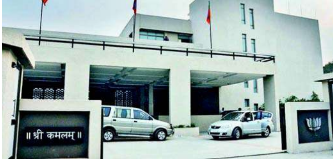
નિર્ણય લઈને ઉમેદવાર જાહેર કર્યા તેમાં બે બેઠકો પર બદલવા પડ્યા અને

ગાંધીનગર, લોકસભા ચૂંટણીમાં તમામ ૨૬ બેઠકો પર પાંચ લાખથી વધુની ભીડ સાથે વિજય માટે ધસમસી રહેલા ભાજપે ઉમેદવાર જાહેર કરતા જ હવે એક બાદ એક બેઠક પર સ્વીકૃતિ જેવી સ્થિતિ અનુભવવી પડે છે. જેના ખાખા પર બેસીને ચૂંટણી જીતવાની હતી તેવા કાર્યકર્તાઓને ઉમેદવાર અંગે ભાષણ જ પૂછાયુ અને ગાંધીનગર-દિલ્હીમાં ચાર-પાંચ લોકોએ