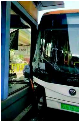
રાજકોટ શહેરના ૧૫૦ હુટ રીંગ રોડ પર કરોડોના ખર્ચે તૈયાર કરાયેલા બીઆરટીએસ રૂટ પર થોડા સમયથી ઈલેક્ટ્રીક બસ દોડાવવામાં આવી રહી છે બપોરે ઈ બસના ચાલકે બેફીકરાઈથી બસ ચલાવી ઈલેક્ટ્રીક બસ બીઆરટીએસના સ્ટોપમાં ઘુસાડી દેતાં મહિલા મુસાફરને સામાન્ય ઈજા પહોંચી હતી. જ્યારે ઈલેક્ટ્રીક બસ અને આરટીએસ સ્ટોપને ભારે નુકસાન થયું છે. આ ઘટના અંગેની જાણવા મળતી વિગત મુજબ,