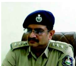
ટોળકી વિરુદ્ધ પોલીસે કાર્યવાહી કરી હતી જેમાં તપાસ દરમિયાન પુરાવાને આધારે ૧૮ પૈકી ૧૫ ઈસમોને ઝડપી લેવામાં આવ્યા હતા અને ૩ આરોપીઓ હજુ નાસતા ફરતા હોવાનું પોલીસે જણાવ્યું હતું.

સમી વ્યાસ દ્વારા મોરબી તા ૩૧ માર્ચ ૨૦૨૧ માં નોંધાયેલ ગુજસીટોકના ગુનામાં સંડોવાયેલ ઈસમોની મિલકત જમીની કાર્યવાહી પોલીસ દ્વારા કરવામાં આવી રહી હોય જેમાં પોલીસે આશરે ૧.૮૦ કરોડની મિલકત જમ કરી છે તો ૨૪ બેંક ખાતામાં રહેલ ૧૨.૫૦ લાખની રોકડ રકમ જમ કરી હોવાની માહિતી પ્રાપ્ત થઈ છે.