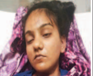
સંભાળી પાસ્ટમાટેમ કરાવ્યું છે. આ બનાવ અંગે મુતકના પિતા વનરાજસિંહ પ્રભાતસિંહ જાહેરાતે પોલીસને જાણ કરી હતી કે, મુતકની માતાએ ઘરકામ બાબતે ઠપકો આપતાં માહું લાગવાથી આ પગલું ભરી લીધું હોવાનું જાહેર કરાયું છે. જે સમગ્ર મામલે ધ્રોળ પોલીસે ઊંડાણપૂર્વકની હિરલબાના મૃતદેહનો કબજો

જામનગર : જામનગર જિલ્લાના ધ્રોલ તાલુકાના મોટા વાગુદડ ગામમાં રહેતી ૨૦ વર્ષની યુવતીએ ગઈકાલે પોતાના ઘરે ગળાફાંસા દ્વારા આત્મહત્યા કરી લેતાં ભારે ચકચાર જાગી છે. માતાએ ઘરકામ બાબતે ઠપકો આપતાં માહું લાગવાથી આ પગલું ભરી લીધાનું પોલીસમાં જાહેર થયું છે.