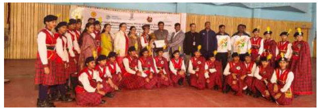
કેલેન્ડર બંધ ઉના

સમગ્ર ભારતમાં પશ્ચિમના સાત રાજ્યની મહારાષ્ટ્ર ના પુણા ખાતે યોજાયેલી બેન્ડ પાઈપ બેન્ડ સ્પર્ધા માં માતૃ શ્રી આરડી વરસાણી કુમાર વિદ્યાલય એસજીવીપી ગુરુકુલ દ્રોણેશ્વર ના છાત્રો પ્રથમ ક્રમાંકે વિજેતા બન્યાં છે. હવે આ ટીમ રાષ્ટ્રીય ક્લાસી સ્પર્ધા માટે દિલ્લીમાં જશે. આ જ સ્પર્ધામાં ગુરુકુલ ની દિકરીઓ તૃતીય ક્રમે વિજેતા બની છે.