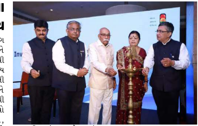
નાણાકીય ઉત્પાદનો પસંદ કરવાના મહત્વ પર પ્રકાશ પાડવામાં આવ્યો હતો. સત્રમાં આજના ઝડપથી વિકસતા

રાષ્ટ્રવ્યાપી પ્રયાસોનો એક ભાગ છે. જાગૃતિ દ્વારા રોકાણકારોને સશક્ત બનાવવું- નવું વર્ષ નવી શરૂઆત અને સ્માર્ટ નાણાકીય પસંદગીઓનું પ્રતીક છે. સત્રની શરૂઆત નાણાકીય અને સિક્યોરિટીઝ બજારોને સમજવાથી થઈ હતી, જેમાં વ્યક્તિગત ધ્યેયો અને જોખમ લેવાની શક્તિ, રોકાણકારોના અધિકારો અને જવાબદારીઓ, ફરિયાદ નિવારણ પદ્ધતિઓ, છેતરપિંડી અને ક્રોડમાં નિવારણ વગેરેના આધારે યોગ્ય