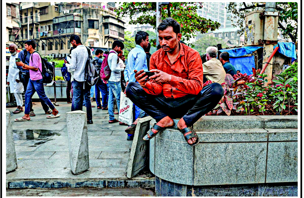
રવિવારે કેન્દ્રીય બજેટ રજૂ થયું, આ બજેટમાં વિકસિત ભારતના સોનેરી સપનાઓ બતાવવામાં આવ્યા અને વર્ષ ૨૦૪૭ નું વિઝન પણ સ્પષ્ટ કરવામાં આવ્યું. સરકાર વિકાસના ગુલાબી સપના જોઈ રહી છે ત્યારે બીજા તરફ સામાન્ય અને શ્રમિક વર્ગની સ્થિતિમાં કોઈ ફેર પડ્યો નથી. મુંબઈમાં રોજિંદી આવક રળવા માટે એક કામદાર રેલવે જંકશન પાસે કામની રાહ જોઈ રહેલો નજરે પડે છે.

અત્યાર સુધી કોઈપણ જિલ્લામાંથી કોઈ જાનહાનિ કે મોટા માલ-મિલકતને નુકસાન થયું નથી. તેમણે કહ્યું કે સંબંધિત વિભાગો પરિસ્થિતિ પર નજર રાખી રહ્યા છે, અને પ્રારંભિક અહેવાલો દર્શાવે છે કે ક્યાંય પણ ગંભીર નુકસાન થયું નથી. ભૂકંપ દ્વારા છોડવામાં આવેલી ઊર્જા આશરે ૨૩૮ ટન TNT ના વિસ્ફોટ જેટલી હોવાનો અંદાજ છે, જોકે તેની અસર મર્યાદિત વિસ્તાર સુધી મર્યાદિત હતી. પ્રત્યક્ષદર્શીઓએ જણાવ્યું હતું કે થોડી સેકન્ડ માટે આંચકા અનુભવાયા હતા, પરંતુ પછી પરિસ્થિતિ સામાન્ય થઈ ગઈ હતી. વહીવટીતંત્રે જનતાને શાંતિ જાળવવા અને કોઈપણ અપ્રમાણિત માહિતી પર આધાર ન રાખવા અપીલ કરી છે.