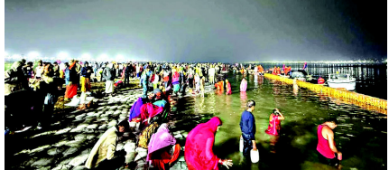
ગંગામાં સ્નાન કર્યું. ત્યારબાદ, મોટાભાગના લોકોએ પુજારીઓ પાસેથી ભગવાન સત્યનારાયણની કથા સાંભળી અને દક્ષિણા (દાનનો પ્રસાદ) અર્પણ કરી. ભક્તોએ નક્કા કુઆન મંદિર, હનુમાન મંદિર, વેદાંત મંદિર,

પશ્ચિમ ઉત્તર પ્રદેશ, દિલ્હી, હરિયાણા, રાજસ્થાન અને અન્ય રાજ્યોના ભક્તોએ સવારે બ્રહ્મ મુહૂર્ત દરમિયાન બ્રજઘાટ ખાતે સ્નાન કરવાનું શરૂ કર્યું. પ્રયાગરાજ, પોષ મહિનાની પૂર્ણિમાના દિવસે, હાપુડના બ્રજઘાટ ખાતે ભક્તોએ માતા ગંગામાં શ્રદ્ધાનું સ્નાન કર્યું. જોકે, ઠંડી અને ઠંડા પવનોને કારણે ભક્તોની સંખ્યા ઓછી રહી. પશ્ચિમ ઉત્તર પ્રદેશ, દિલ્હી, હરિયાણા, રાજસ્થાન અને અન્ય રાજ્યોના ભક્તોએ શનિવારે સવારે બ્રહ્મ મુહૂર્ત દરમિયાન બ્રજઘાટ ખાતે સ્નાન કરવાનું શરૂ કર્યું. દરમિયાન, સ્થાનિક અને નજીકના ગંગા ભક્તોએ પુષ્પાવતી પૂથ અને લથિરા ખાતે બદ્રકાલી મંદિર અને અન્ય મંદિરોમાં પ્રાર્થના કરવા માટે મુલાકાત લીધી. ભક્તોએ તેમના પરિવારો અને દેશની સુખાકારી માટે પ્રાર્થના કરી. ભક્તોની સંખ્યા ઓછી હોવાને કારણે અને ટ્રાફિક ઓછો હોવાને કારણે, હાઈવે ટ્રાફિક જામથી મુક્ત રહ્યો. પોલીસ અધિકારી અને અધિક જિલ્લા મેજિસ્ટ્રેટએ શુક્રવારે રાત્રે ગંગાનગરીની મુલાકાત લીધી, જ્યારે મુખ્ય પોલીસ અધિકારી અને કોતવાલી પોલીસે શનિવારે સવારે ભક્તો માટે સુરક્ષા વ્યવસ્થાનું નિરીક્ષણ કર્યું હતું.