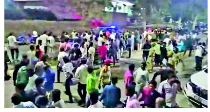
કોલેજ અને રિસર્ચ સેન્ટરમાં કરવામાં આવ્યું હોવાનું જણાવાયું છે. ફોરેન્સિક ટીમે તેમના શરીરમાંથી ૧૨ મીમી સિંગલ-બોર ગોળીનો ટુકડો મેળવ્યો. તપાસમાં જણવા મળ્યું કે આ ટુકડો કોંગ્રેસના ધારાસભ્ય નારા ભરત રેડ્ડી અને તેમના નજીકના સહયોગીઓના અંગરક્ષક અને

પોસ્ટમોર્ટમ અને ફોરેન્સિક તપાસમાં રાજશેખરને વાગેલી ગોળી કોંગ્રેસના ધારાસભ્યના ભરત રેડ્ડીના અંગત અંગરક્ષકની બંદૂકમાંથી ચલાવવામાં આવી હતી: મોટો ખુલાસો બેલ્લારી, કર્ણાટકના બેલ્લારીમાં ગુરુવારે મોડી રાત્રે કોંગ્રેસ અને ભાજપ સમર્થકો વચ્ચે હિંસક અથડામણ થઈ. અથડામણ દરમિયાન થયેલા ગોળીબારમાં એક કોંગ્રેસ કાર્યકર રાજશેખરનું મોત થયું છે. કોંગ્રેસ કાર્યકર રાજશેખરના મૃત્યુ અંગે એક મોટો ખુલાસો થયો છે. પોલીસ સૂત્રોના જણાવ્યા અનુસાર, પોસ્ટમોર્ટમ અને ફોરેન્સિક તપાસમાં જણવા મળ્યું છે કે રાજશેખરને વાગેલી ગોળી કથિત રીતે કોંગ્રેસના ધારાસભ્ય નારા ભરત રેડ્ડીના અંગત અંગરક્ષકની બંદૂકમાંથી ચલાવવામાં આવી હતી. રાજશેખરનું પોસ્ટમોર્ટમ બેલ્લારી મેડિકલ