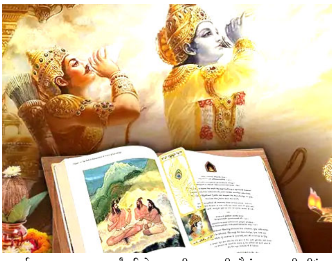
આકર્ષક ભરતનાટ્યમ રજૂ કર્યું. ઈસ્કોન યુથ ગ્રુપના સભ્યોએ સોશિયલ મીડિયાના પ્રભાવથી ભટકાતા યુવાધનને ગીતાના તાત્વિક માર્ગદર્શન દ્વારા જીવનમૂલ્યો સમજાવતું પ્રેરણાદાયી સ્ટીટ રજૂ કરી સૌનું મન જીતી લીધું.

ગાંધીનગર, ગુજરાત રાજ્ય સંસ્કૃત બોર્ડ, ગાંધીનગરના નેતૃત્વ હેઠળ સંસ્કૃત ભાષાના સંવર્ધન અને પ્રચાર-પ્રસાર માટે વિવિધ યોજનાઓ ચાલી રહી છે. તે અંતર્ગત શ્રીમદ્ ભગવદ્ ગીતા યોજનાના ભાગરૂપે આજે ગીતા જયંતી નિમિત્તે જિલ્લા શિક્ષણાધિકારી કચેરી, ગાંધીનગર અને સંસ્કૃત બોર્ડના સંયુક્ત ઉપક્રમે "ગીતા જયંતી મહોત્સવની જિલ્લા કક્ષાની ઉજવણી" સફલ વિદ્યાલય, ગાંધીનગર ખાતે સવારે ૦૮:૦૦ થી ૧૧:૩૦ કલાક દરમિયાન ભવ્ય રીતે યોજાઈ.