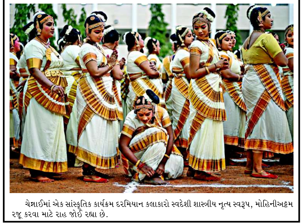
ચેન્નાઈમાં એક સાંસ્કૃતિક કાર્યક્રમ દરમિયાન કલાકારો સ્વદેશી શાસ્ત્રીય નૃત્ય સ્વરૂપ, મોહિનીઅટ્ટમ રજૂ કરવા માટે રાહ જોઈ રહ્યા છે.