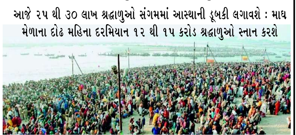
આજે ૨૫ થી ૩૦ લાખ શ્રદ્ધાળુઓ સંગમમાં આસ્થાની ડૂબકી લગાવશે : માઘ મેળાના દોઢ મહિના દરમિયાન ૧૨ થી ૧૫ કરોડ શ્રદ્ધાળુઓ સ્નાન કરશે

ટેન્ડર, ૭ અગ્નિશમન ચોકી, ૨૦ ફાયર વોચ ટાવર, એક જલ પોલીસ સ્ટેશન અને એક કંટ્રોલ રૂમ સ્થાપવામાં આવ્યો છે. ૮ કિમી લાંબી ડીપ વોટર બેરિકેડિંગ પણ બનાવવામાં આવી છે. સીસીટીવી કેમેરા અને છં યુક્ત ૪૦૦ કેમેરા દ્વારા કાઉંડ મેનેજમેન્ટ, કાઉંડ ડેન્સિટી એનાલિસિસ અને ઈન્સિડન્ટ રિપોર્ટિંગ કરવામાં આવી રહ્યું છે. પરિવહન નિગમની ૩૮૦૦ બસો સેવામાં છે.