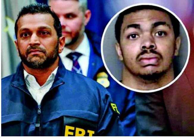
એફબીઆઈના ડાયરેક્ટર કાશ પટેલે શુક્રવારે સોશિયલ મીડિયા પર આ બાબતની પુષ્ટિ કરતા જણાવ્યું હતું કે, તપાસ એજન્સીઓએ નવા વર્ષની આગલી રાતે નિર્દોષ લોકો પર થનારા

નવા વર્ષના સ્વાગતની તૈયારીઓ વચ્ચે અમેરિકામાં એક ભયાનક આતંકવાદી હુમલો થતા રહી ગયો છે. અમેરિકા સુરક્ષા એજન્સીઓએ સમયસૂચકતા વાપરીને ઉત્તરી કેરોલિનામાં એક મોટા કાવતરાનો પ્રદર્શક કર્યો છે. ઈસ્લામિક સ્ટેટ પ્રેરિત આ હુમલાની યોજના ઘડનાર આરોપીની ધરપકડ કરવામાં આવી છે. આ સફળતા બાદ અમેરિકી ન્યાય વિભાગે રાહતનો શ્વાસ લીધો છે અને નાગરિકોની સુરક્ષા સુનિશ્ચિત કરી છે.