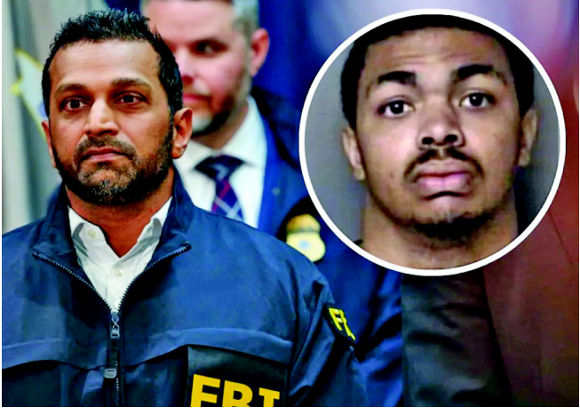
એફબીઆઈના ડાયરેક્ટર કાશ પટેલે શુક્રવારે સોશિયલ મીડિયા પર આ બાબતની પુષ્ટિ કરતા

નવા વર્ષના સ્વાગતની તૈયારીઓ વચ્ચે અમેરિકામાં એક ભયાનક આતંકવાદી હુમલો થતા રહી ગયો છે. અમેરિકા એજન્સીઓએ સમયસૂચકતા વાપરીને ઉત્તરી કેરોલિનામાં એક મોટા કાવતરાનો પર્દાફાશ કર્યો છે. ઈસ્લામિક સ્ટેટ પ્રેરિત આ હુમલાની યોજના ઘડનાર આરોપીની ધરપકડ કરવામાં આવી છે. આ સફળતા બાદ અમેરિકા ન્યાય વિભાગે રાહતનો શ્વાસ લીધો છે અને નાગરિકોની સુરક્ષા સુનિશ્ચિત કરી છે. મીડિયા એજન્સીના અહેવાલ મુજબ, ફેડરલ એજન્સીએ બુધવારે એક ૧૮ વર્ષીય ક્રિશ્ચિયન સ્ટુડન્ટ નામના યુવાનની અટકાયત કરી હતી.