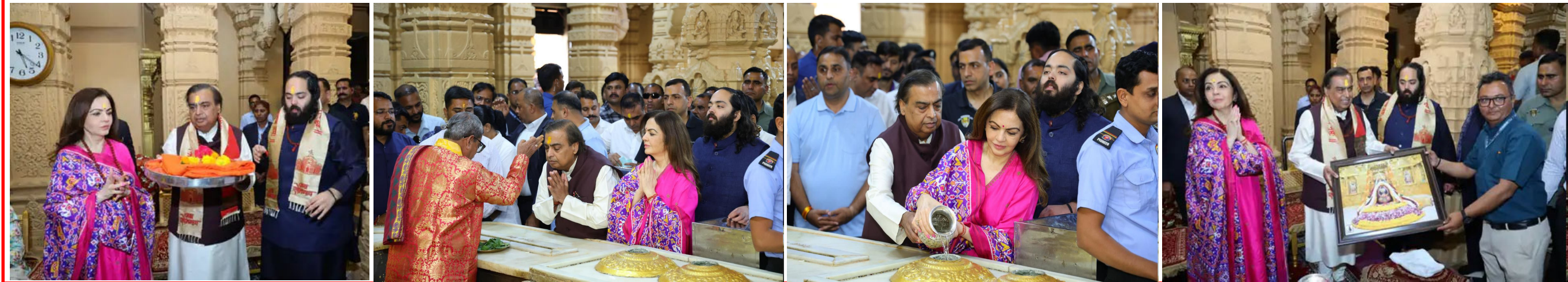
મુકેશ અંબાણી, નીતા અંબાણી અને અનંત અંબાણીએ સોમનાથ મહાદેવના દર્શન કરી જળાભિષેક અને પૂજા-અર્ચના કરી, રૂ.૫ કરોડનું દાન આપ્યું

જામનગર, પ્રસિદ્ધ ઉદ્યોગપતિ અને રિલાયન્સ ઇન્ડસ્ટ્રીઝના ચેરમેન મુકેશ અંબાણીએ શુક્રવારે પરિવાર સાથે ગુજરાતના પ્રથમ જ્યોર્ટિલિંગ એવા ભગવાન સોમનાથ મહાદેવના દર્શન કરી ધન્યતા અનુભવી હતી. તેમની સાથે પત્ની નીતા અંબાણી, પુત્ર