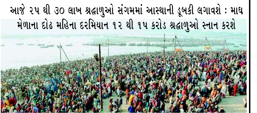
આજે ૨૫ થી ૩૦ લાખ શ્રદ્ધાળુઓ સંગમમાં આસ્થાની ડૂબકી લગાવશે : માઘ મેળાના દોઢ મહિના દરમિયાન ૧૨ થી ૧૫ કરોડ શ્રદ્ધાળુઓ સ્નાન કરશે

ટેન્ડર, ૭ અગ્નિશમન ચોકી, ૨૦ ફાયર વોચ ટાવર, એક જલ પોલીસ સ્ટેશન અને એક કંટ્રોલ રૂમ સ્થાપવામાં આવ્યો છે. ૮ કિમી લાંબી ડીપ વોટર બેરિકેડિંગ પણ બનાવવામાં આવી છે. સીસીટીવી કેમેરા અને છં યુક્ત ૪૦૦ કેમેરા દ્વારા કાઉન્ટ મેનેજમેન્ટ, કાઉન્ટ ડેવિલોપમેન્ટ અને ઈન્સાઈડરિપોર્ટિંગ કરવામાં આવી રહ્યું છે. પરિવહન નિગમની ૩૮૦૦ બસો સેવામાં છે.