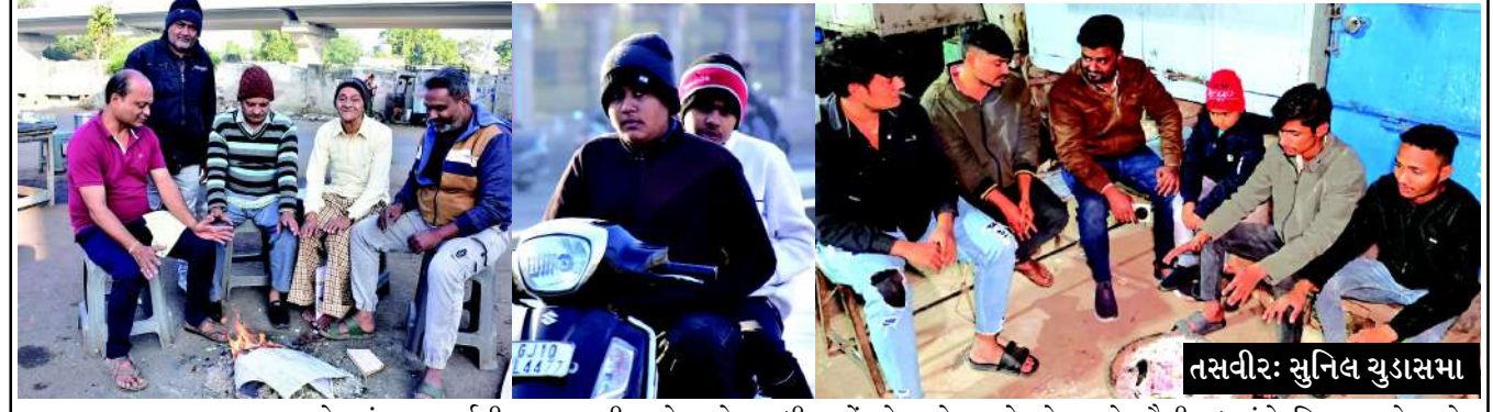
જામનગર : જામનગર શહેરમાં નવા વર્ષની શરૂઆતની સાથે સાથે ઠંડીનો ચમકારો પણ વધ્યો છે. અને લોકો હવે ઠંડીની અહેસાસ કરવા લાગ્યા છે. ગઈકાલે ઠંડીનો પારો નીચે ઉતરીને ૧૩ ડિગ્રીએ સ્થિર થયો હતો, જેમાં આજે વધારો થયો છે, અને વધુ એક ડિગ્રી નીચે ઉતરીને ઠંડીનો પારો ૧૨ ડિગ્રી નોંધાયો છે, સાથોસાથ ભેજનું પ્રમાણ પણ વધી ગયું હોવાથી વાતાવરણમાં ઠંડક પ્રસરી ગઈ છે, અને લોકો ગરમ વસ્ત્રોથી લપેટાયેલા જોવા મળી રહ્યા છે. આજથી ૧૫ દિવસ પહેલા ઠંડીનો પારો નીચે ઉતરીને ૧૨ ડિગ્રી સુધી પહોંચ્યો હતો, અને મોસમનો સૌથી વધુ ઠંડો દિવસ રહ્યો હતો. આજે પણ તેટલું જ ટેમ્પરેચર નોંધાયું છે, અને હજી પણ ઠંડી વધે તેવી શક્યતાઓ દર્શાવાઈ રહી છે. જામનગર જિલ્લા કલેક્ટર કચેરીના કંટ્રોલરૂમના જણાવ્યા અનુસાર આજે સવારે આઠ વાગ્યે પુરા થતા ૨૪ કલાક દરમિયાન લઘુત્તમ તાપમાન ૧૨ ડિગ્રી સેન્ટિગ્રેડ જ્યારે મહત્તમ તાપમાન ૨૬ ડિગ્રી સેન્ટિગ્રેડ નોંધાયું છે. વાતાવરણમાં ભેજનું પ્રમાણ ૭૬ ટકા રહ્યું હતું, જ્યારે પવનની ગતિ સરેરાશ પ્રતિ કલાકના ૨૦ થી ૨૫ કિ.મી ની ઝડપે રહી હતી.