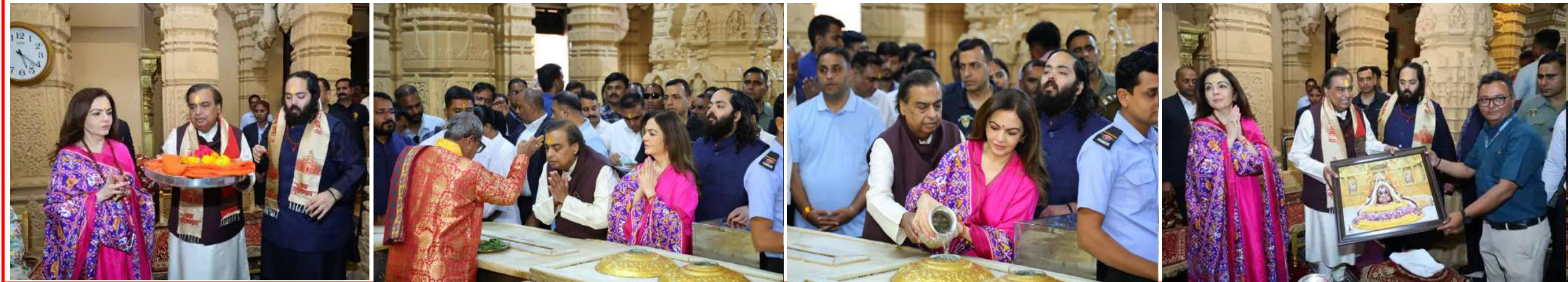
મુકેશ અંબાણી, નીતા અંબાણી અને અનંત અંબાણીએ સોમનાથ મહાદેવના દર્શન કરી જળાભિષેક અને પૂજા-અર્ચના કરી, રૂ.૫ કરોડનું દાન આપ્યું

જામનગર, પ્રસિદ્ધ ઉદ્યોગપતિ અને રિલાયન્સ ઇન્ડસ્ટ્રીઝના ચેરમેન મુકેશ અંબાણીએ શુક્રવારે પરિવાર સાથે ગુજરાતના પ્રથમ જ્યોર્ટિલિંગ એવા ભગવાન સોમનાથ મહાદેવના દર્શન કરી ધન્યતા અનુભવી હતી. તેમની સાથે પત્ની નીતા અંબાણી, પુત્ર