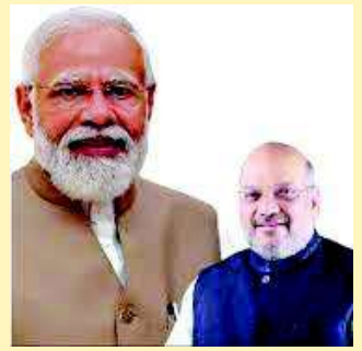
સમાપન પ્રસંગે કેન્દ્રીય ગૃહ મંત્રી અમિત શાહનો ઉપસ્થિત રહે તેવું કહેવાઈ રહ્યું છે. રાજકોટ કલેક્ટરે તમામ પ્રાંત

રાજકોટ, વિકાસના વૈશ્વિક પથ ઉપર આગળ વધતા રાજકોટને નવો વેગ આપવા રાજકોટમાં તા. ૧૧-૧૨ યોજનાર સૌરાષ્ટ્ર-કચ્છ રિજનલ વાઈબ્રન્ટ સમિટને લઈને સ્થાનિક તંત્રથી લઈને રાજ્ય સરકાર સુધી તૈયારીઓનો ધમધમાટ ચાલી રહ્યો છે. રાજકોટમાં આગામી સપ્તાહથી રાજકીયથી ઔદ્યોગિક અને રમત જગતના મહાનુભાવોનો મુકામ શરૂ થવાનો છે. વાઈબ્રન્ટનું ઉદ્ઘાટન તા. ૧૧ના વડાપ્રધાન નરેન્દ્ર મોદી કરવાના છે, ત્યારબાદ તા. ૧૨ના