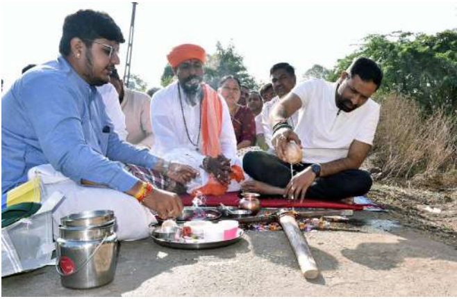
સાચસંનું ઉચ્ચ શિક્ષણ ધરવે આગે મળી શકે છે. આ પ્રસંગે રાજ્યમંત્રીશ્રીએ આંટવાદેવળી પ્રાથમિક શાળાની મુલાકાત લઈ વિદ્યાર્થીઓ દ્વારા આયોજિત વિજ્ઞાન પ્રદર્શન નિહાળ્યું હતું. બાળકોની સર્જનાત્મકતા, સમજણ અને આત્મવિશ્વાસ જોઈ આનંદ વ્યક્ત કર્યો હતો. નાની વયમાં જ વિજ્ઞાન પ્રત્યેનો ઉત્સાહ અને નવીન વિચારો ભવિષ્યના ઉજ્જવળ સંકેત છે. તમામ બાળકોને તેમના અભ્યાસ અને આવનારા ભવિષ્ય માટે હાર્દિક શુભકામના પાઠવી હતી. આ ખાતમુહૂર્ત કાર્યક્રમ દરમિયાન સ્થાનિક જનપ્રતિનિધિઓ, અધિકારીઓ, સરપંચશ્રીઓ, આગેવાનો તથા ગ્રામજનો ઉપસ્થિત રહ્યા હતા. કાર્યક્રમમાં એ.પી.એમ.સી આપવામાં આવ્યું. આ યાર્દ આજે મગફળીથી થયેલ છે. અમરેલી જિલ્લાના કુંકાવાવ તાલુકાને તાલુકાની રચના થઈ ત્યારબાદ પ્રથમવાર એ.પી.એમ.સી આપવામાં આવ્યું. આ યાર્દ આજે મગફળીથી કરવામાં આવ્યું હતું. આ પ્રસંગે રાજ્યમંત્રીશ્રીએ જણાવ્યું હતું કે, રાજ્ય સરકાર ગ્રામ્ય વિસ્તારોમાં માર્ગ સલામતી અને આવાગમનની સુવિધાઓ સુદૃઢ બનાવવા પ્રતિબદ્ધ છે. આંટવાદેવળીમાં રૂ. ૮૫ લાખના ખર્ચે શાળા તૈયાર કરવામાં આવી છે.

રાજ્યમંત્રીશ્રી કૌશિકભાઈ વેકરીયાના હસ્તે ખાખરીયા-ભૂખળી-સાંથળી રોડ તથા ભાંટવાદેવળી-બરવાળા રોડ પર પ્રોટેક્શન વોલના કામનું ખાતમુહૂર્ત