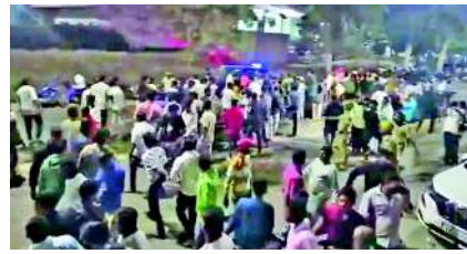
કોલેજ અને રિસર્ચ સેન્ટરમાં કરવામાં આવ્યું હોવાનું જણાવાયું છે. ફોરેન્સિક ટીમે તેમના શરીરમાંથી ૧૨ મીમી સિંગલ-બોર ગોળીનો ટુકડો મેળવ્યો. તપાસમાં જાણવા મળ્યું કે આ ટુકડો કોંગ્રેસના ધારાસભ્ય નારા ભરત રેડ્ડી અને તેમના નજીકના સહયોગીઓના અંગરક્ષક અને

પોસ્ટમોર્ટમ અને ફોરેન્સિક તપાસમાં રાજશેખરને વાગેલી ગોળી કોંગ્રેસના ધારાસભ્યના ભરત રેડ્ડીના અંગત અંગરક્ષકની બંદૂકમાંથી ચલાવવામાં આવી હતી: મોટો ખુલાસો બેલ્લારી, કર્ણાટકના બેલ્લારીમાં ગુરુવારે મોડી રાત્રે કોંગ્રેસ અને ભાજપ સમર્થકો વચ્ચે હિંસક અથડામણ થઈ. અથડામણ દરમિયાન થયેલા ગોળીબારમાં એક કોંગ્રેસ કાર્યકર રાજશેખરનું મોત થયું. હવે, કોંગ્રેસ કાર્યકર રાજશેખરના મૃત્યુ અંગે એક મોટો ખુલાસો થયો છે. પોલીસ સૂત્રોના જણાવ્યા અનુસાર, પોસ્ટમોર્ટમ અને ફોરેન્સિક તપાસમાં જાણવા મળ્યું છે કે રાજશેખરને વાગેલી ગોળી કથિત રીતે કોંગ્રેસના ધારાસભ્ય નારા ભરત રેડ્ડીના અંગત અંગરક્ષકની બંદૂકમાંથી ચલાવવામાં આવી હતી. રાજશેખરનું પોસ્ટમોર્ટમ બેલ્લારી મેડિકલ