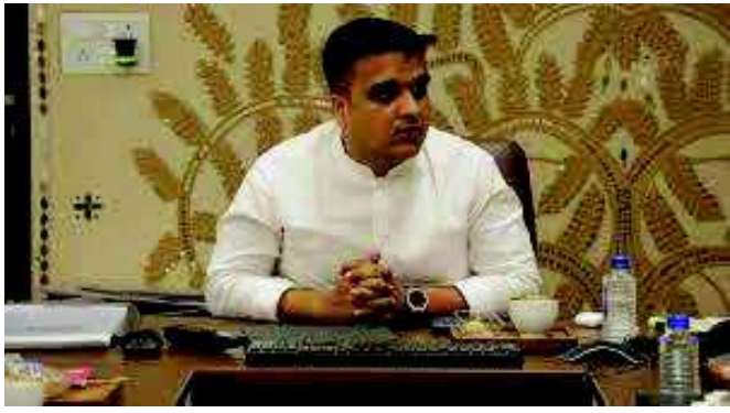
રાઉન્ડ લેવલ પર સમીક્ષા કરશે. સૂત્રો પાસેથી મળતી માહિતી મુજબ, હર્ષ સંઘવી સોમવારે સવારે મારવાડી યુનિવર્સિટી ખાતે

રાજકોટ રાજકોટ ખાતે આગામી ૧૧ થી ૧૩ જાન્યુઆરી દરમિયાન યોજનારી 'રિજનલ વાઈબ્રન્ટ સમિટ'ની તૈયારીઓ હવે અંતિમ તબક્કામાં પહોંચી છે. આ ભવ્ય આયોજનને સફળ બનાવવા માટે રાજ્યના નાયબ મુખ્યમંત્રી હર્ષ સંઘવી રાજકોટની મુલાકાતે આવી રહ્યા છે, આજે મોડી સાંજે રાજકોટ આવી પહોંચશે. તેઓ સોમવારે સવારથી જ સમિટના વિવિધ આયોજન અને સુરક્ષા વ્યવસ્થાની