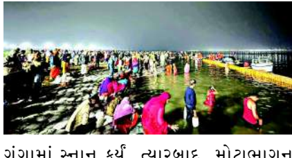
ગંગામાં સ્નાન કર્યું. ત્યારબાદ, મોટાભાગના લોકોએ પુજારીઓ પાસેથી ભગવાન સત્યનારાયણની કથા સાંભળી અને દક્ષિણા (દાનનો પ્રસાદ) અર્પણ કરી. ભક્તોએ નક્કા કુઆન મંદિર, હનુમાન મંદિર, વેદાંત મંદિર,

પશ્ચિમ ઉત્તર પ્રદેશ, દિલ્હી, હરિયાણા, રાજસ્થાન અને અન્ય રાજ્યોના ભક્તોએ સવારે બ્રહ્મ મુહૂર્ત દરમિયાન બ્રજઘાટ ખાતે સ્નાન કરવાનું શરૂ કર્યું પ્રયાગરાજ, પોષ મહિનાની પૂર્ણિમાના દિવસે, હાપુડના બ્રજઘાટ ખાતે ભક્તોએ માતા ગંગામાં શ્રદ્ધાનું સ્નાન કર્યું. જોકે, ઠંડી અને ઠંડા પવનોને કારણે ભક્તોની સંખ્યા ઓછી રહી. પશ્ચિમ ઉત્તર પ્રદેશ, દિલ્હી, હરિયાણા, રાજસ્થાન અને અન્ય રાજ્યોના ભક્તોએ શનિવારે સવારે બ્રહ્મ મુહૂર્ત દરમિયાન બ્રજઘાટ ખાતે સ્નાન કરવાનું શરૂ કર્યું. દરમિયાન, સ્થાનિક અને નજીકના ગંગા ભક્તોએ પુષ્પાવતી પૂથ અને લથિરા ખાતે બદ્રકાલી મંદિર અને અન્ય મંદિરોમાં પ્રાર્થના કરવા માટે મુલાકાત લીધી. ભક્તોએ તેમના પરિવારો અને દેશની સુખાકારી માટે પ્રાર્થના કરી. ભક્તોની સંખ્યા ઓછી હોવાને કારણે અને ટ્રાફિક ઓછો હોવાને કારણે, હાઈવે ટ્રાફિક જામથી મુક્ત રહ્યો. પોલીસ અધિકારી અને અધિક જિલ્લા મેજિસ્ટ્રેટએ શુક્રવારે રાત્રે ગંગાનગરીની મુલાકાત લીધી, જ્યારે મુખ્ય પોલીસ અધિકારી અને કોતવાલી પોલીસે શનિવારે સવારે ભક્તો માટે સુરક્ષા વ્યવસ્થાનું નિરીક્ષણ કર્યું હતું.