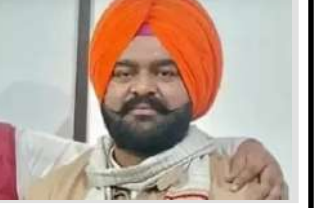
તરત જ જમીન પર પડ્યા અને તેમના માથામાંથી લોહી વહેવા લાગ્યું હતું. સત્વરે નજીકના હોસ્પિટલમાં ખસેડવામાં આવ્યા, પરંતુ સારવાર દરમિયાન તે પહેલા જ તેમનું મોત થઈ ગયું હતું. આ ઘટના અને અમૃતસર પોલીસ દ્વારા વિગતો આપવામાં આવી કે, હુમલાકાર બહારથી આવ્યા હતા અને તેમને ઓળખવાની કાર્યવાહી ચાલુ છે.