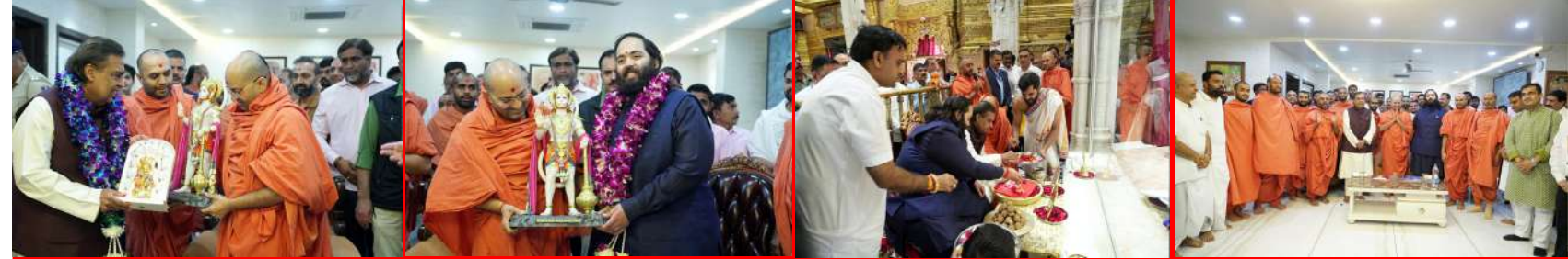
અંબાણી પરિવારને સુખ, શાંતિ અને સમૃદ્ધિ માટેના સંતોએ આશીર્વાદ પાઠવ્યા, સાળંગપુર હનુમાનજી મંદિરને ૫ કરોડનું દાન આપ્યું

બોટાદ. વિશ્વભરમાં પોતાની આગવી ઓળખ ધરાવતા અને કરોડો લોકોની આરથાના કેન્દ્ર સમાન શ્રી કષ્ટભંજનદેવ હનુમાનજી મંદિર, સાળંગપુર ધામની રવિવારે દેશના અગ્રણી ઉદ્યોગપતિ અને રિલાયન્સ ઈન્ડસ્ટ્રીઝના ચેરમેન મુકેશભાઈ અંબાણી અને અનંત અંબાણીએ મુલાકાત લીધી હતી.