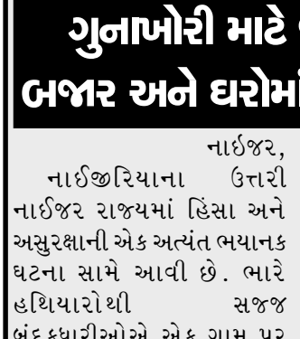
નાઈજીરિયાના ઉત્તરી નાઈજીર રાજ્યમાં હિંસા અને અસુરક્ષાની એક અત્યંત ભયાનક ઘટના સામે આવી છે. ભારે હથિયારોથી સજ્જ બંદૂકધારીઓએ એક ગામ પર હુમલો કરી ઓછામાં ઓછા ૩૦ ગ્રામજનોને મોતને ઘાટ ઉતારી દીધા છે, જ્યારે અનેક લોકોનું અપહરણ કરી લેવામાં આવ્યું છે. આ વિસ્તાર લાંબા સમયથી ગુનાખોરી અને સશસ્ત્ર જૂથોની

હિંસા ચાલી રહી છે. આ હુમલો નાઈજીર રાજ્યના બોરગુ સ્થાનિક સરકારી વિસ્તારમાં આવેલા ક્સુવાન-દાજી ગામમાં થયો હતો. પોલીસના જણાવ્યા અનુસાર, હુમલાખોરો અચાનક ગામમાં ઝાટકવા હતા અને રહેવાસીઓ પર અંધાધૂંધ ગોળીબાર શરૂ કરી દીધો હતો. જીવ બચાવવા માટે લોકો આમ-તેમ ભેગવા લાગ્યા હતા, પરંતુ આતંકીઓએ કોઈને છોડ્યા નહોતા. હુમલાખોરોએ માત્ર ગોળીબાર જ નહીં, પણ ગામના સ્થાનિક બજાર અને અનેક ઘરોને પણ આગ લગાડી દીધી હતી. આ ભીષણ આગજનીમાં ગામમાં ભારે તબાહી સર્જાઈ છે અને અનેક પરિવારો બેઘર થઈ ગયા છે. હુમલા બાદ આખા ગામમાં માત્ર યુમાડો અને બળી ગયેલી ઈમારતોના અવશેષ જ જોવા મળી રહ્યા છે. નાઈજીર રાજ્ય પોલીસના પ્રવક્તા વાસિયુ અબિયોહુને