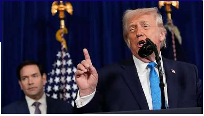
ટ્રમ્પે કહ્યું હતું કે ટેકઓવરના ભાગ રૂપે, મુખ્ય યુએસ તેલ કંપનીઓ વેનેઝુએલામાં પાછા જશે, જેમાં વિશ્વનો સૌથી મોટો તેલ ભંડાર છે, અને ખરાબ રીતે ભગડેલા તેલ માળખાને નવીનીકરણ કરશે, જે પ્રક્રિયા નિષ્ણાતોએ જણાવ્યું હતું કે વર્ષોલાગી શકે છે. તેમણે કહ્યું કે તેઓ વેનેઝુએલામાં યુએસ દળો મોકલવા માટે પુલ્લા છે.

છે તેની યોજનાની માંગ કરી હતી. ટ્રમ્પે કહ્યું હતું કે ટેકઓવરના ભાગ રૂપે, મુખ્ય યુએસ તેલ કંપનીઓ વેનેઝુએલામાં પાછા જશે, જેમાં વિશ્વનો સૌથી મોટો તેલ ભંડાર છે, અને ખરાબ રીતે ભગડેલા તેલ માળખાને નવીનીકરણ કરશે, જે પ્રક્રિયા નિષ્ણાતોએ જણાવ્યું હતું કે વર્ષોલાગી શકે છે. તેમણે કહ્યું કે તેઓ વેનેઝુએલામાં યુએસ દળો મોકલવા માટે પુલ્લા છે. "અમે જમીન પર બૂટથી ડરતા નથી," તેમણે કહ્યું. શનિવારે રાત્રે માદુરોને લઈ જતું એક વિમાન ન્યૂ યોર્ક શહેર નજીક ઉતર્યું હતું, અને ભારે પોલીસ સુરક્ષા હેઠળ બ્રુક્લિનના મેટ્રોપોલિટન ડિવિઝન સેન્ટરમાં એક મોટા કાફલા દ્વારા લઈ જવામાં આવતા પહેલા તેમને હેલિકોપ્ટર દ્વારા શહેરમાં લઈ જવામાં આવ્યા હતા.