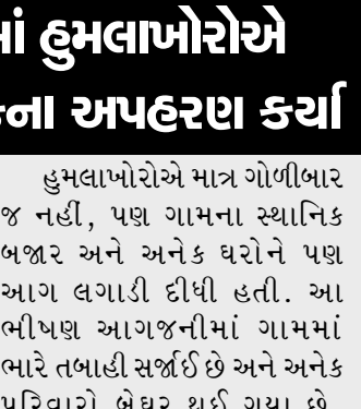
જણાવ્યું કે, સુરક્ષા દળોને વિસ્તારમાં તેનાત કરવામાં આવ્યા છે અને અપહરણ કરાયેલા લોકોની શોધખોળ માટે અભિયાન શરૂ કરાયું છે. જોકે, સ્થાનિક ગ્રામજનોએ પોલીસના આ