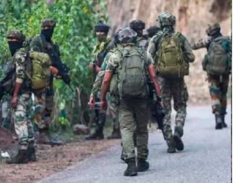
બારામુલા, જમ્મુ કાશ્મીરમાં સુરક્ષા દળો દ્વારા આતંકીઓ ઝડપવા સતત સર્ચ ઓપરેશન ચલાવવામાં આવી રહ્યું છે. જેમાં બારામુલાના સુચલીવારનના જંગલ વિસ્તારમાં રુમ માહિતીના આધારે સંયુક્ત સર્ચ ઓપરેશન હાથ ધરવામાં આવ્યું છે. આ ઓપરેશન પોલીસ, સીઆરપીએફ, એએસટી અને બોઅ

ડિસ્પોઝલ સ્કવોડ સામેલ છે. જેમાં સુરક્ષા દળોએ એક આતંકીઓના છુપાવાનું સ્થાન મળી આવ્યું છે. આ સ્થળેથી શંકાસ્પદ વસ્તુઓ અને વિસ્ફોટકો પણ મળી આવ્યા છે. સુરક્ષા દળોને મળેલી ગુપ્ત માહિતીના આધારે બારામુલાના સુચલીવારન જંગલમાં સર્ચ ઓપરેશન હાથ ધર્યું હતું. જેમાં આતંકવાદીઓના ઠેકાણામાંથી ચોવીસ કાટ લાગેલી છદ્મ-જીંડ ગોળીઓ, બે હેન્ડ ગ્રેનેડ, માંસાહાર ભરેલો ડબ્બો, દવાઓ, વાયરલેસ એન્ટેના, કરવત, છત્રી, જૂતા, કુહાડી, વાયર કટર અને અન્ય રોજિંદી વસ્તુઓ મળી આવી હતી. જેની બાદ આ ઠેકાણાનો નાશ કરવામાં આવ્યો હતો. આ ઓપરેશનમાં જાનહાનીના કોઈ અહેવાલ નથી. આ સર્ચ ઓપરેશન દરમિયાન એસીક્લોફેનાક, પેરાસીટામોલ અને ક્લોરોક્સાલોન સહિતની કેટલીક દવાઓ પણ મળી આવી હતી. આ સામગ્રી સ્પષ્ટપણે દર્શાવે છે કે આ છુપાવાનું સ્થળ લાંબા સમયથી ઉપયોગમાં લેવામાં આવતું હતું.