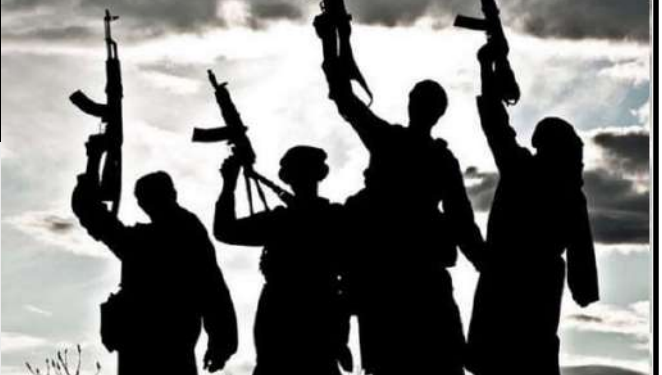
દાવાઓને પોકળ ગણાવ્યા છે. લોકોનો આરોપ છે કે રવિવાર સુધી ગામમાં કોઈ સુરક્ષા બળ લોકોની શોધખોળ માટે અભિયાન શરૂ કરાયું છે. જોકે, સ્થાનિક ગ્રામજનોએ પોલીસના આ