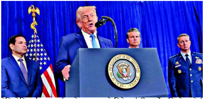
ટ્રમ્પે વોશિંગ્ટનમાં રાષ્ટ્રપતિ તરીકે શપથ લીધું છે. તેમણે વેનેઝુએલા માટે યોગ્ય પગલાં નહીં ભરે, તો તેમને માદુરો કરતાં પણ મોટી કિંમત ચૂકવવી પડી શકે છે.

વોશિંગ્ટન/કારાકાસઃ અમેરિકાની વેનેઝુએલા પરની કાર્યવાહી બાદ હાલ તમામ સત્તાઓ ડેલ્સી રોડ્રિગેઝના હાથમાં છે. ઉપરાષ્ટ્રપતિ ડેલ્સી રોડ્રિગેઝને હાલ કાર્યવાહક રાષ્ટ્રપતિ બનાવવામાં આવ્યા છે. જેવો તેમણે પદભાર સંભાળ્યો કે તરત જ અમેરિકી રાષ્ટ્રપતિએ તેમને ચેતવણી જાહેર કરી દિધી છે.