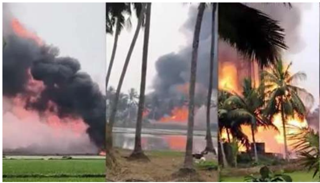
અધિકારીઓએ નજીકના ગામોને ખાલી કરાવી દીધા છે. ડરમિયાન, ગેસ લીકેજને કારણે લાગેલી આગમાં સેંકડો નારિયેળના ઝાડ બળી ગયા હતા.

ગેસ લીકેજને કારણે લાગેલી આગમાં સેંકડો નારિયેળના ઝાડ બળી ગયા : સાવચેતીના ભાગ રૂપે, અધિકારીઓએ નજીકના ગામોને ખાલી કરાવી દીધા